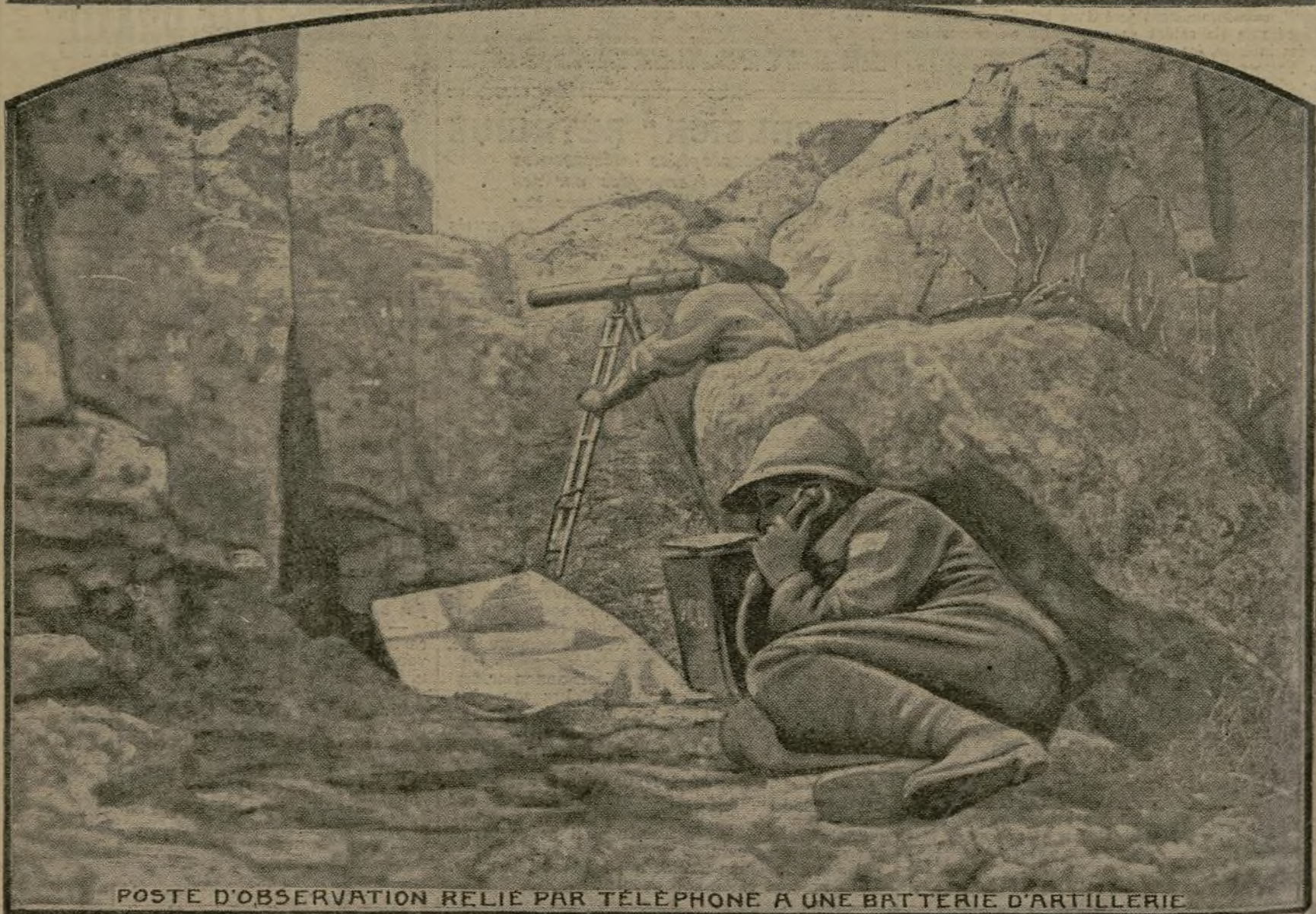
POSTE D'OBSERVATION RELIE PAR TÉLÉPHONE A UNE BATTERIE D'ARTILLERIE

Tous les alliés, réunis sous le commandement du général Sarrail en Macédoine, rivalisent d'ardeur pour organiser la ligne de combat et ses abords immédiats en prévision du jour où l'action prendra une plus grande envergure. Les troupes britanniques se font particulièrement remarquer par leur zèle et par la façon éminemment pratique dont elles réalisent ces travaux de défense.