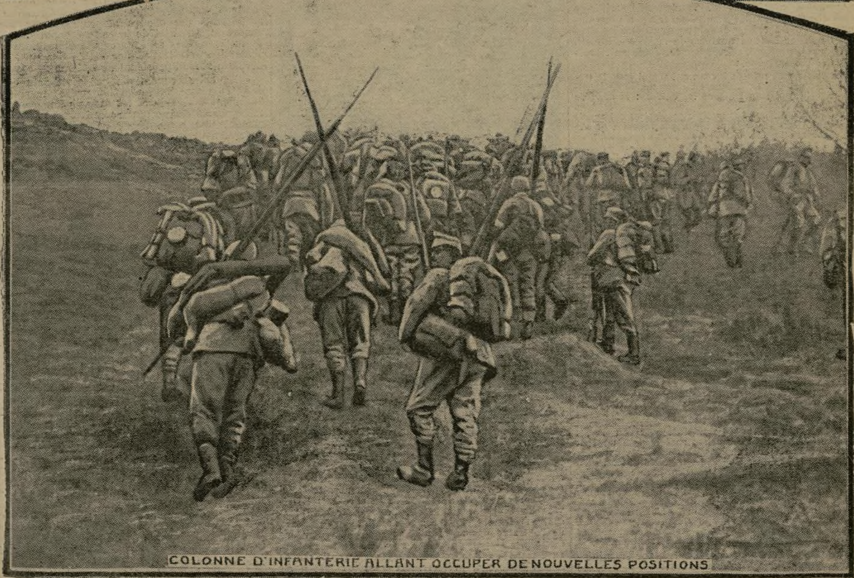
COLONNE D'INFANTERIE ALLANT OCCUPER DE NOUVELLES POSITIONS

A mesure qu'ils avancent sur le territoire roumain, les envahisseurs rencontrent une résistance qui se fait de plus en plus tenace. La dernière bataille qui vient de faire perdre Braïla à nos alliés a nécessité de la part de l'ennemi un effort gigantesque, les Roumano-Russes utilisant un matériel d'artillerie formidable, grâce auquel l'avance bulgaro-allemande n'a été réalisée qu'au prix de très durs sacrifices.