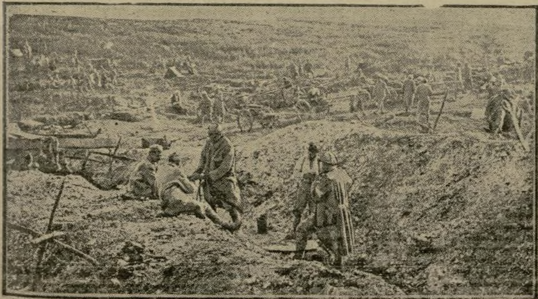
A L'ARRIERE DES LIGNES, SUR LE FRONT DE LA SOMME

Il a également établi le plan, réalisé après son expulsion, de la répartition de l'artillerie, des munitions et des vivres, dans des villages où il est plus facile de les dissimuler que dans les garnisons ordinaires. Il a préparé en même temps l'accumulation de céréales qui, malgré le blocus, per-