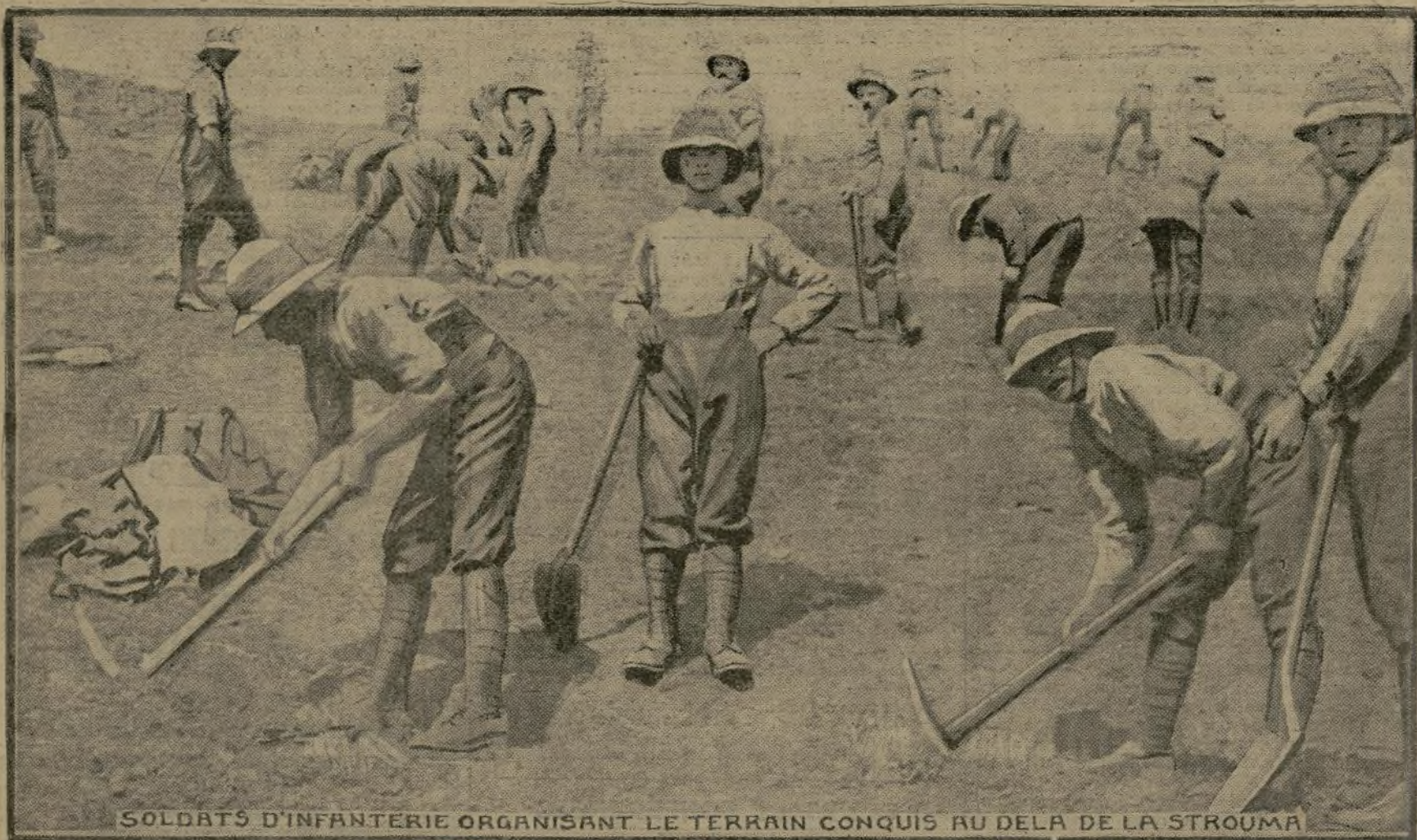
SOLDATS D'INFANTERIE ORGANISANT LE TERRAIN CONQUIS AU DELA DE LA STROUMA