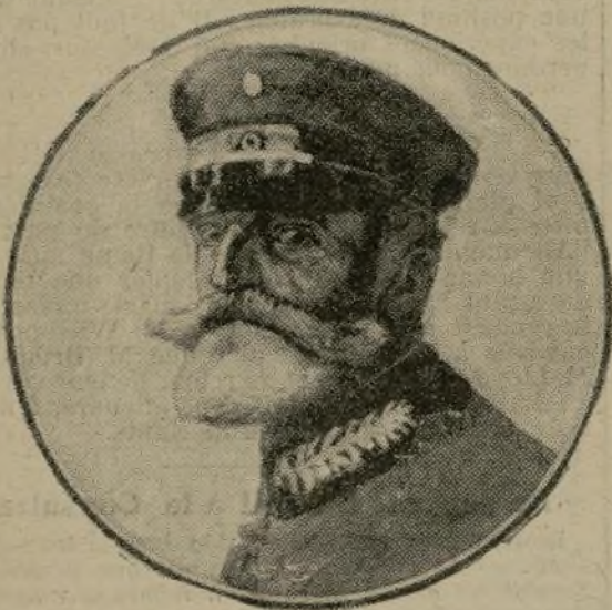
LE MAJOR FALKENHAUSEN agent de liaison entre le kaiser et Constantin