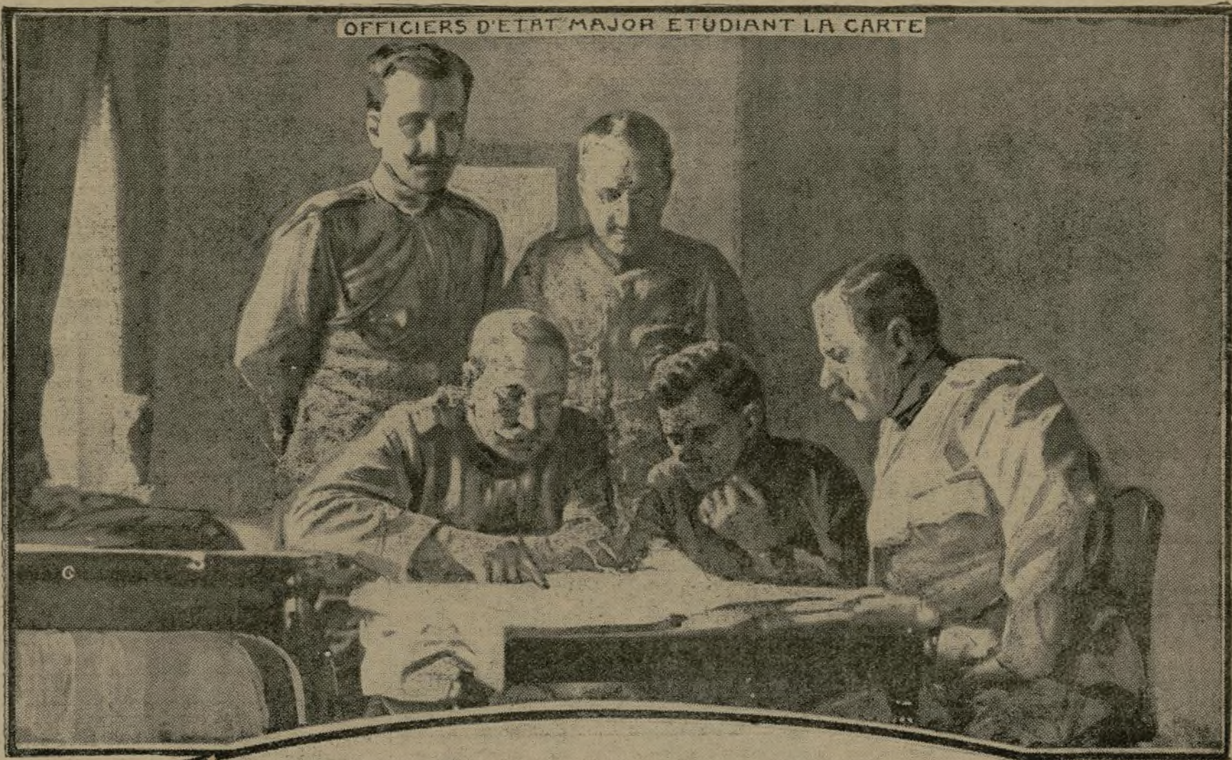
OFFICIERS D'ETAT MAJOR ETUDIANT LA CARTE