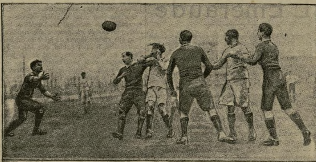
AU PARC DES PRINCES : LE MATCH STADE P. U. C.