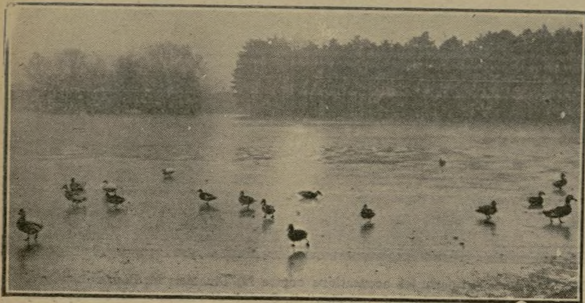
Avec le froid vif, la glace a fait son apparition à la surface du lac du bois de Boulogne et, du même coup, on a vu les premiers patineurs. Oh ! de taille menue et si malhabiles sur le miroir qui recouvre leur domaine : ce sont les canards familiers du Bois.

SITUATIONS Brochure envoyée franco, PIGIER, Boulevard Poissonnière, 19