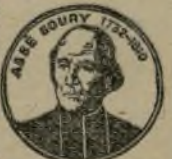
Exiger ce portrait

C'est d'abord une sensa- tion d'étouffement et de suffocation qui étirent la gorge, des bouffées de cha- leur qui montent au visage pour faire place à une sueur froide sur tout le corps. Le ventre devient douloureux, les règles se renouvellent irrégulièrement ou trop abondantes et bientôt la femme la plus robuste se trouve affaiblie et exposée aux pires dangers. C'est alors qu'il faut sans plus tarder faire une cure avec la