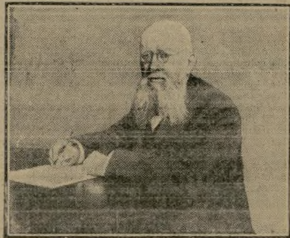
LE DOCTEUR KAEMPF Président du Reichstag

AMSTERDAM, 23 janvier. — On mande de Berlin : Les présidents des Parlements des Empires centraux visiteront demain soir le grand quartier général, où ils seront reçus par l'empereur.