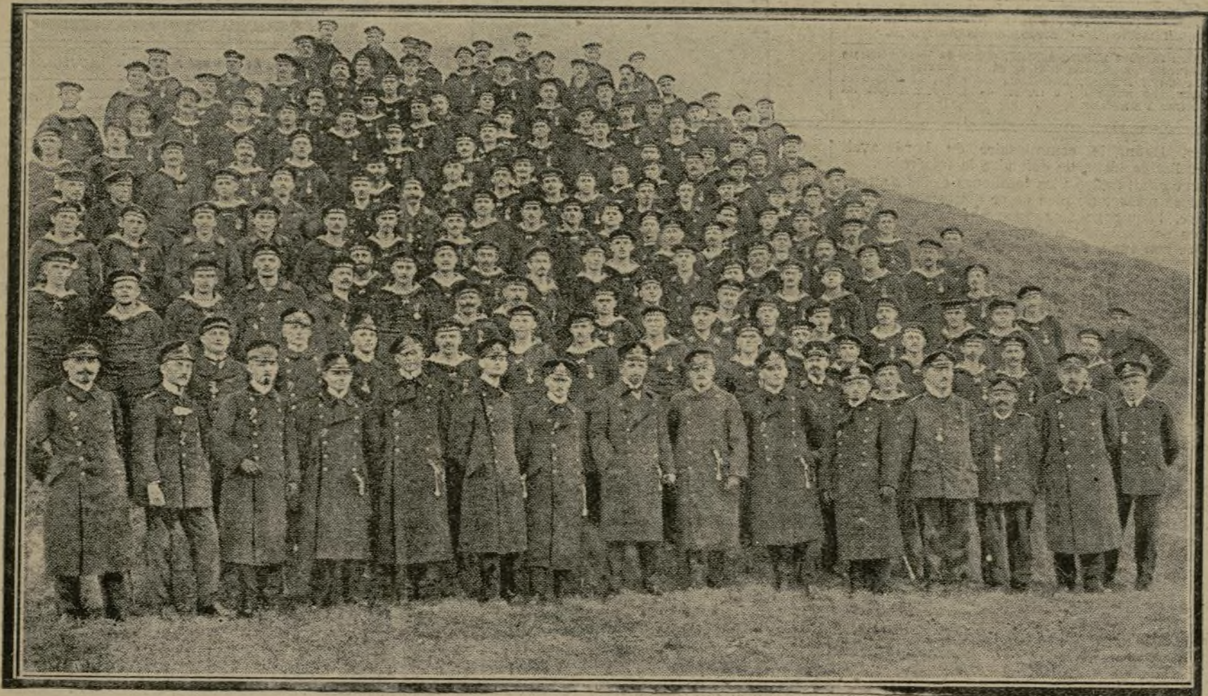
On a de fortes raisons de croire que le pirate allemand coulé à l'embouchure de la rivière Para, au Brésil, par le croiseur anglais "Glasgow", est le fameux "Mœwe" qui, en mars 1916, coula quinze navires dans l'Atlantique. Le "Mœwe" avait réussi à regagner l'Allemagne. C'est à ce moment que le commandant von Dohna (X) fut photographié avec son équipage.