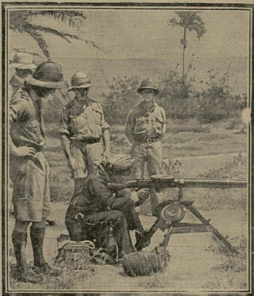
Les troupes anglaises viennent d'accomplir de grands progrès dans l'Est-Africain. Voici, devant des officiers, le sultan de Zanzibar essayant une mitrailleuse.