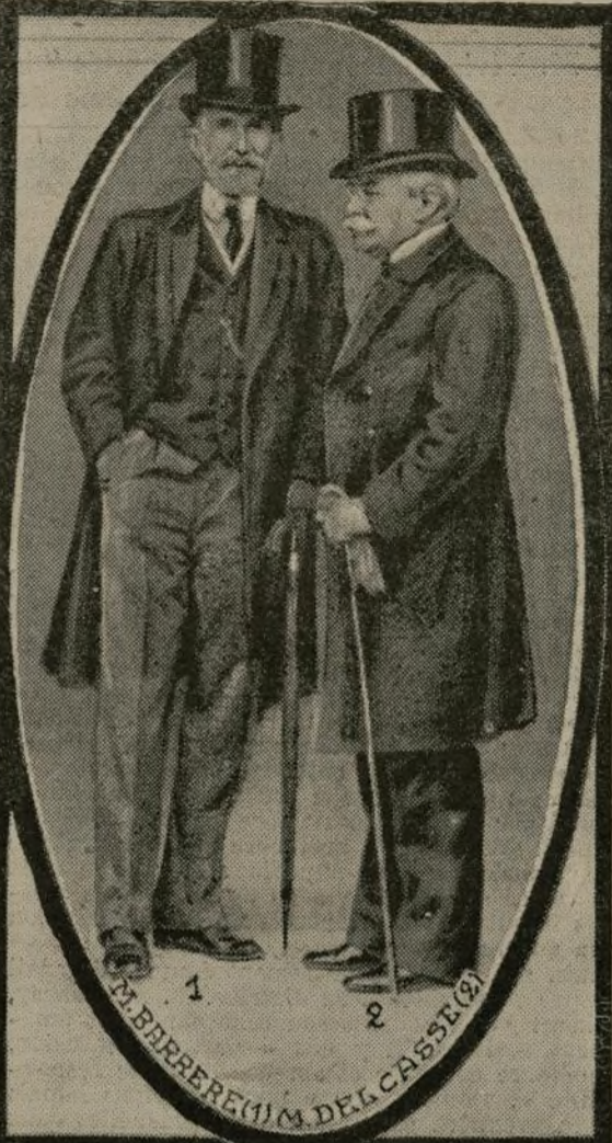
M. BARRÈRE (1) M. DEL CASSE (2)

Il y avait, hier, cinquante-six ans que les troupes franco-piémontaises infligeaient aux Autrichiens la défaite de Solférino. A l'occasion de cet anniversaire, la Ligue Franco-Italienne et les Amis de Paris avaient organisé, au Trocadéro, une fête à laquelle assistèrent le président de la République et M. Barrère, ambassadeur de France en Italie.