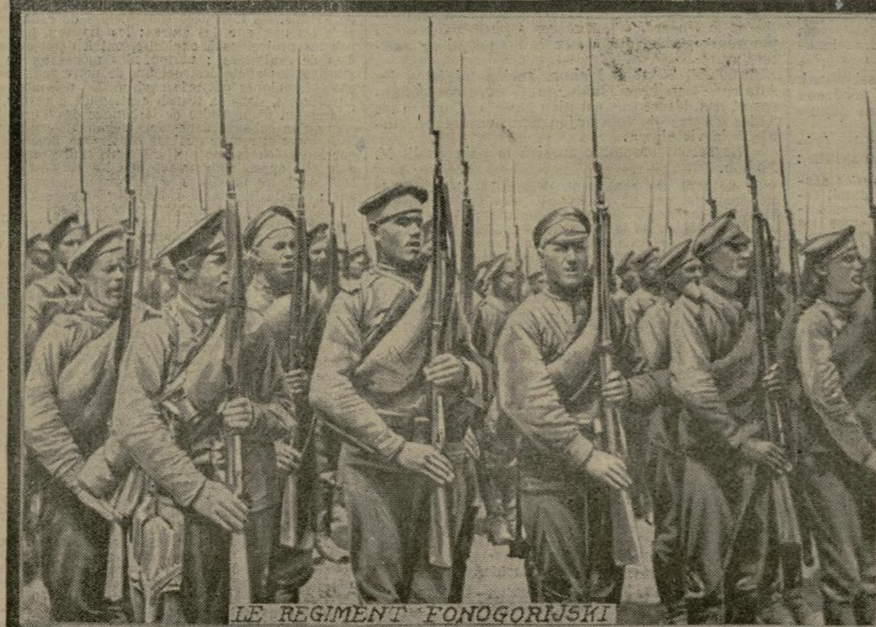
LE RÉGIMENT FONOGORIJSKI