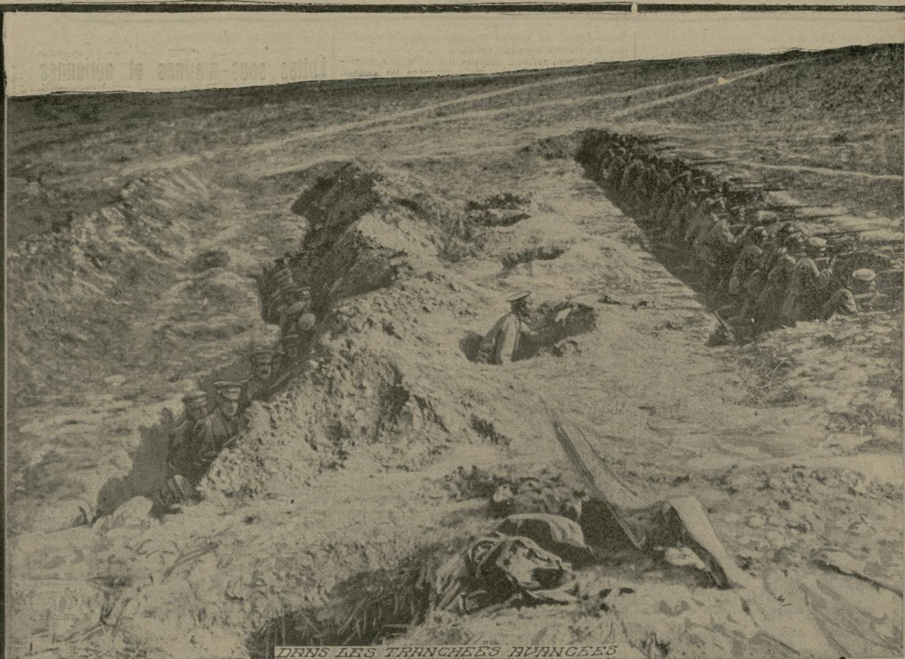
DANS LES TRANCHÉES AVANCÉES