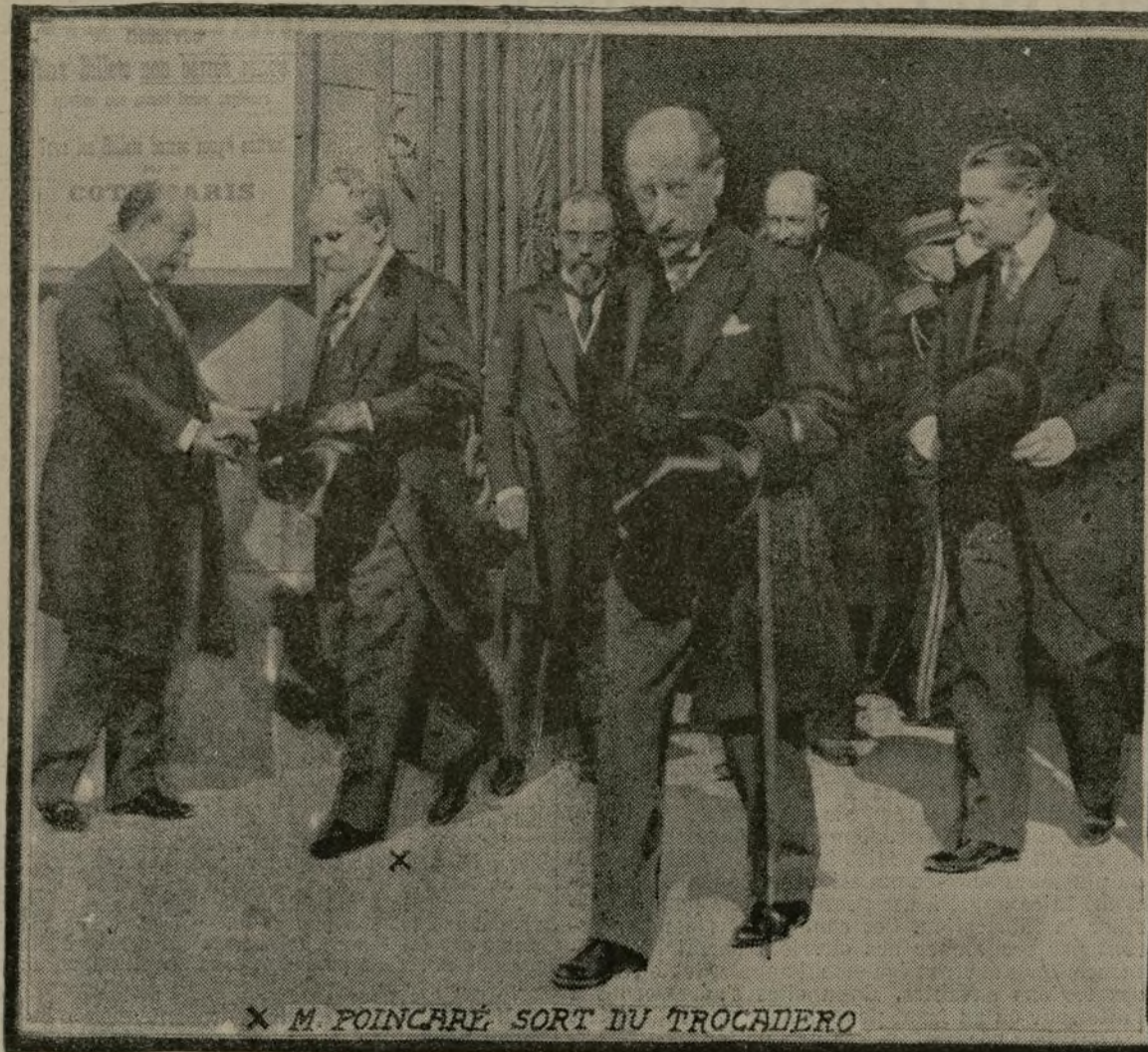
X M. POINCARÉ SORT DU TROCADÉRO