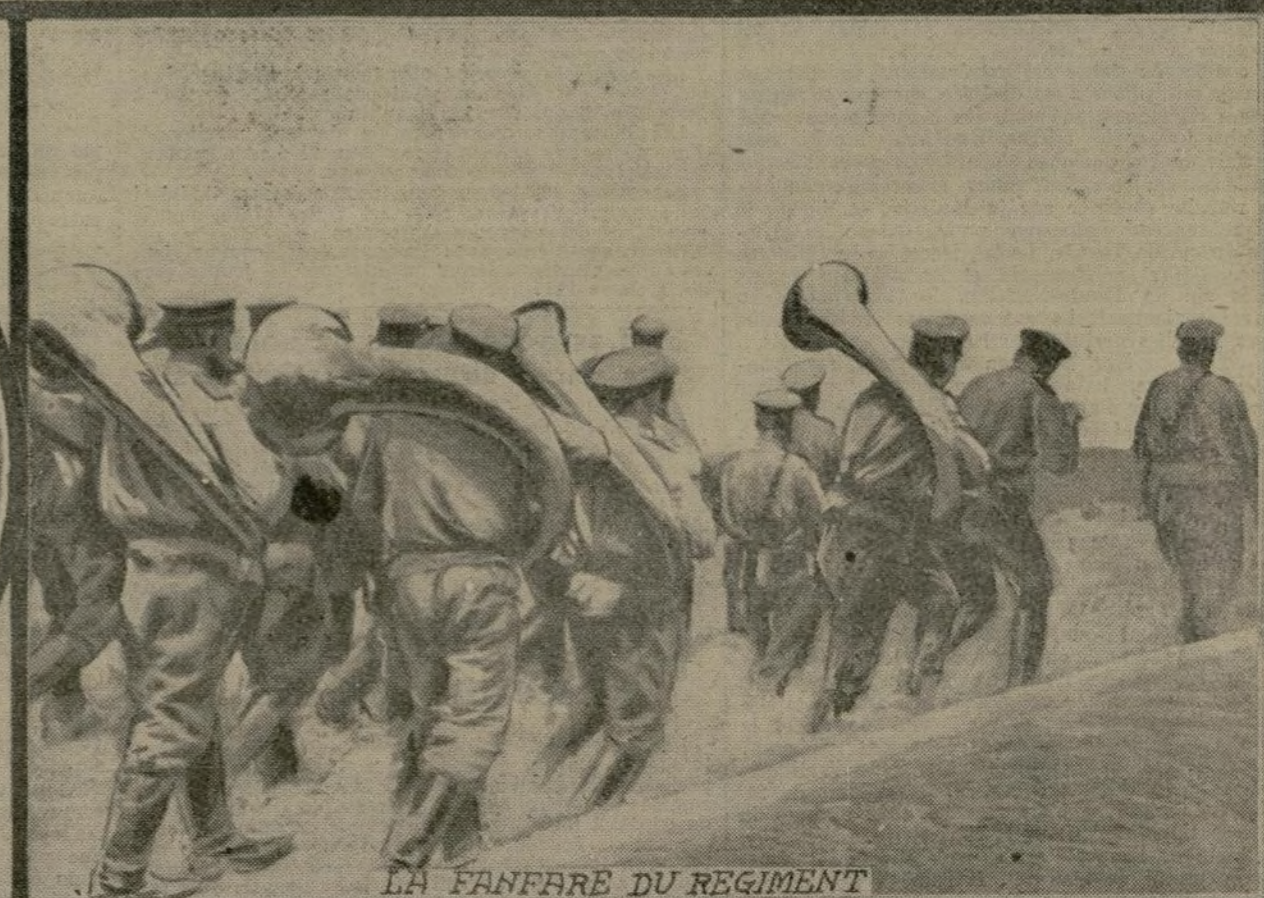
LA FANFARE DU RÉGIMENT

Glorieux entre tous, le régiment Fonogorijski, de Moscou, a été mêlé à un grand nombre d'actions depuis août dernier. Il est venu sur les lieux du combat à marches forcées, à travers les montagnes, et s'est fait une véritable spécialité des triomphantes charges à la baïonnette. L'une des opérations les plus mémorables où il intervint fut celle qui se termina par la défaite de la 25 e division autrichienne, réduite à néant. La pointe du fer ! Les héros du régiment Fonogorijski sont très populaires en Russie, et l'ambition des jeunes recrues est d'y être affectées.