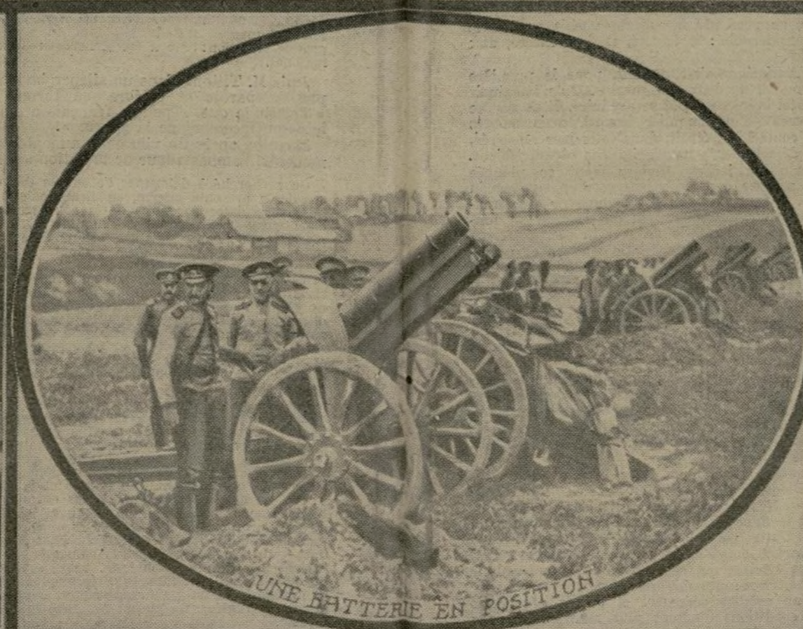
UNE BATTERIE EN POSITION