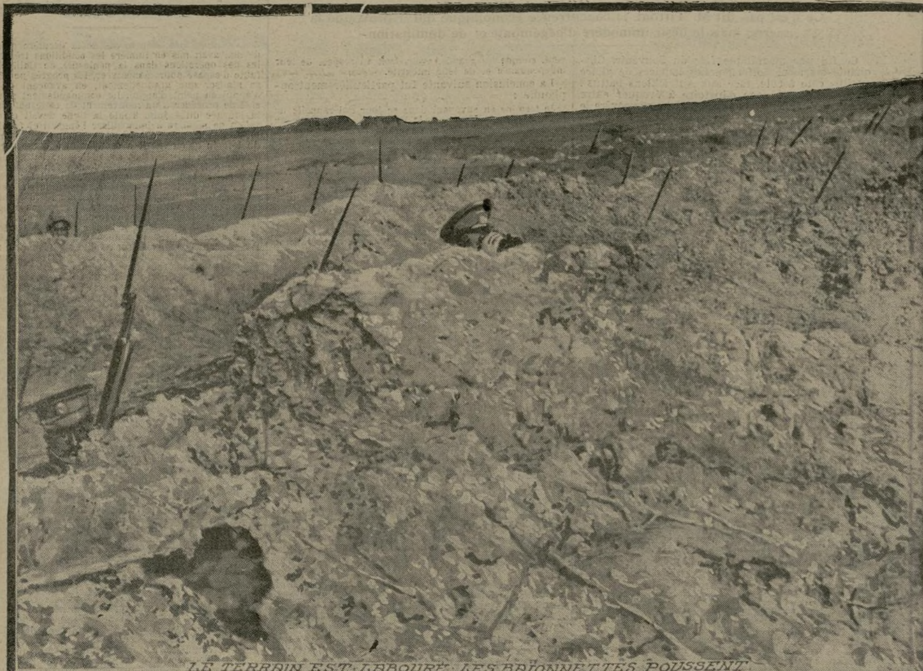
LE TERRAIN EST LABOURÉ. LES BRÛNETTES POUSSENT