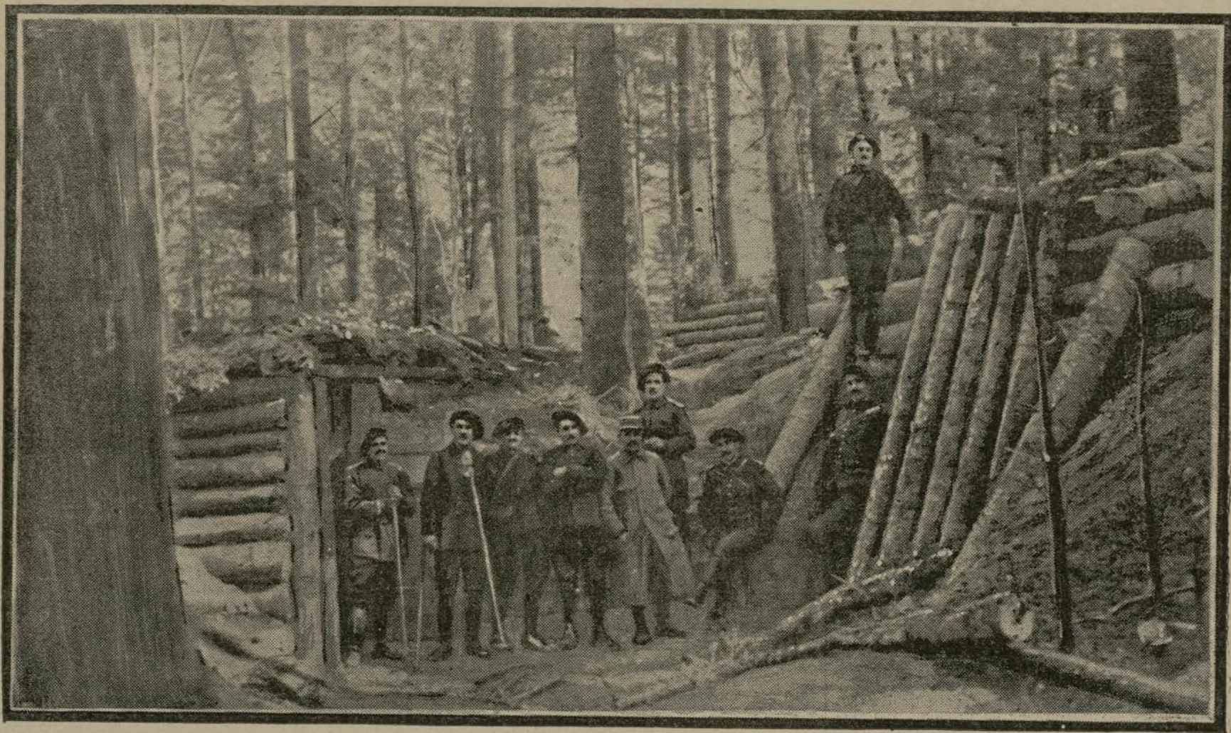
La nature si pittoresque et si mouvementée des régions alsaciennes où nous progressons et nous consolidons tous les jours procure à nos braves l'occasion d'aménager des abris très confortables, où les matériaux essentiels sont les troncs d'arbres dont, de temps immémorial, les bûcherons se servent pour architecturer leurs gîtes forestiers.