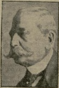
M. JEAN LAHOVARY

La famille Lahovary est de celles qui ont bien mérité de la patrie. Elle a donné à la Roumanie trois hommes d'Etat avec les trois frères Alexandre, Jacques et Jean, tous les trois morts aujourd'hui. Alexandre avait été ministre des Affaires étrangères. Le général Jacques avait régi deux fois le ministère de la Guerre, et Jean avait fait partie de plusieurs cabinets, comme ministre des Domaines, des Affaires étrangères et du Commerce. Homme d'une intégrité à toute épreuve, il avait toujours appartenu, comme ses frères, au vieux parti conservateur roumain, dont il avait été nommé, tout récemment, chef, en remplacement de M. Marghiloman, l'acharné défenseur de la neutralité de son pays. M. Jean Lahovary, par contre, était partisan de l'intervention immédiate de la Roumanie aux côtés de la Quadruple-Entente. Ami de la France, fier de la latinité de sa patrie, il s'en va à un moment où son avis était fort utile à la couronne, mais laissant scellée l'alliance entre conservateurs et conservateurs démocrates de M. Take Jonsco, qui soutiendront à la Chambre la théorie de l'intervention.