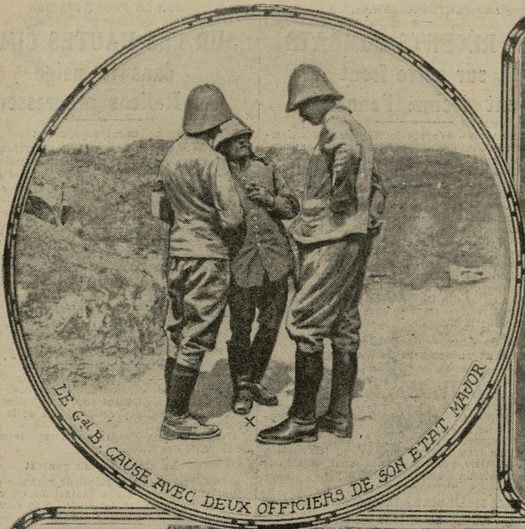
LE GÉN. B. CAUSE AVEC DEUX OFFICIERS DE SON ÉTAT MAJOR