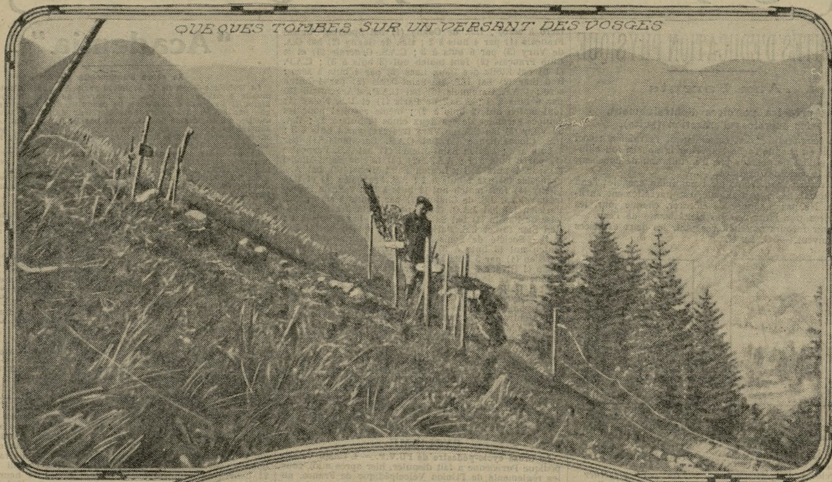
QUEQUES TOMBES SUR UN VERSANT DES VOSGES