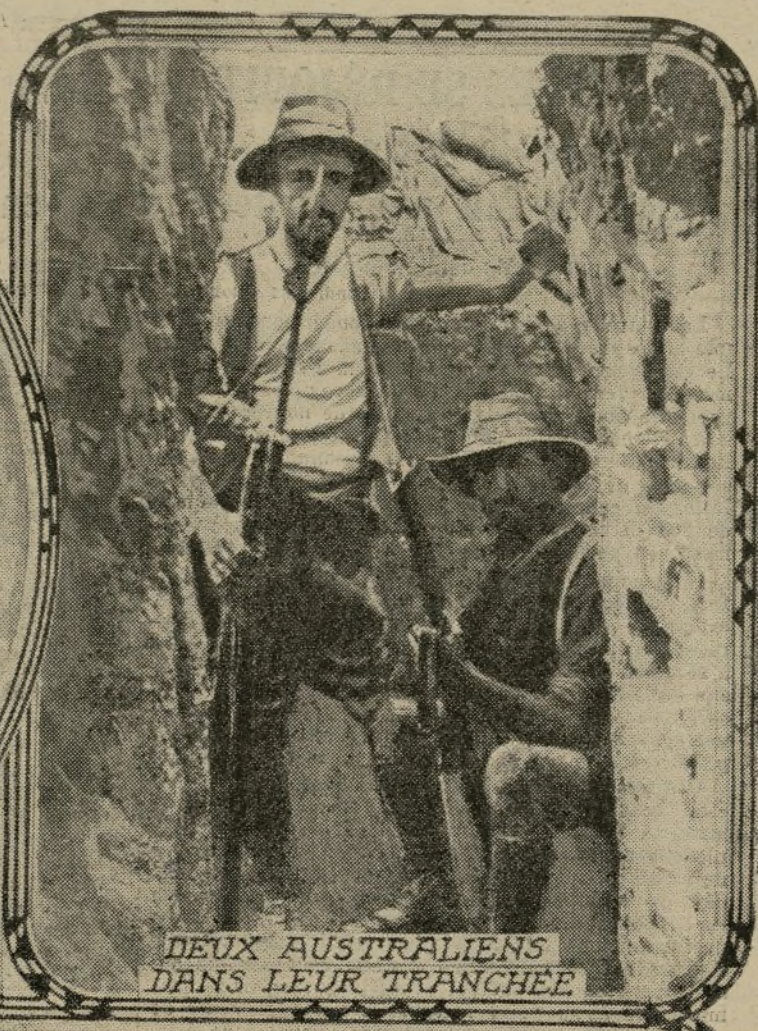
DEUX AUSTRALIENS DANS LEUR TRANCHEE