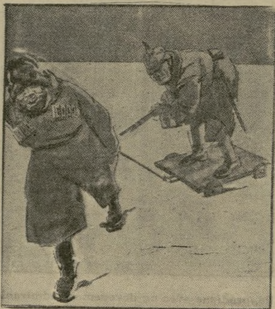
La pénétration allemande en Russie!