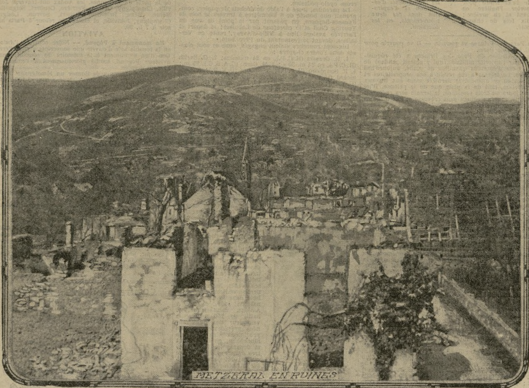
METZEREL EN RUINES

Mourir pour la patrie est le sort le plus beau, dit l'hymne de nos pères. Mais quelle belle mort, entre toutes, que celle du Français qui donna son sang pour la noble cause et qui, tombé en Alsace reconquise, repose parmi les sapins vosgiens, sur la pente des coteaux, sa croix de bois inclinée vers la vallée d'où seront portés vers lui, plus tard, des bouquets aux trois couleurs.