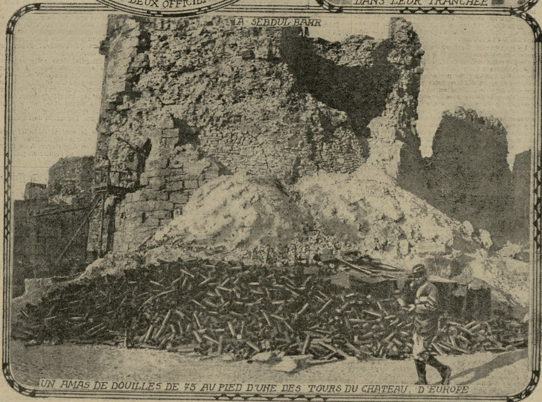
UN AMAS DE DOUILLES DE 75 AU PIED D'UNE DES TOURS DU CHATEAU D'EUROPE

Au pied du fort démantelé de Sedd-ul-Bahr s'amoncelle — et c'est un spectacle qui peut être vu sur bien d'autres points — le tas des douilles d'obus de 75. Les Australiens continuent à servir avec un dévouement admirable la cause de la métropole et des Alliés. Le général B... est, en Orient, un des plus actifs collaborateurs du général Bailloud.