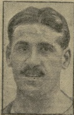
JEAN BOUIN tombé au champ d'honneur, le 29 septembre 1914.

Anniversaire douloureux. — Il y a un an, exactement le 29 septembre 1914, que le célèbre coureur à pied Jean Bouin tombait au champ d'honneur.