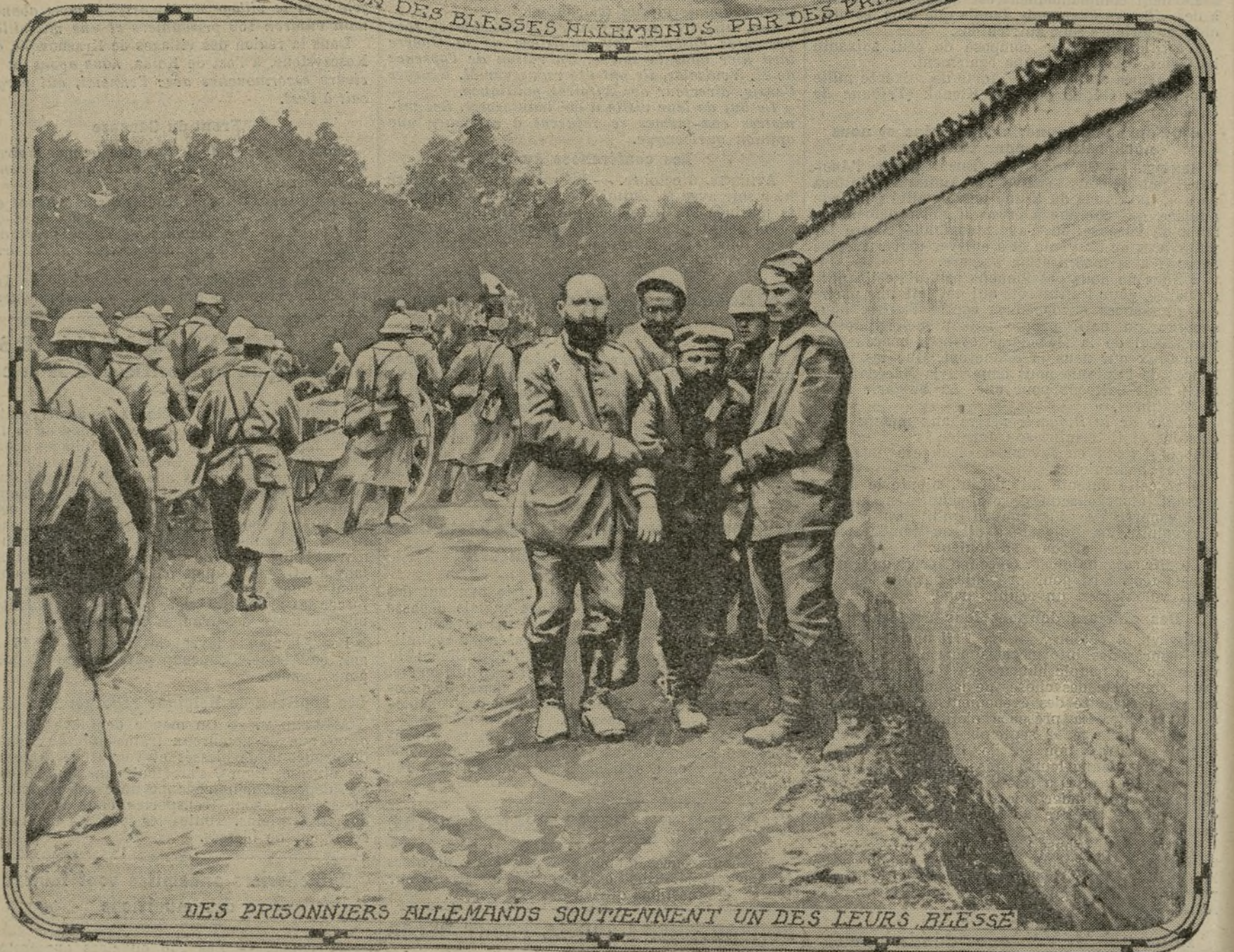
DES PRISONNIERS ALLEMANDS SOUTIENNENT UN DES LEURS BLESSE

L'acheminement des prisonniers allemands vers les camps où ils attendront la fin de la guerre est terminé, en ce qui concerne les officiers et les hommes tombés entre nos mains lors des affaires de Champagne et d'Artois. Beaucoup d'entre eux étaient extrêmement épuisés, et les autres, grièvement blessés, durent être transportés par leurs compagnons d'armes. Est-il besoin de dire que les soins que comportait leur état leur ont été donnés, avec leur dévouement coutumier, par nos majors et nos infirmières ?