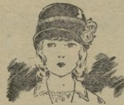
Chapeau de velours noir, ruban d'argent et roses de soie.

Il semblerait que la toilette de nos petits elle-même, malgré son extrême simplicité apparente, soit plus recherchée et surtout plus pratique. Les mamans ont à cœur, quand les papas viennent en permission, de leur montrer leurs chers petits bien habillés ; elles veulent qu'ils s'évoquent à la pensée de l'absent, avec telle petite robe amusante ou tel bonichon drôlet, silhouettant gentiment une gamine ou un petit bonhomme.