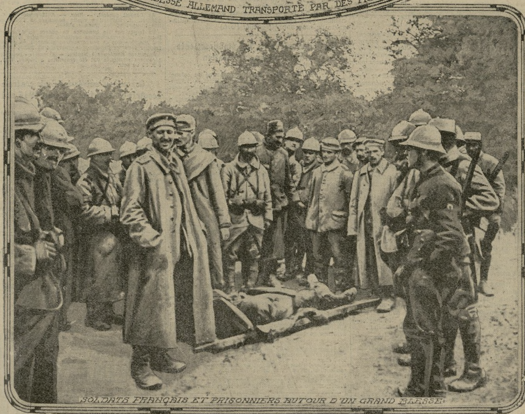
SOLDATS FRANÇAIS ET PRISONNIERS AUTOUR D'UN GRAND BLESSE

Les documents nous parviennent de plus en plus nombreux, pittoresques et probants, sur les opérations d'évacuation des prisonniers allemands, en arrière de notre front, à l'issue des grandes batailles récentes. On assure que les journaux illustrés d'outre-Rhin sont abondamment pourvus de photographies qui démontrent chaque jour, aux Germains, l'importance des succès de leurs armées. Gageons qu'ils ne publieront pas celles-ci.