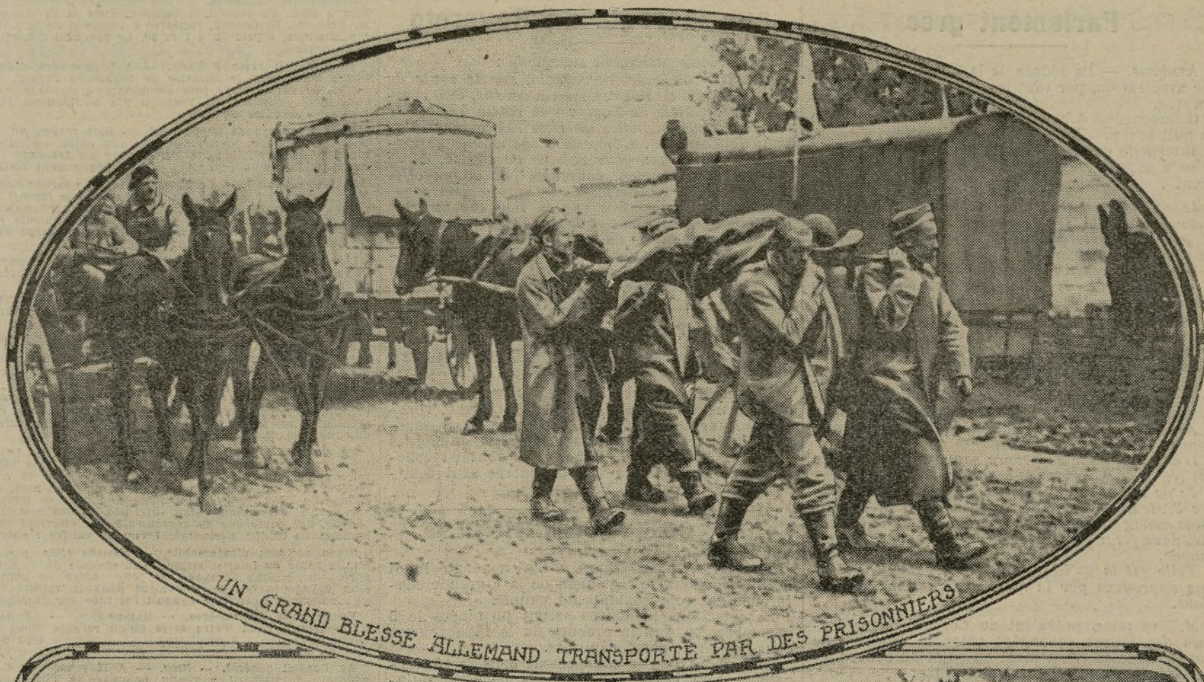
UN GRAND BLESSE ALLEMAND TRANSPORTE PAR DES PRISONNIERS