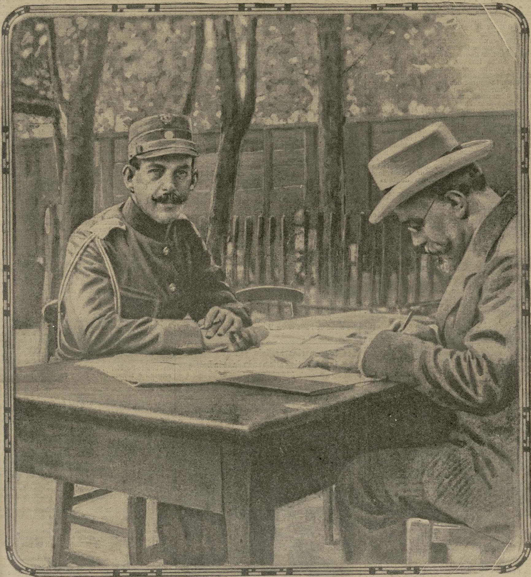
Cette photographie, prise en 1913, pendant la dernière guerre balkanique, montre qu'au moment où la victoire prodiguait ses lauriers aux Hellènes alliés des Serbes et vainqueurs des Turcs et des Bulgares, le roi Constantin et son premier ministre, M. Venizelos, étaient d'accord. Il est curieux de revoir ce document, à l'heure où le destin de la Grèce se joue et où, entre le roi et le ministre, une nouvelle raison de discorde vient de s'élever. (Phot. Jean Leune, d'après l'illustration.)