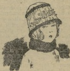
Chapeau de paille bleue et fourrure guirlande de fleurs.