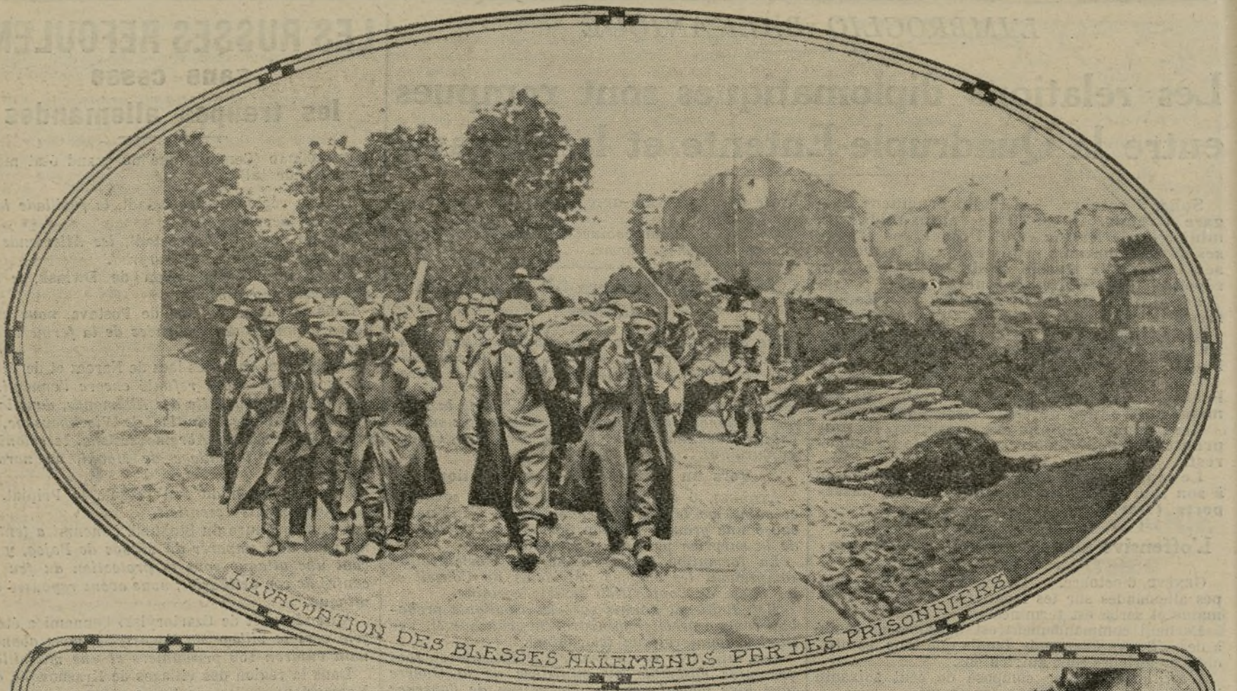
L'EVACUATION DES BLESSES ALLEMANDS PAR DES PRISONNIERS