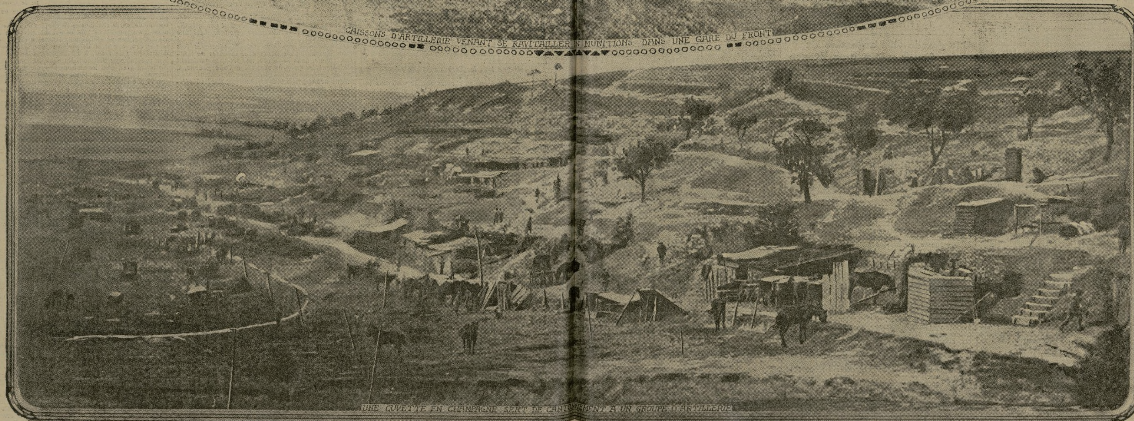
UNE CUVETTE EN CHAMPAGNE SERT DE CANTONNEMENT A UN GROUPE D'ARTILLERIE

Dans une « cuvette » récemment conquise en Champagne, nos troupes, pendant la préparation des nouveaux assauts qui nous rendront un peu plus de notre territoire, ont aménagé une série de pittoresques gourbis où règne la plus grande activité. C'est vers des positions de ce genre, parfaitement abritées et offrant à nos troupes les plus solides positions, que sont dirigés, en quantités