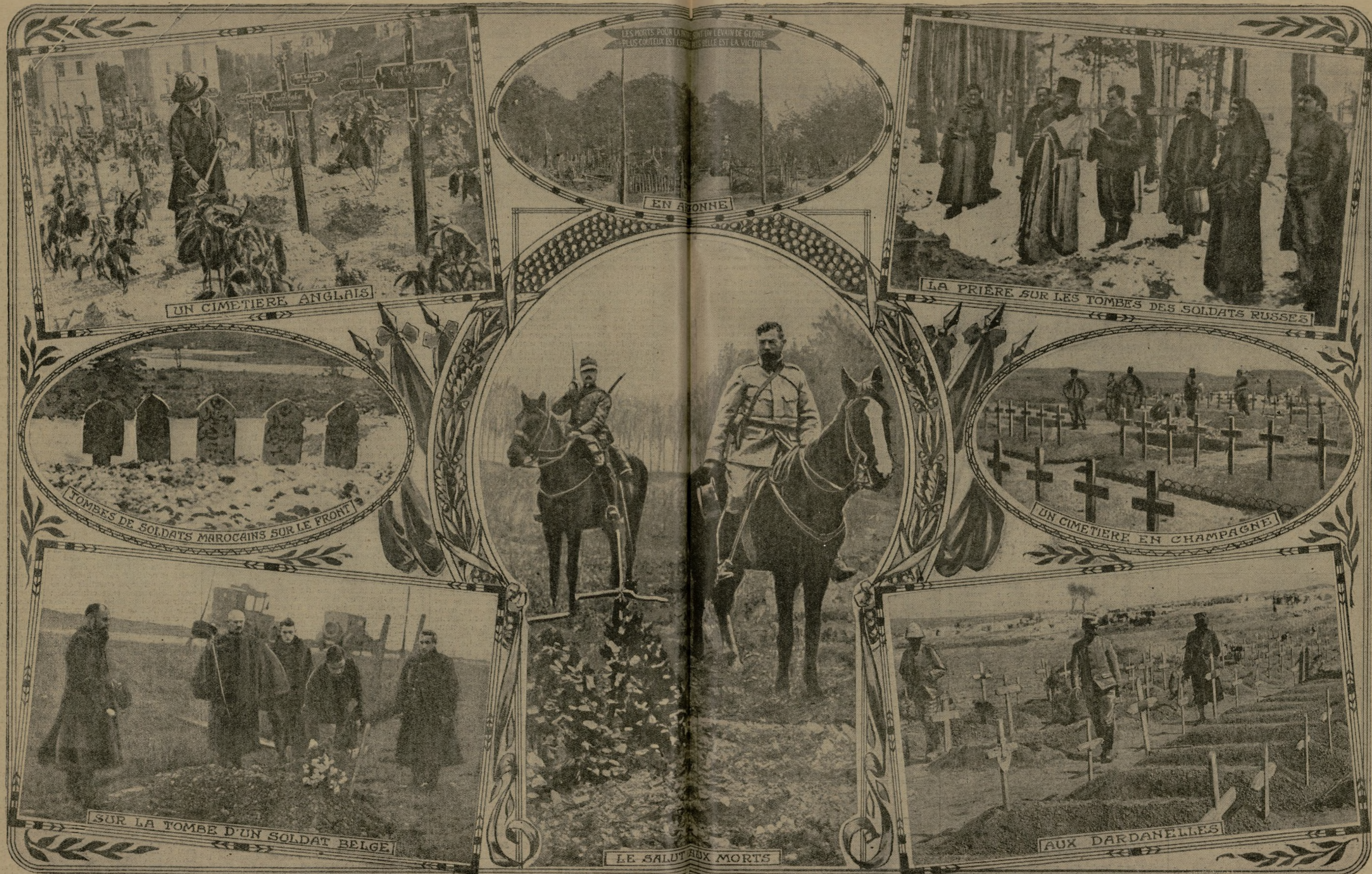
UN CIMETIERE ANGLAIS