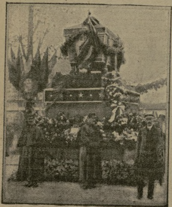
Le catafalque érigé au cimetière d'Ivry

Elles sont beaucoup qui le célébreront dans l'intimité de leur cœur, ce jour de 1 er novembre. L'enfant, l'époux, le frère, est tombé quelque part, sur le vaste front, en Argonne, en Flandre, en Alsace, hors de France... Elles n'auront pas toujours la réalité toute proche d'une tombe qu'on fleurit, pour fixer la dernière image. Alors, les yeux clos, attentives à leur rêve, elles verront, très loin, une plaine, un chemin défoncé qu'une tranchée récente entaillait, les maisons d'un vil-