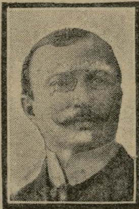
M. DE MONZIE

La motion déposée par M. de Monzie, pour inviter le gouvernement à s'adjoindre un conseiller musulman, qui serait obligatoirement consulté sur toutes les affaires concernant l'Islam, remet en question la proposition de M. Paul Bluysen concernant l'administration de notre Afrique du Nord. Il est utile que de telles préoccupations se fassent jour à l'heure même où la lutte pour Constantinople réveille chez nos adversaires des espoirs menaçants.