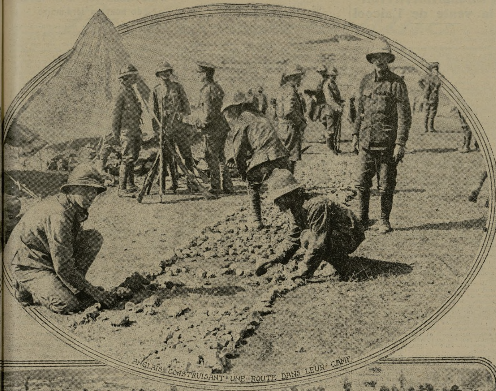
ANGLAIS CONSTRUISANT UNE ROUTE DANS LEUR CAMP