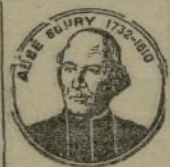
Exiger ce portrait

Notice contenant renseignements gratuits