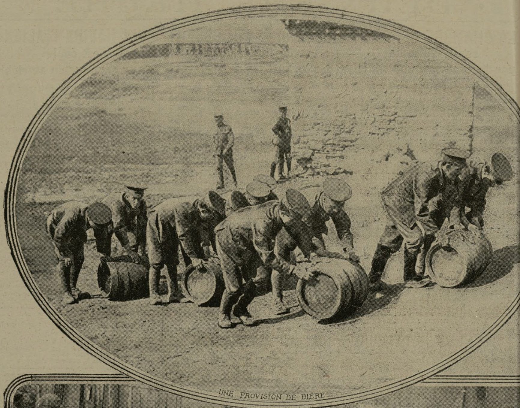
UNE PROVISION DE BIÈRE