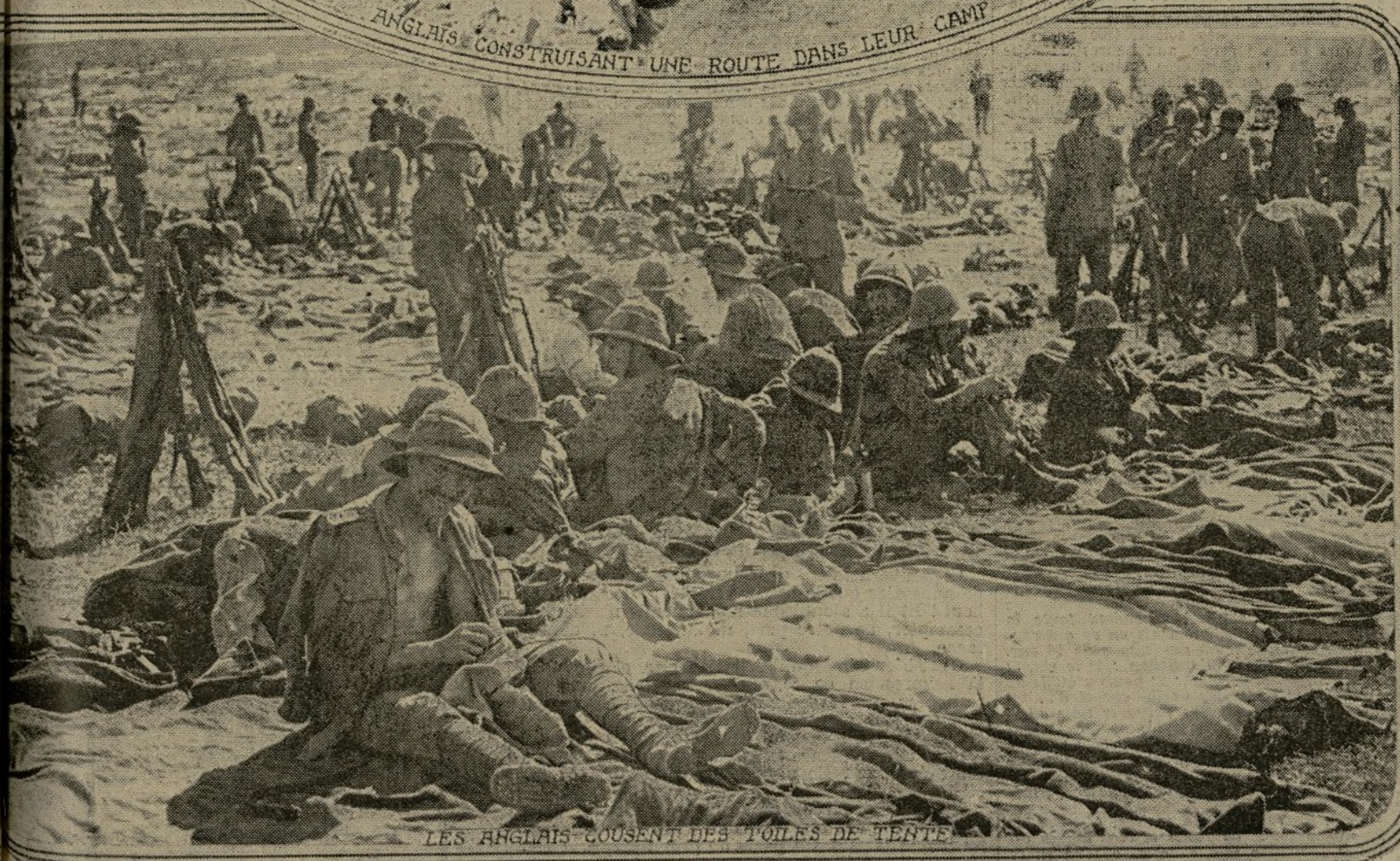
LES ANGLAIS COUSENT DES TOILES DE TENTE

Le sens pratique qui caractérise les Anglais leur a rendu les plus précieux services depuis que leurs premiers contingents ont mis le pied sur le sol de Salonique. Rien n'a été négligé de ce qui pouvait faire aux troupes un séjour confortable et sain dans ce pays d'où elles se dirigent chaque jour en plus grand nombre vers les lignes de combat. Aussi, à chaque débarquement, peut-on constater que nos alliés, sur ce front comme sur le front occidental, ont prévu, jusqu'aux moindres détails, l'organisation matérielle