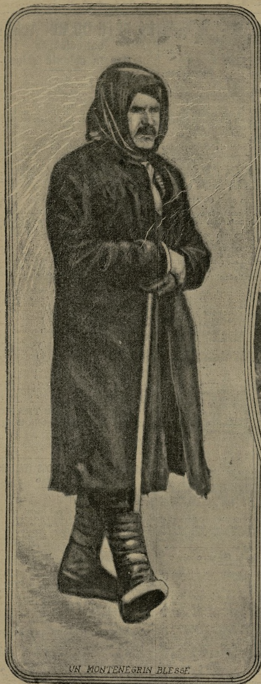
UN MONTENEGRIN BLESSE