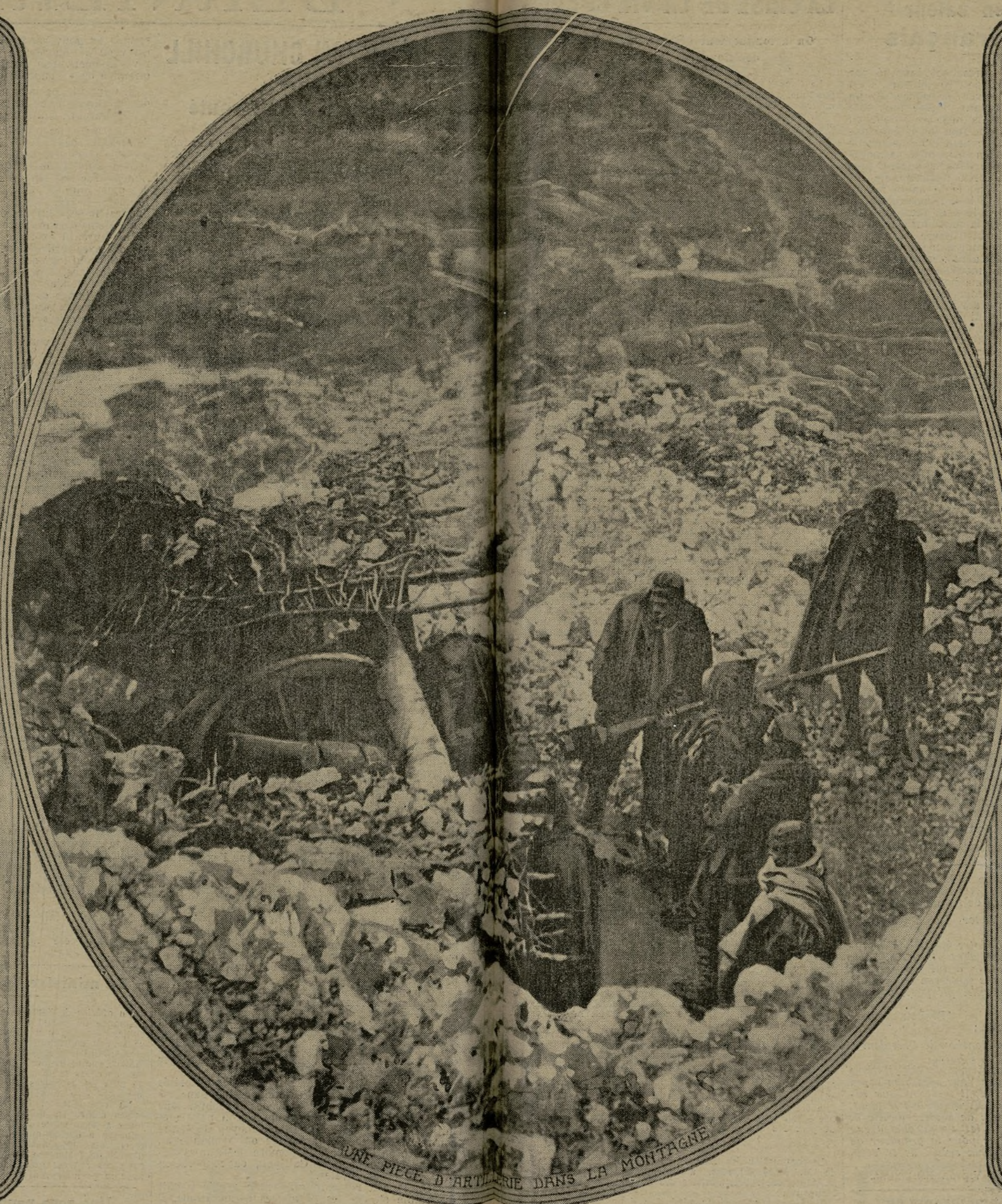
UNE PIÈCE D'ARTILLERIE DANS LA MONTAGNE