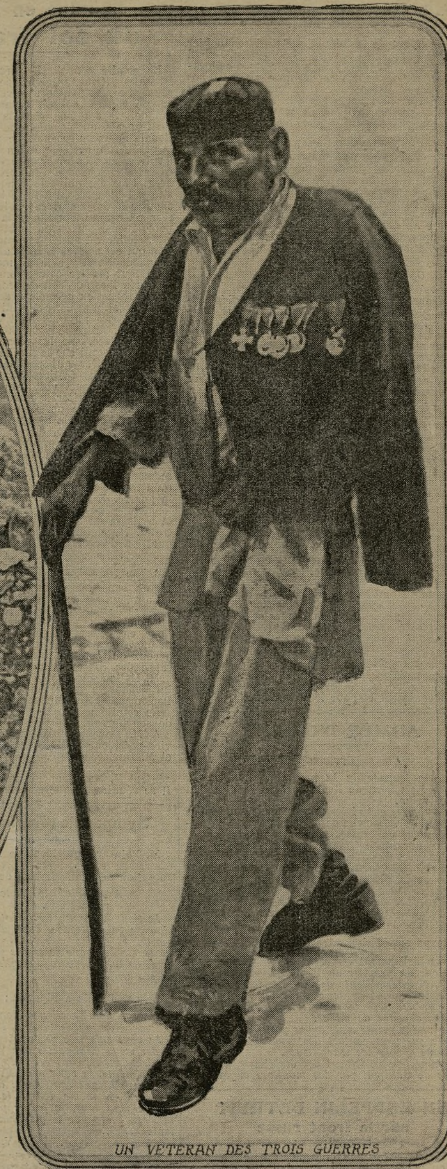
UN VÉTÉRAN DES TROIS GUERRES

Le drame balkanique entre dans l'une de ses périodes les plus aiguës. Les Serbes rétrogradent en combattant avec une ténacité qui émerveille leurs adversaires; les troupes alliées progressent, et chaque jour rapproche le moment où elles tendront au brave petit peuple la main fraternelle sur le commun champ de bataille. Dans le même temps, accrochés à leurs pics, opiniâtement