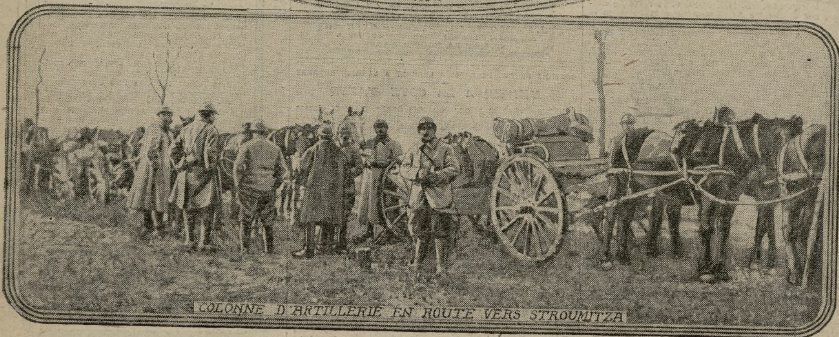
COLONNE D'ARTILLERIE EN ROUTE VERS STROUMITZA

Les débarquements de troupes alliées continuent à Salonique, et le général Sarrail, en même temps qu'il y organise le camp retranché, continue à tenir en échec les attaques violentes des Bulgares. La saison défavorable gêne plus encore nos ennemis que nous-mêmes, et nous avons ces armes qu'ils n'ont pas : la foi et la confiance.