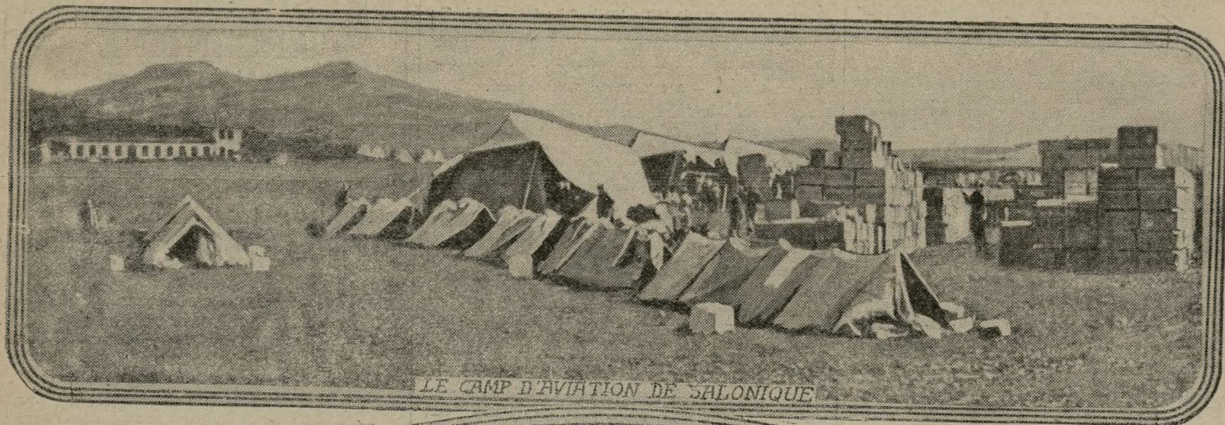
LE CAMP D'AVIATION DE SALONIQUE