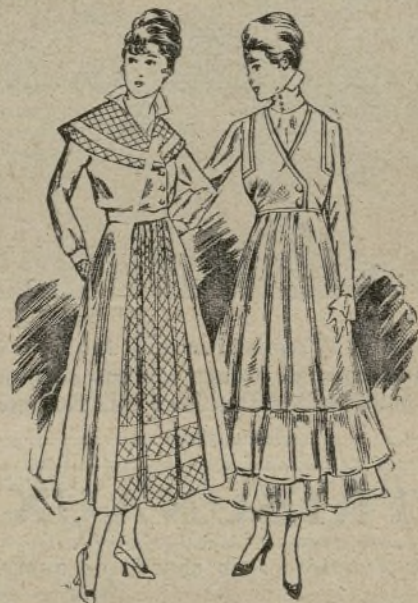
Robe de gabardine bleue et tissu quadrillé Robe de taffetas noir bordée de velours

Les modèles croqués ici appartiennent à ces genres. Le premier est une robe de gabardine bleue dont la jupe était primitivement étroite et droite comme on les a faites durant plusieurs saisons. En biaisant les coutures, en remontant la jupe qui sera plus courte et en ajoutant un tablier ou même deux tabliers, un devant et un derrière, si cela est nécessaire, en gabardine de fantaisie rayée ou quadrillée bleu et vert, bleu et rouge ou bleu et bois, on obtiendra une ampleur très raisonnable et très suffisante. Le corsage peut n'avoir pas besoin de beaucoup de transformations, mais un col pélerine et des poignets de tissu assorti au tablier font