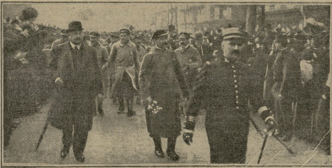
La foule massée sur les grands boulevards acclame les héros de l'Yser.