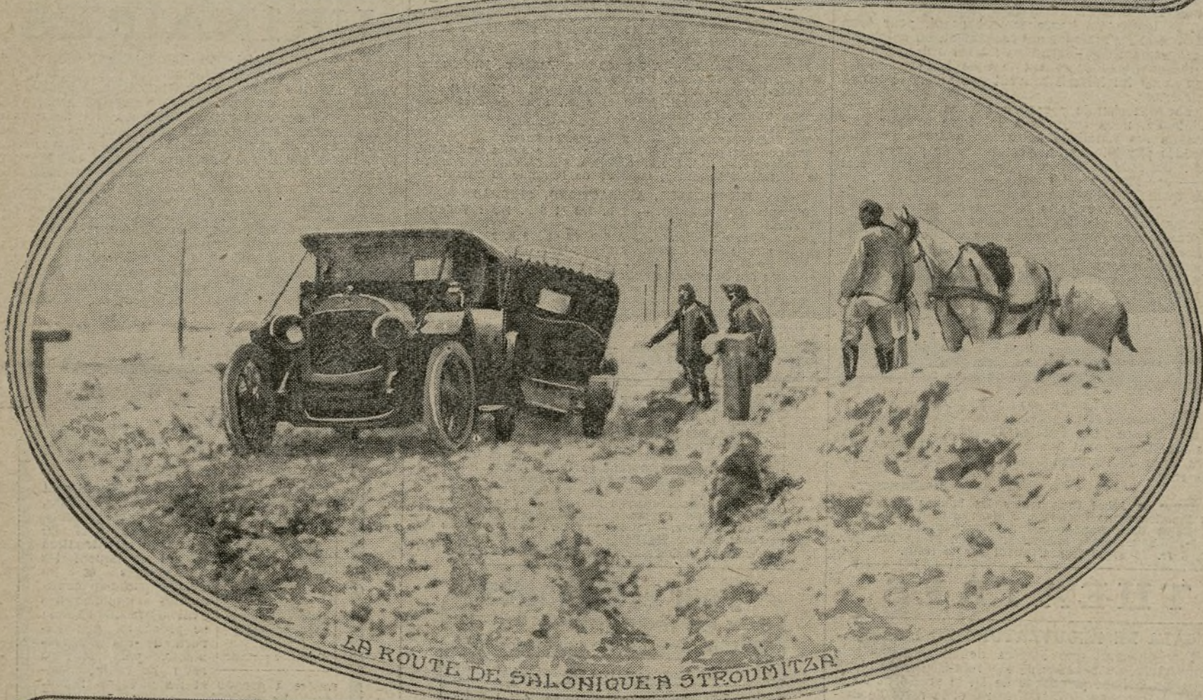
LA ROUTE DE SALONIQUE A STROUMITZA