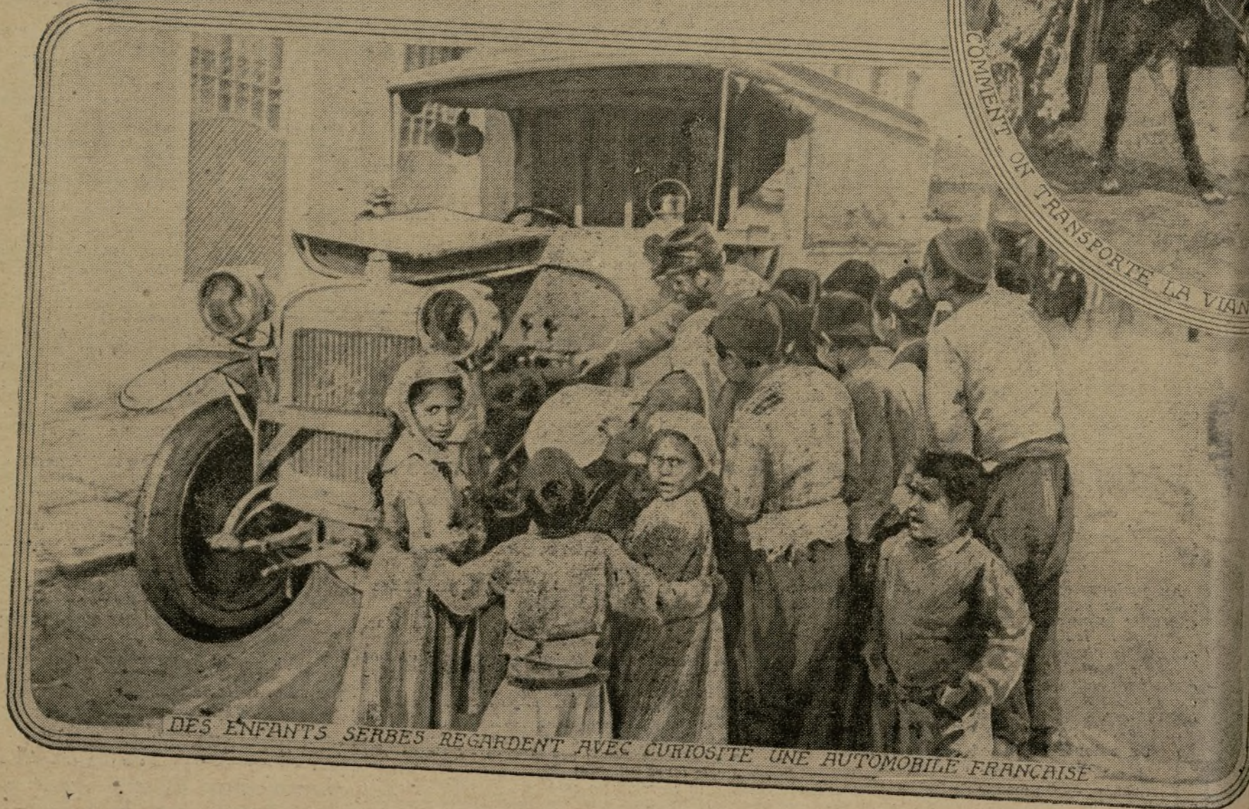
DES ENFANTS SERBES REGARDENT AVEC CURIOSITE UNE AUTOMOBILE FRANCAISE