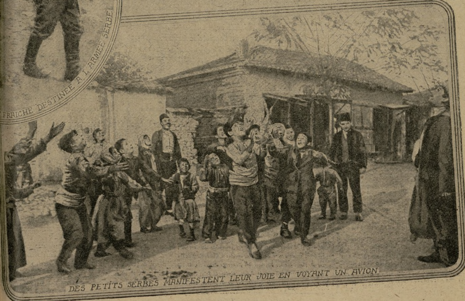
DES PETITS SERBES MANIFESTENT LEUR JOIE EN VOYANT UN AVION

L'arrivée des Français en Serbie a été pour nos héroïques alliés la cause d'un grand réconfort moral qui subsiste malgré les épreuves présentes. De même, les paysans ont trouvé dans la participation effective de nos troupes une suite de sujets