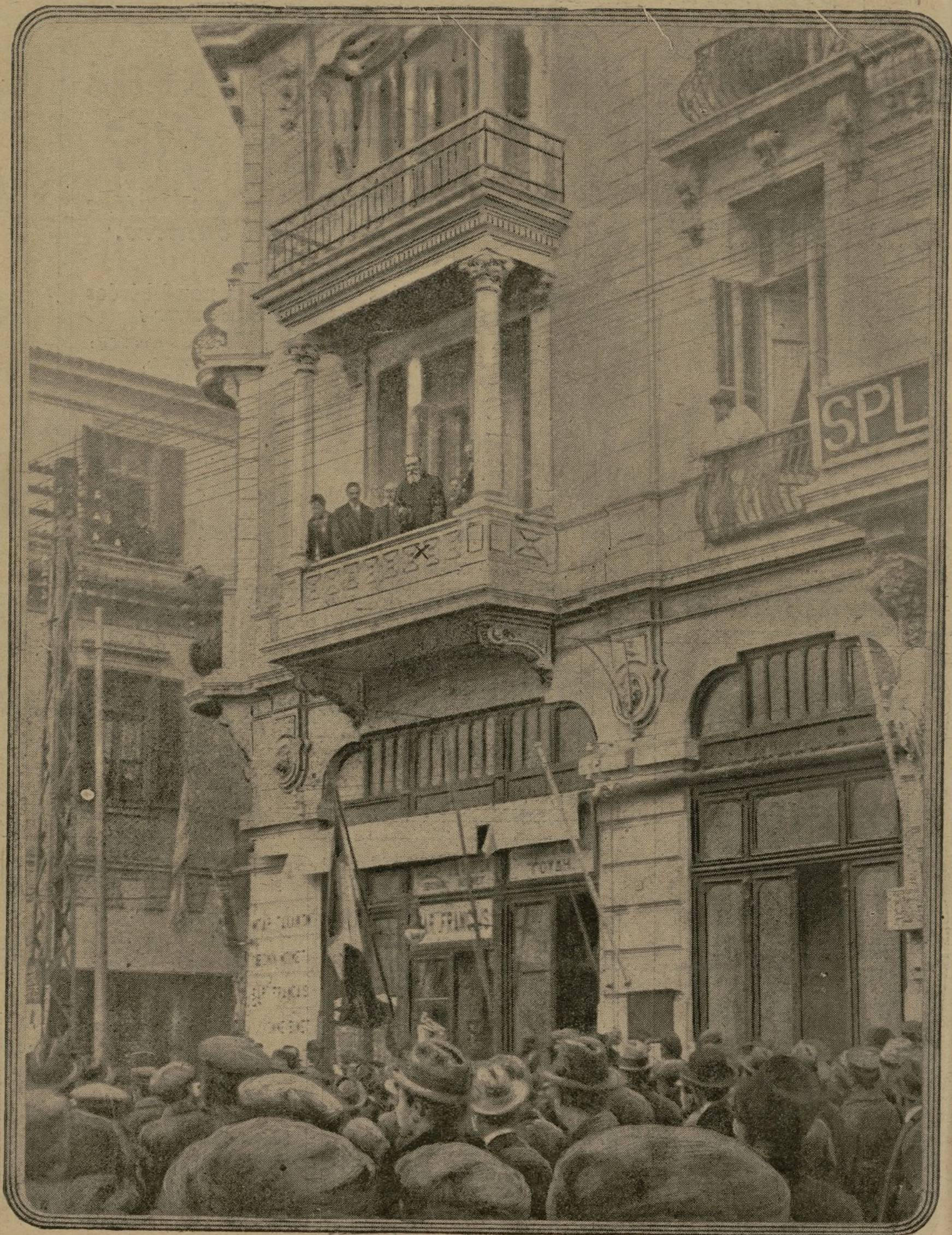
Au balcon de l'hôtel où il était descendu M. Denys Cochin (X) adresse ses remerciements aux citoyens grecs qui étaient venus acclamer en lui le porte-parole de la France. Cette manifestation, qui s'est renouvelée plusieurs fois, suffirait à prouver que le peuple hellénique, à l'encontre de son gouvernement, n'oublie pas le long passé d'amitié fraternelle qui unit sa patrie à la nôtre.