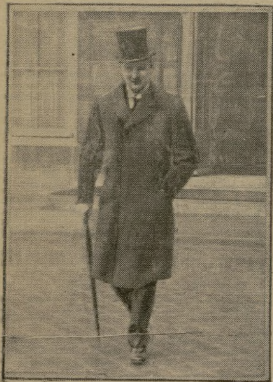
SIR EDWARD GREY à sa sortie du quai d'Orsay

Sir Edward Grey et lord Kitchener sont venus hier matin à Paris. Une conférence a eu lieu au ministère des Affaires étrangères à laquelle ils ont pris part, ainsi que le président