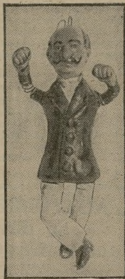
Le comte de Romanones Jouet acheté cet été à Saint-Sébastien par le comte lui-même.

Le comte de Romanones, chef du parti libéral, est officiellement chargé par le roi Alphonse XIII de former le cabinet espagnol. La démission du ministre conservateur de M. Dato n'a pas pour motif un échec parlementaire, puisqu'aucun vote n'est intervenu, mais, en fait, le maintien de ce ministère au pouvoir était très difficile parce que les projets militaires, économiques, administratifs étaient tous arrêtés et qu'un mécontentement général se faisait jour dans tous les groupes. Un ministère qui s'est tenu aux affaires pendant environ deux ans est, chez nos voisins, compromis par sa longévité même. Le plus souvent, en Espagne, les démissions ministérielles sont ainsi données sans que le Parlement soit appelé à se prononcer officiellement, par une sorte d'accord de couloirs.