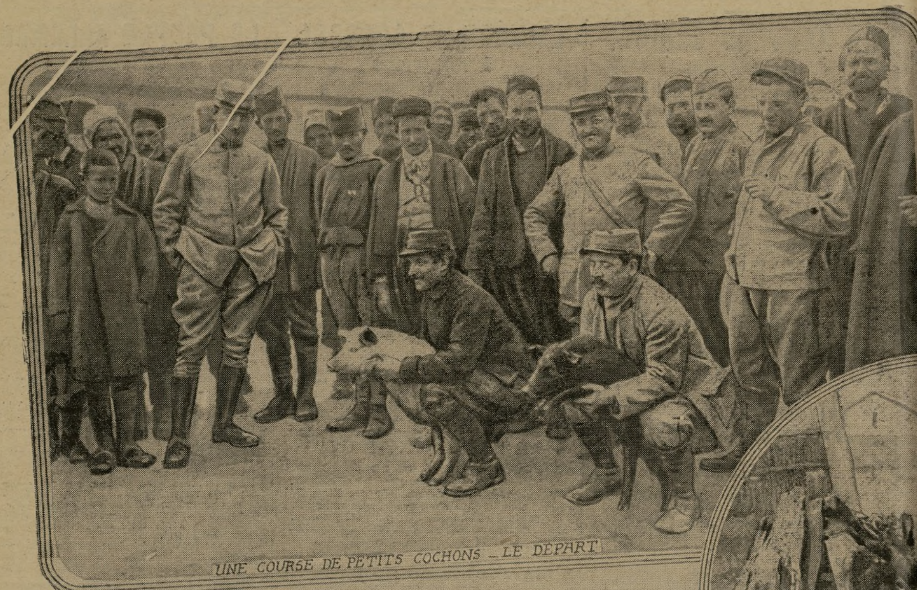
UNE COURSE DE PETITS COCHONS — LE DEPART