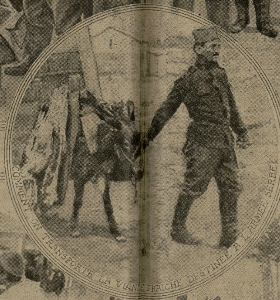
COMMENT ON TRANSPORTE LA VIANDE FRAICHE DESTINEE A L'ARMEE SERBE