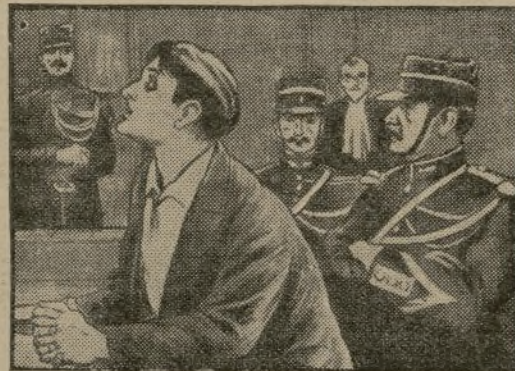
LA BREBIS PERDUE

Pendant toute la semaine écoulée l'immense salle de Tivoli-Cinéma était littéralement prise d'assaut en matinée et en soirée. Car tout Paris sait que l'on y trouve toujours un spectacle de choix copieux et intéressant. Cette semaine le programme incomparable comprend : la deuxième série des Mystères de New-York, la Brebis perdue, film d'art, drame de la vie moderne, de G. Trarieux; les Oiseaux vivent leur vie (exclusivité), deuxième sé-