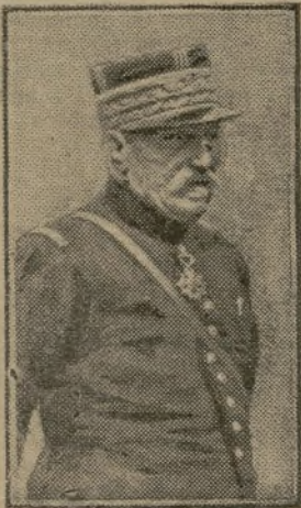
Genl DE CASTELNAU