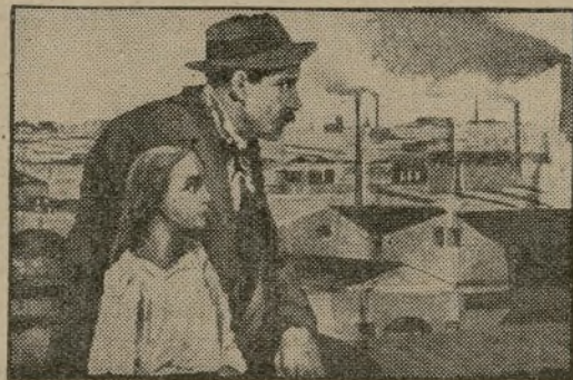
LES VICTOIRES DU CŒUR

La superbe salle du 24 du boulevard des Italiens a conquis — et garde — la première place parmi les Cinémas du Boulevard. Pour obtenir ce succès éclatant, il a suffi d'offrir au public, dans une salle extraordinairement originale, élégante et confortable, des films de premier ordre, des exclusivités sensationnelles, des vues documentaires d'un haut intérêt et un groupement d'actualités triées parmi toutes les éditions. En un mot, des programmes d'une harmonie et d'un intérêt comme on n'en voit nulle