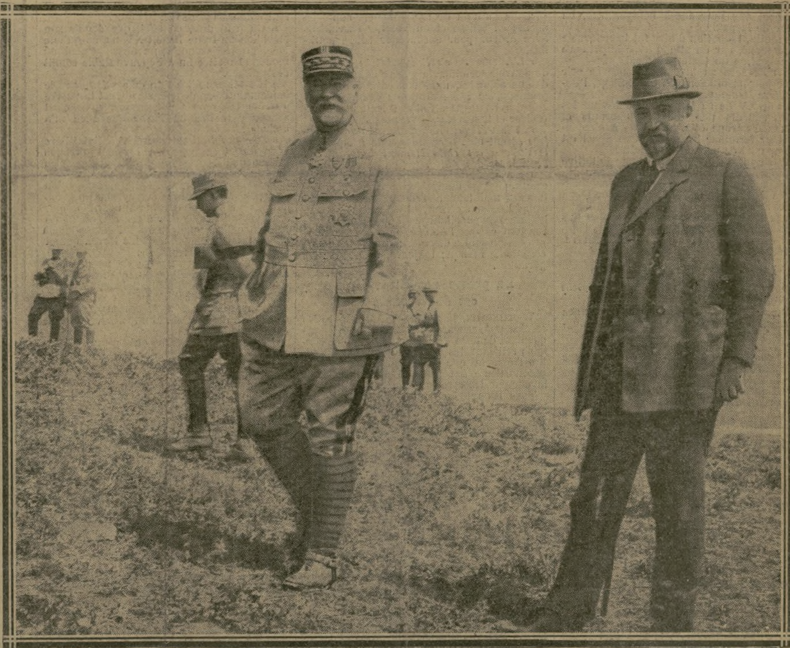
LE GÉNÉRAL BERTHELOT ET M. BRATIANO, PRÉSIDENT DU CONSEIL