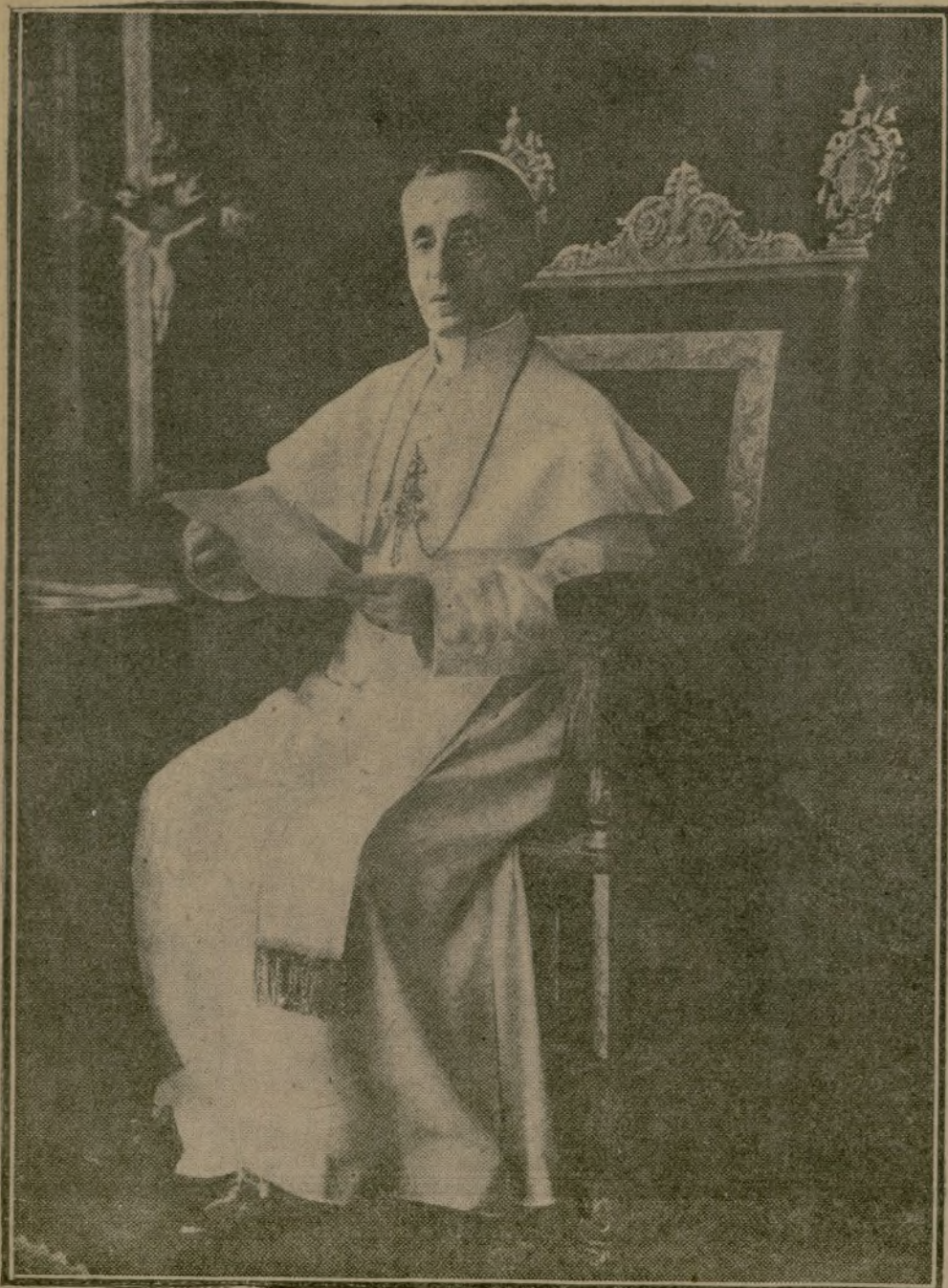
S. S. BENOIT XV