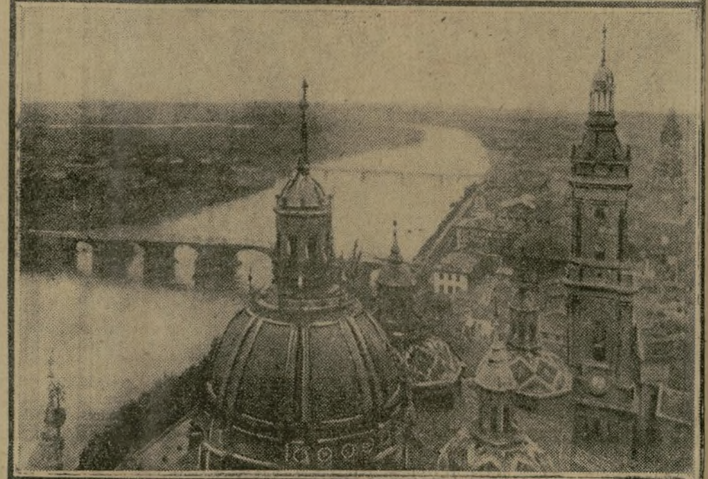
EN HAUT : BARCELONE. — LES TRAMWAYS DANS LA RAMBLA DE CATALUNA EN BAS : SARAGOSSE. — L'EBRE ET LA CATHÉDRALE D'EL PILAR

MADRID, 15 août. — Il semble que la situation continue à s'aggraver en Espagne, bien que les nouvelles officielles soient plutôt optimistes. Les dépêches reçues de province indiquent, en effet, que l'agitation est des plus vives et que de graves troubles se produisent un peu partout, particulièrement à Saragosse et à Burgos.