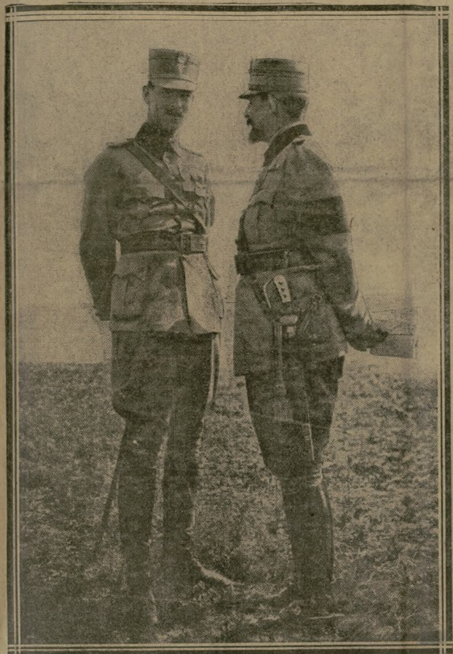
LE ROI ET LE PRINCE CAROL