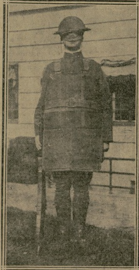
SOLDAT AMÉRICAIN REVÊTU DE L'ARMURE

Le département américain de la Guerre étudie en ce moment un modèle d'armure dont voici la photographie. Cette armure est