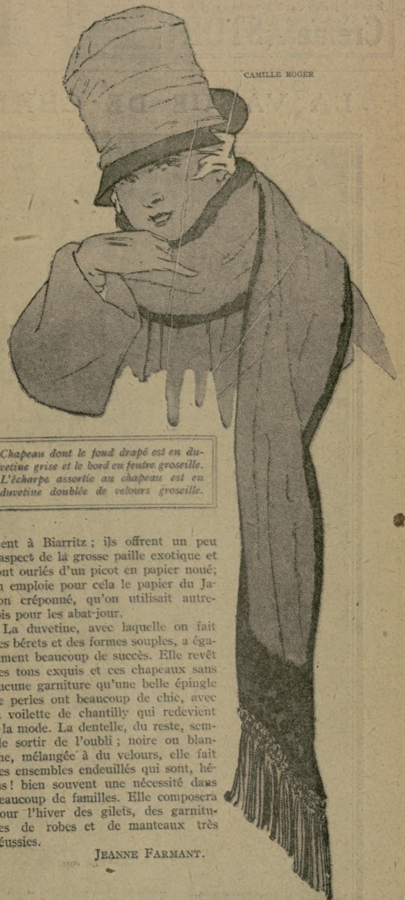
Chapeau dont le fond drapé est en duvetine grise et le bord en feutre groseille. L'écharpe assortie au chapeau est en duvetine doublée de velours groseille.

ment à Biarritz; ils offrent un peu l'aspect de la grosse paille exotique et sont ourlés d'un picot en papier noué; on emploie pour cela le papier du Japon créponné, qu'on utilisait autrefois pour les abat-jour. La duvetine, avec laquelle on fait des bérêts et des formes souples, a également beaucoup de succès. Elle revêt des tons exquis et ces chapeaux sans aucune garniture qu'une belle épingle de perles ont beaucoup de chic, avec la voilette de chantilly qui redevient à la mode. La dentelle, du reste, semble sortir de l'oubli; noire ou blanche, mélangée à du velours, elle fait des ensembles endeuillés qui sont, hélas! bien souvent une nécessité dans beaucoup de familles. Elle composera pour l'hiver des gilets, des garnitures de robes et de manteaux très réussies.