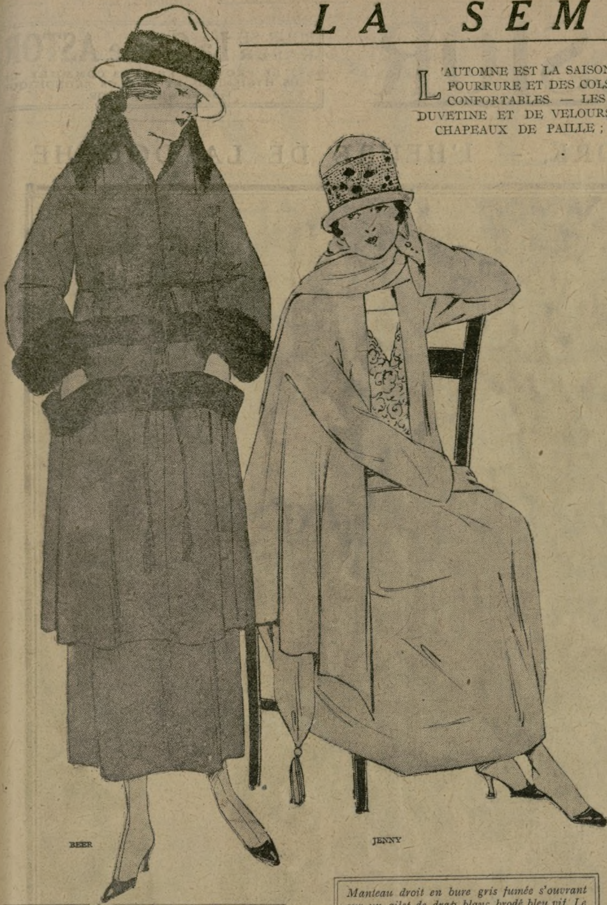
Manteau trois quarts en bure verte, cerclé de deux bandes de drap marron foncé couvertes de grosses piqûres vertes. Col et parements de tonte. Cordelière de laine verte servant le manteau à la taille.

L'AUTOMNE EST LA SAISON DES MANTEAUX; DES GARNITURES DE POURRURE ET DES COLS ÉCHARPÉS LES RENDENT PRATIQUES ET CONFORTABLES. — LES CHAPEAUX DE PAPIER, DE DRAP, DE DUVETINE ET DE VELOURS ONT COMPLÈTEMENT REMPLACÉ LES CHAPEAUX DE PAILLE; ILS SONT PETITS ET ASSEZ HAUTS.