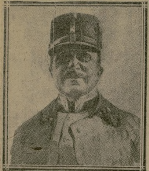
GÉNÉRAL VON ARZ

ROME, 30 août. — On annonce de source autrichienne que le général Arz, chef de l'état-major autrichien, est considéré com-