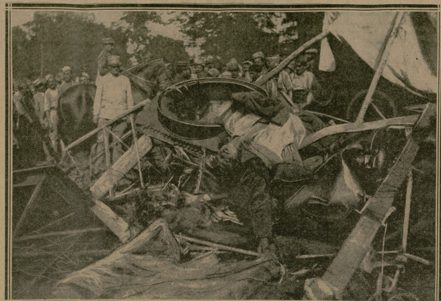
L'AVION ALLEMAND ABATTU, À PLUS DE 5.000 MÈTRES D'ALTITUDE, PAR LE POSTE N° 48

Le gérant : VICTOR LAUVIGNAT. Imprimerie, 19, rue Cadet, Paris. — Volmard.