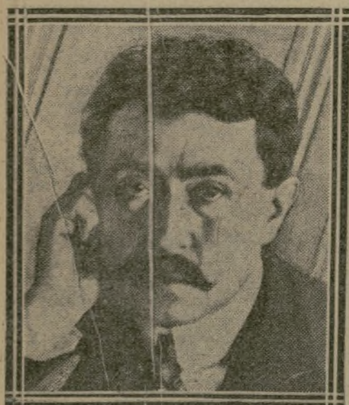
M. PAUL PAINLEVÉ

M. Painlevé réserva tout d'abord sa réponse définitive. Dans la soirée, il retour-