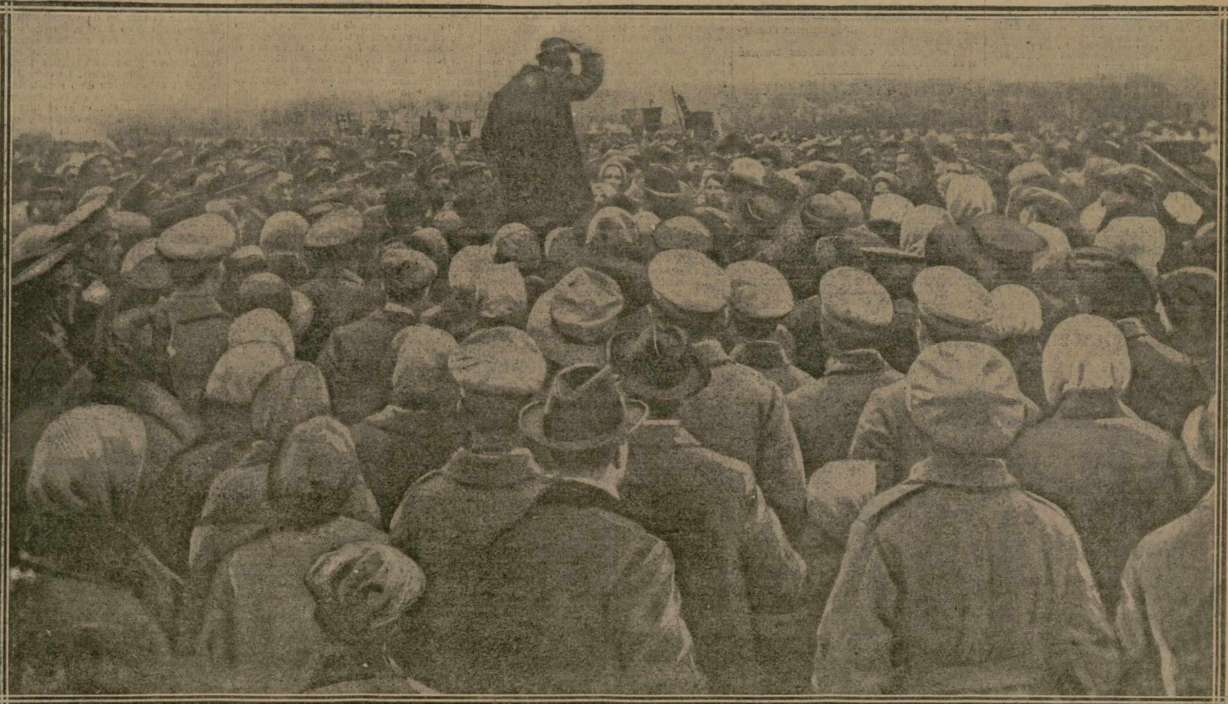
DANS UNE PRAIRIE, AUX ENVIRONS DE LA CAPITALE, TROTSKY PARLE DEVANT UN AUDITOIRE INNOMBRABLE

Les étoiles de Lenine et de Trotsky semblent avoir bien pâli depuis que les deux grands chefs du parti maximaliste réussirent à faire tomber le gouvernement provisoire. Les négociations de Brest-Litowsk n'ont pas donné ce que le peuple russe en espérait et de toutes les parties du territoire arrivent des protestations contre la conception d'une paix