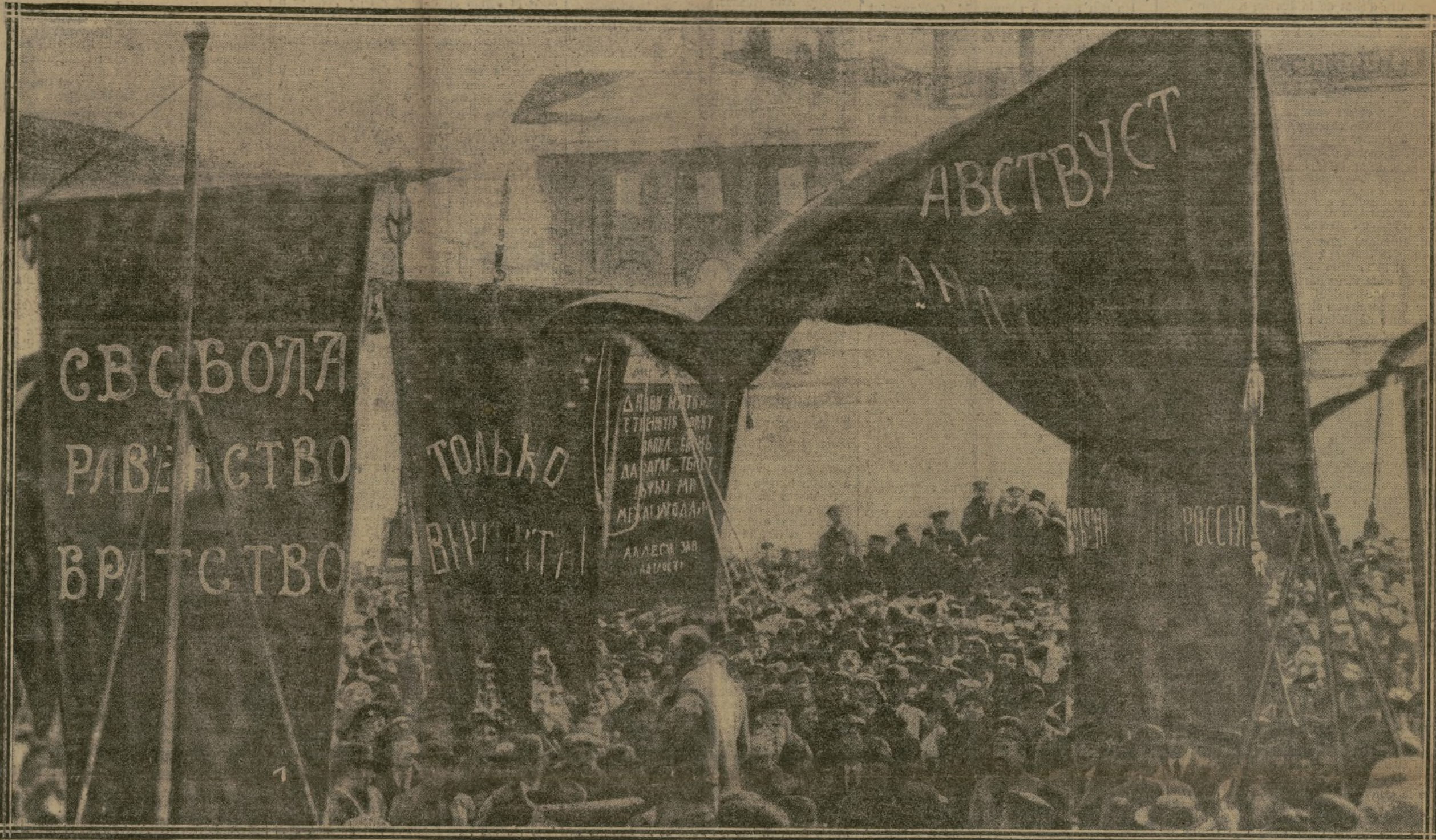
LENINE, TÊTE NUE ET DOMINANT LA FOULE, PRÊCHE LA PAIX A TOUT PRIX DANS UNE RUE DE PETROGRAD

Les premières photographies, arrivées à Paris, des chefs maximalistes à l'œuvre