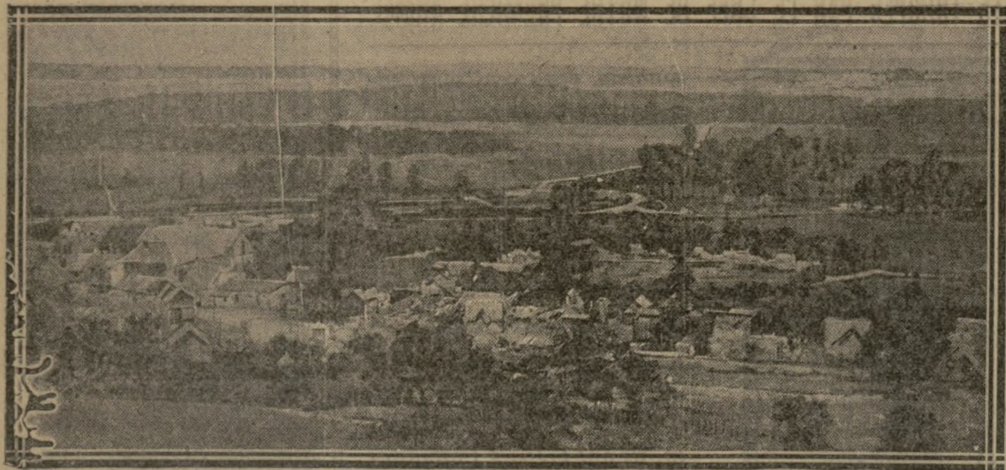
VUE DE GUNY, DONT NOS TROUPES ONT ATTEINT HIER LES ABORDS (Au fond, à droite, sur la colline, on aperçoit les ruines de Coucy-le-Château)

Communiqué français, 23 août (14 heures). — Au cours de la nuit, bombardements violents entre la région de Beuvraignes et l'Oise, notamment sur le Plémont, Passel et Chiry-Ourscamp. Nous tenons les rives sud de l'Oise et de l'Ailette, depuis Sempigny jusqu'à la voie ferrée de Coucy-le-Château. A l'est de Selens, nous avons porté nos lignes jusqu'aux abords de Guny et de Pont-Saint-Mard. Nuit calme partout ailleurs.