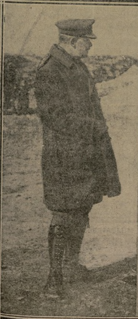
LE GÉNÉRAL BYNG

PAR LEURS PROPRES MOYENS, POUR GAGNER LE CHAMP DE BATAILLE