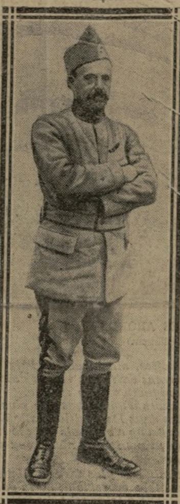
LE GÉNÉRAL DEBENEY

Seize divisions allemandes battues ont laissé entre nos mains plus de dix mille pri-