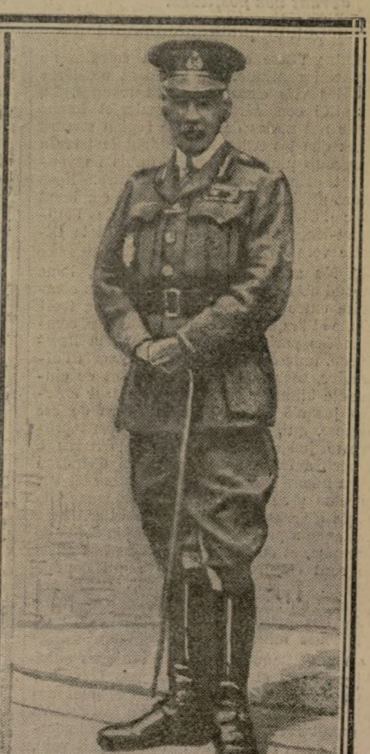
LE GÉNÉRAL RAWLINSON

SOLDATS ALLEMANDS SORTANT D'UNE CAVE POUR ÊTRE "CUEILLIS" PAR LES ANGLAIS