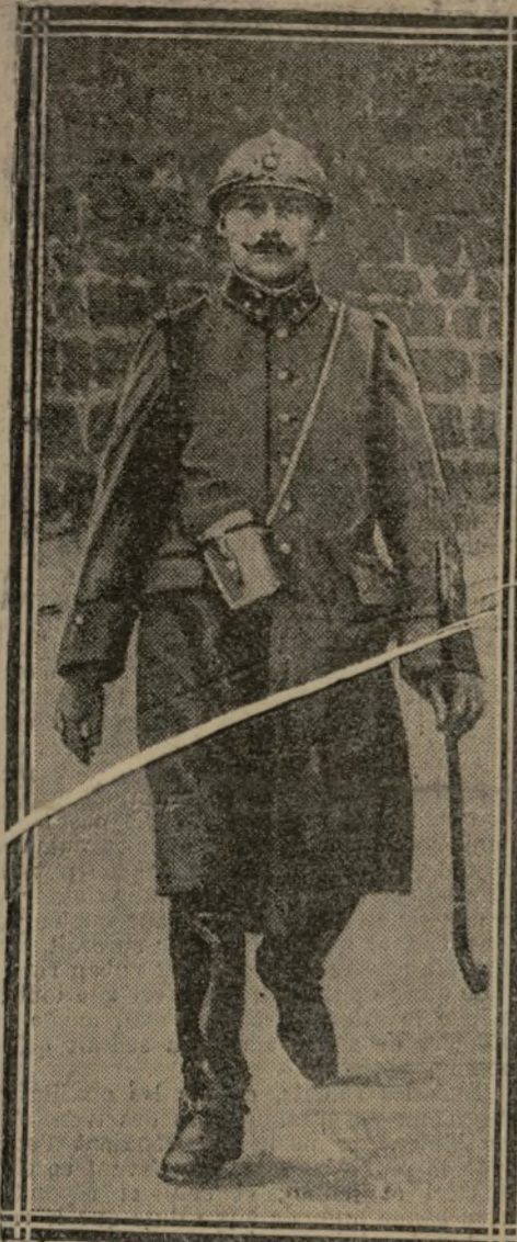
LE GÉNÉRAL HUMBERT

"LA BATAILLE EST GAGNÉE", DIT LE GÉNÉRAL DEBENEY