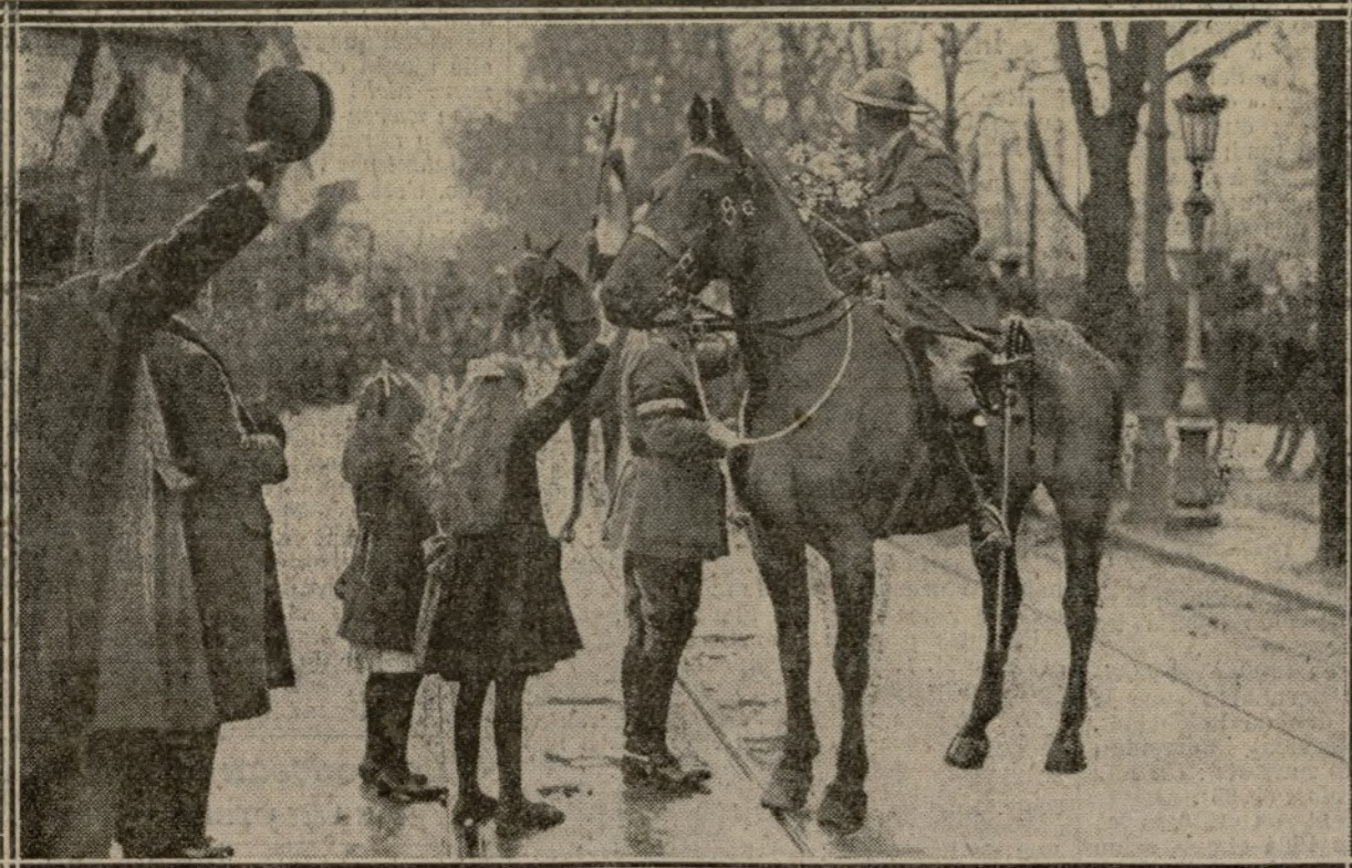
LE GÉNÉRAL BRITANNIQUE KAVENAGH REÇOIT UN BOUQUET EN ARRIVANT La physionomie que présente actuellement Spa, physionomie qu'a fixée, dans ses détails les plus typiques, l'opérateur d'“Excelsior”, est unique et singulièrement significative. Des Allemands y sont demeurés pour contrôler avec les Alliés l'exécution des clauses