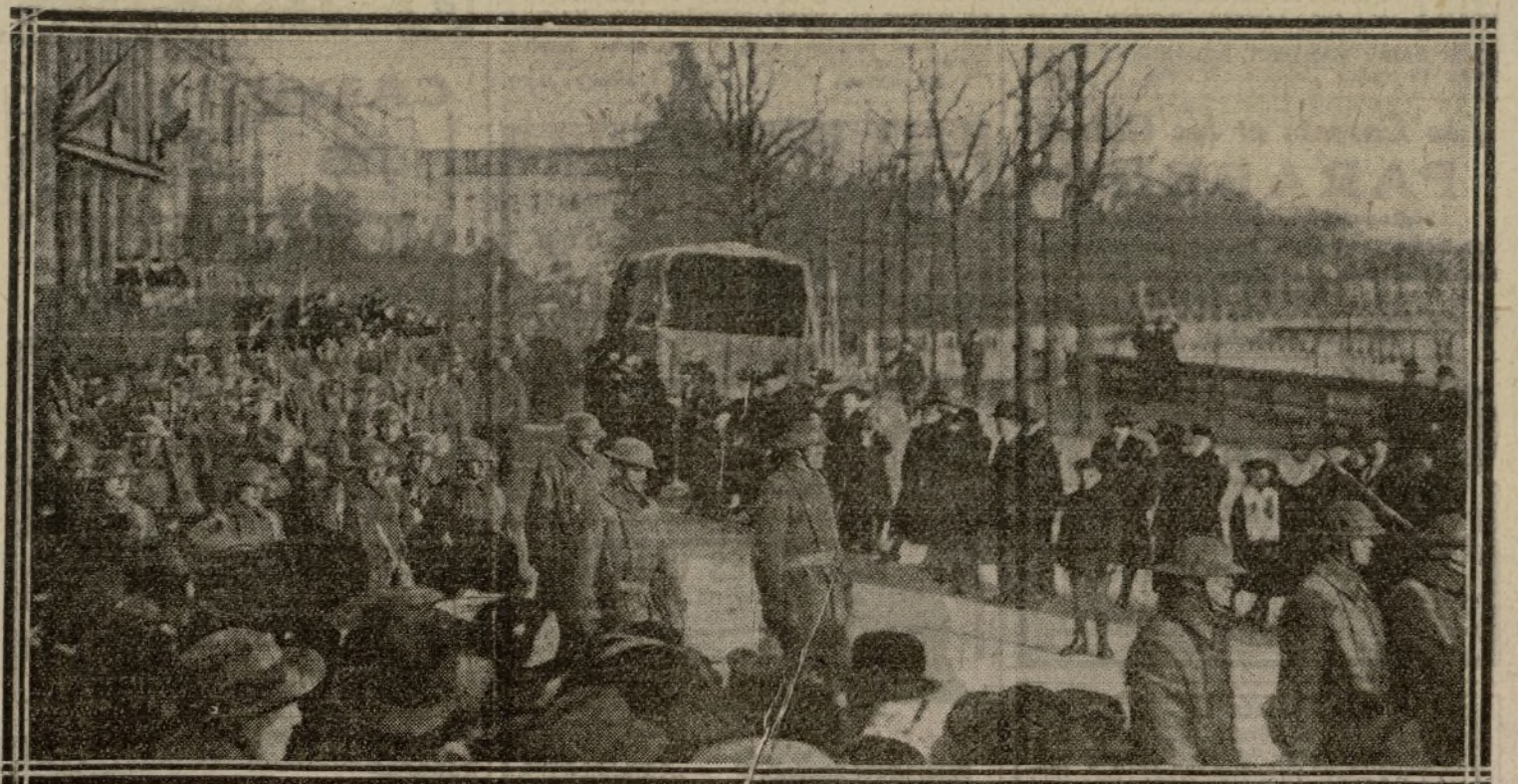
C'EST DANS UNE VILLE FAVOISÉE AUX COULEURS ALLIÉES QUE LES AMEX ONT FAIT LEUR ENTREE

Le 21 novembre, les contingents américains ont commencé à traverser la ville de Luxembourg, et, le 22, le général Pershing rendait visite à la grande-duchesse. Il a adressé une proclamation aux habitants, qui leur garantit la discipline de ses troupes.