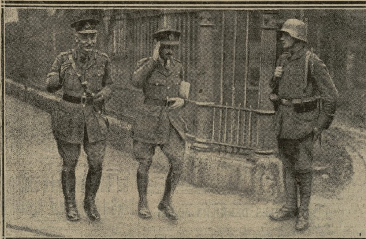
LE GÉNÉRAL SIR A. HEKINS SALUÉ PAR UNE SENTINELLE ALLEMANDE