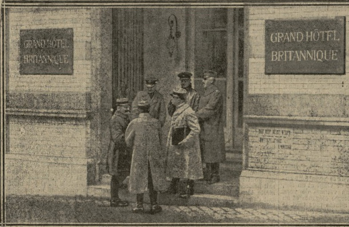
LES MEMBRES ALLIÉS DES SOUS-COMMISSIONS SORTANT DE L'EX-G. Q. G.