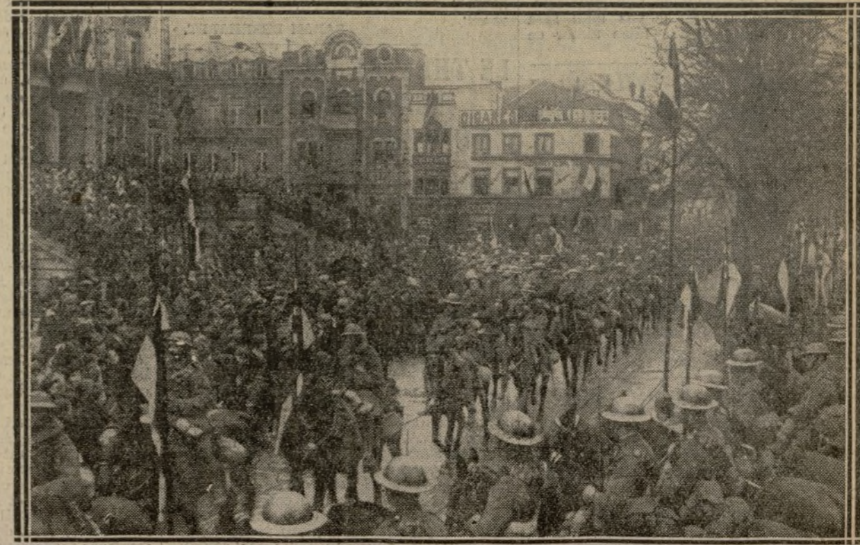
L'ENTRÉE TRIOMPHALE DE NOS ALLIÉS DANS LA GRANDE VILLE BELGE de l'armistice. Ce contrôle s'effectue au Grand Hôtel Britannique — qui a gardé son enseigne! — et qu'occupait, il y a quelques jours encore, le Grand Quartier Général allemand. Et, dans les rues, les soldats ennemis rendent les honneurs aux officiers alliés!...