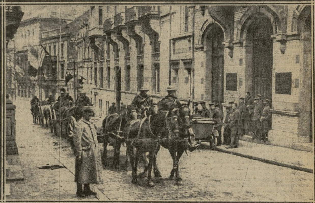
LES ALLEMANDS REGARDENT DÉFILER LES ANGLAIS QUI ENTRENT A SPA