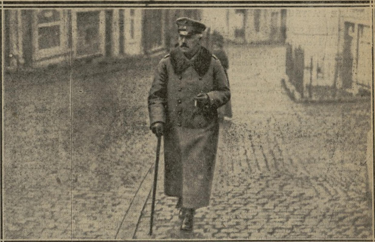
LE GÉNÉRAL VON WINTERFELD SE REND A LA COMMISSION D'ARMISTICE