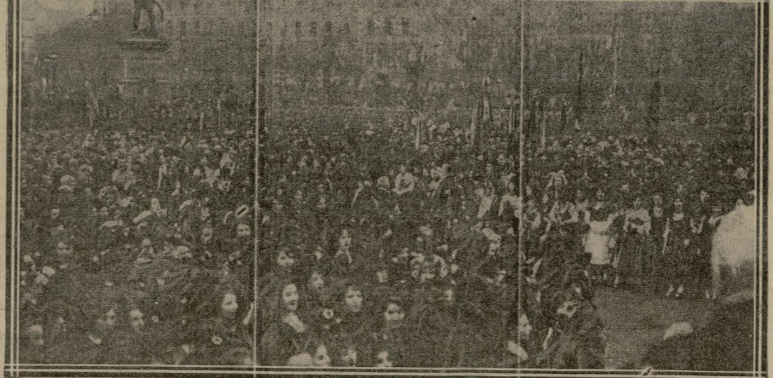
DES MILLIERS DE JEUNES ALSACIENNES CHANTENT: « VOUS N'AUREZ PAS L'ALSACE ET LA LORRAINE. »