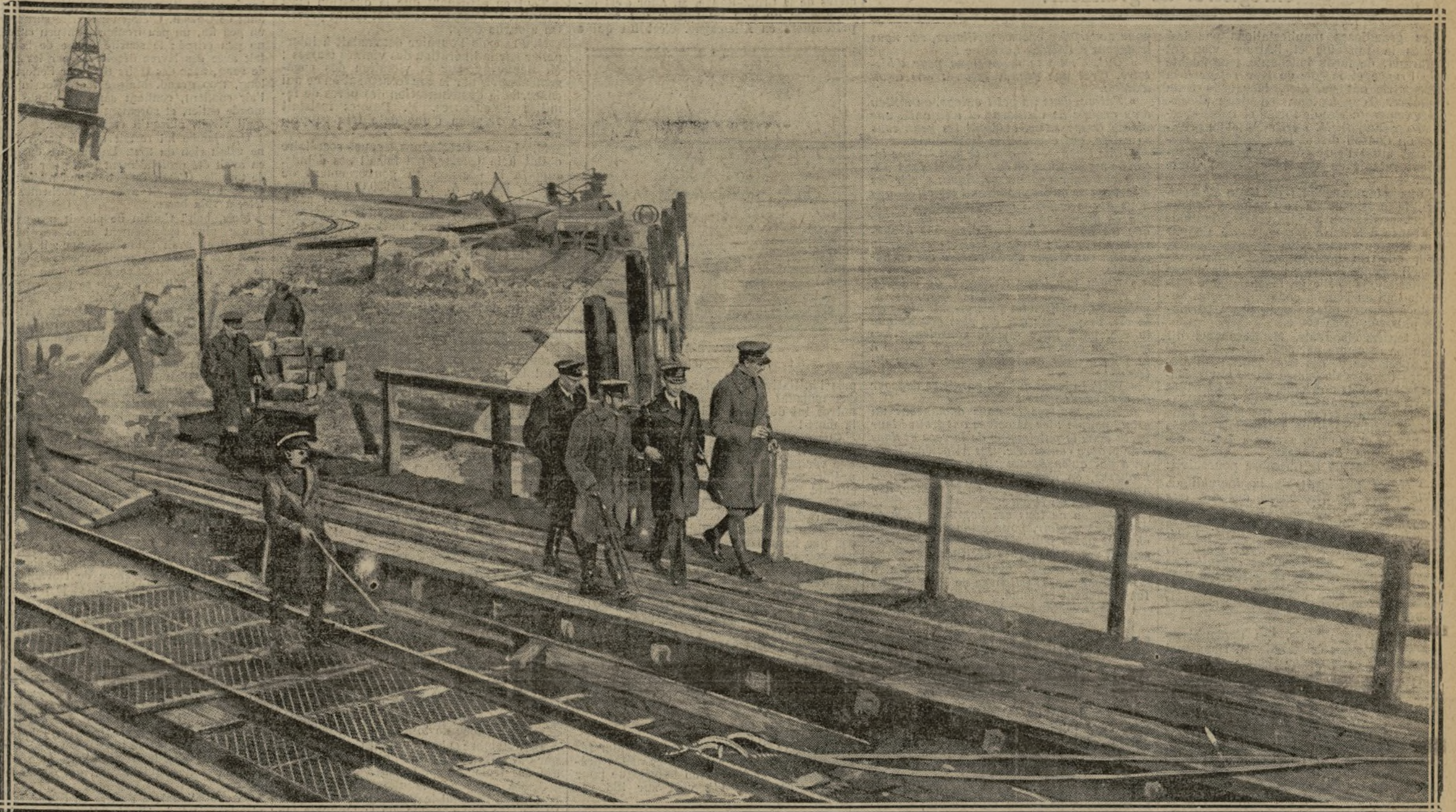
LES SOUVERAINS, ACCOMPAGNÉS PAR L'AMIRAL KEYES, VISITENT LE MOLE : AU FOND, LES DEUX BATIMENTS COULÉS