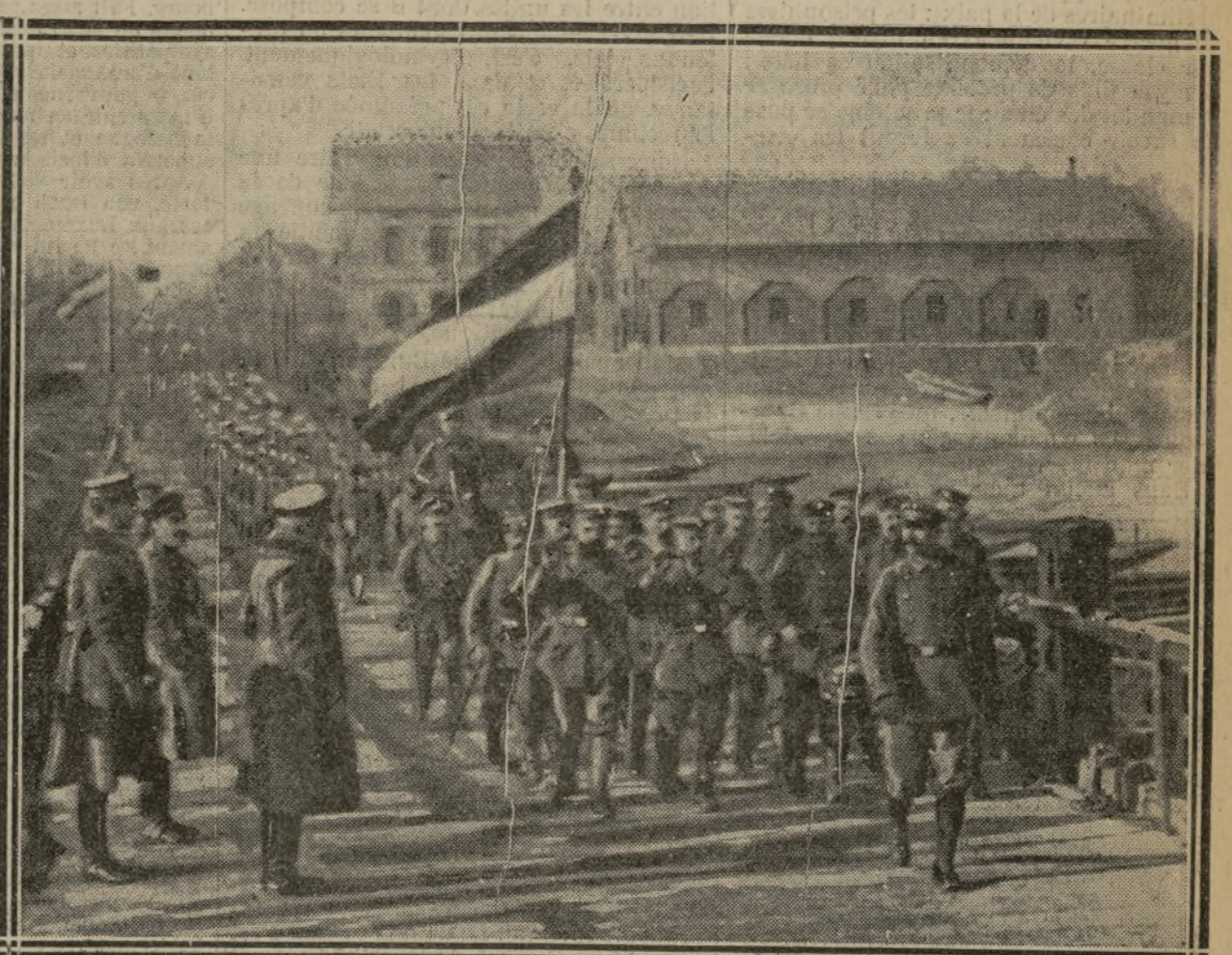
PASSAGE DU RHIN A ICHENHEIM, DANS LE DUCHÉ DE BADE