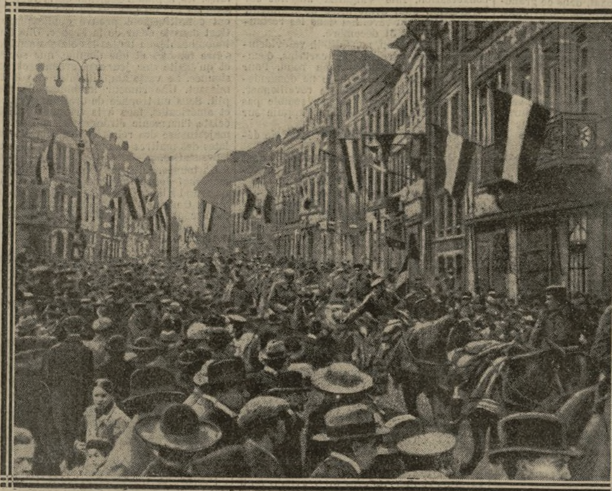
UN CONVOI D'ARTILLERIE TRAVERSE AIX-LA-CHAPELLE