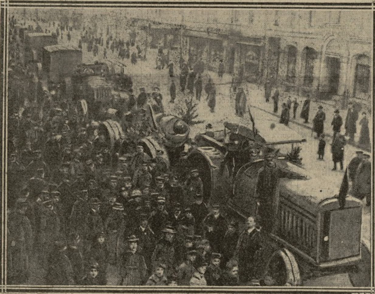
UNE BATTERIE DE GROS MORTIERS A KARLSRUHE