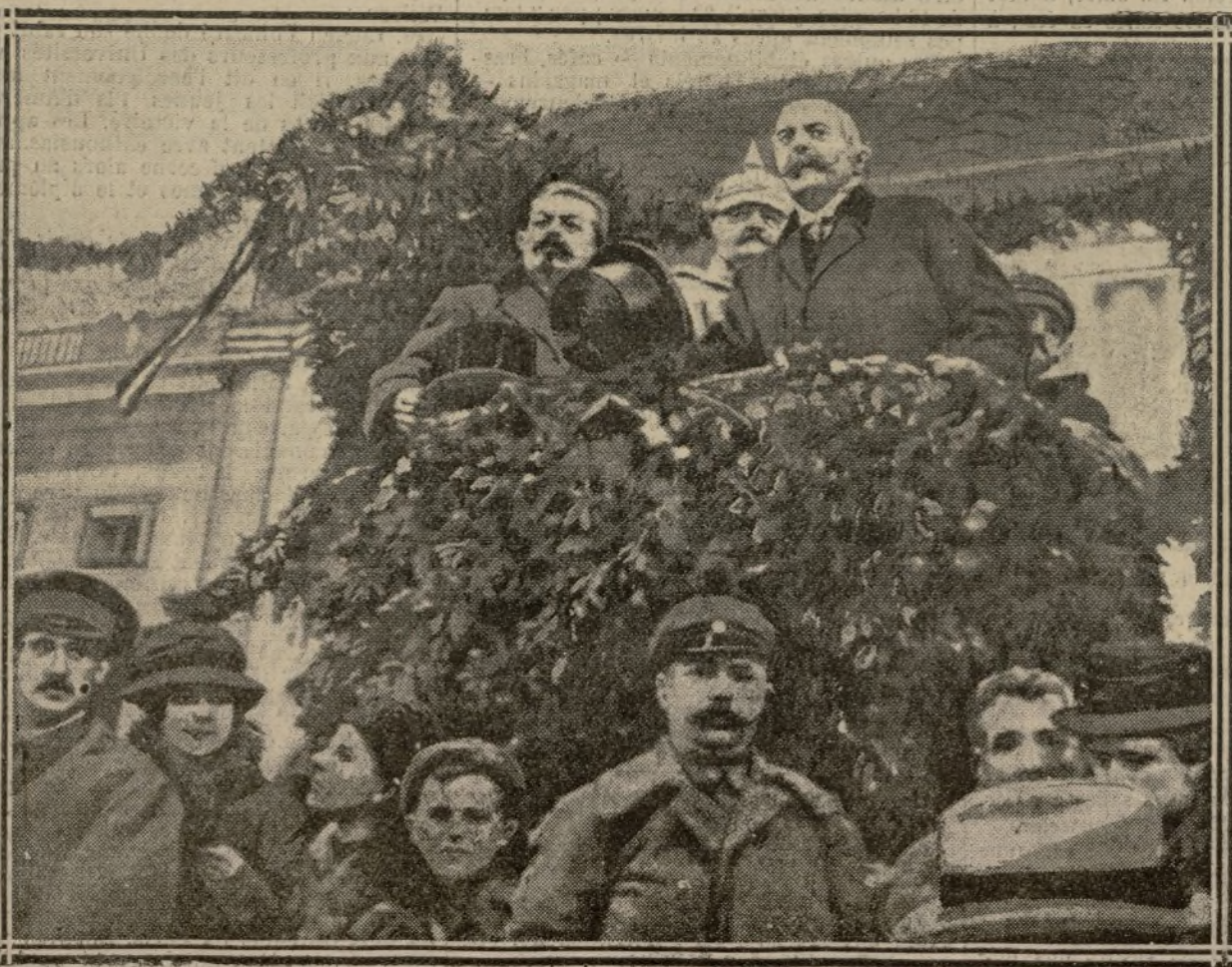
EBERT REGARDE PASSER LES TROUPES A BERLIN