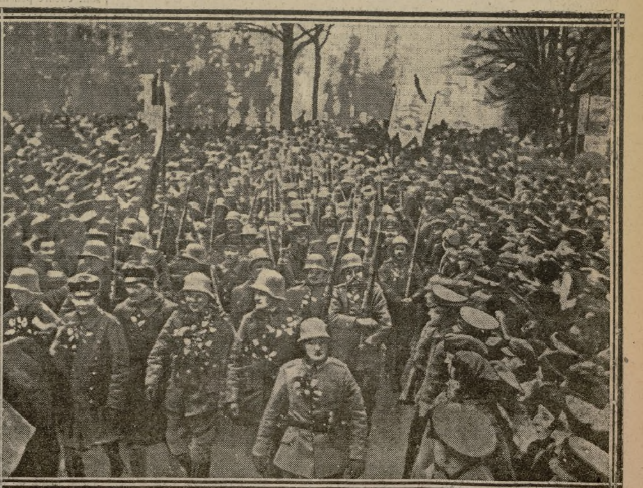
UN RÉGIMENT D'INFANTERIE FLEURI ET FÊTÉ A BERLIN

Quel accueil les Allemands auraient-ils réservé à leurs armées si elles étaient revenues auréolées par la victoire ? Ceux qui durent fuir l'épée dans les reins ont été reçus en triomphateurs. Ces photos ont été prises dans plusieurs villes, et même à Berlin. Il est