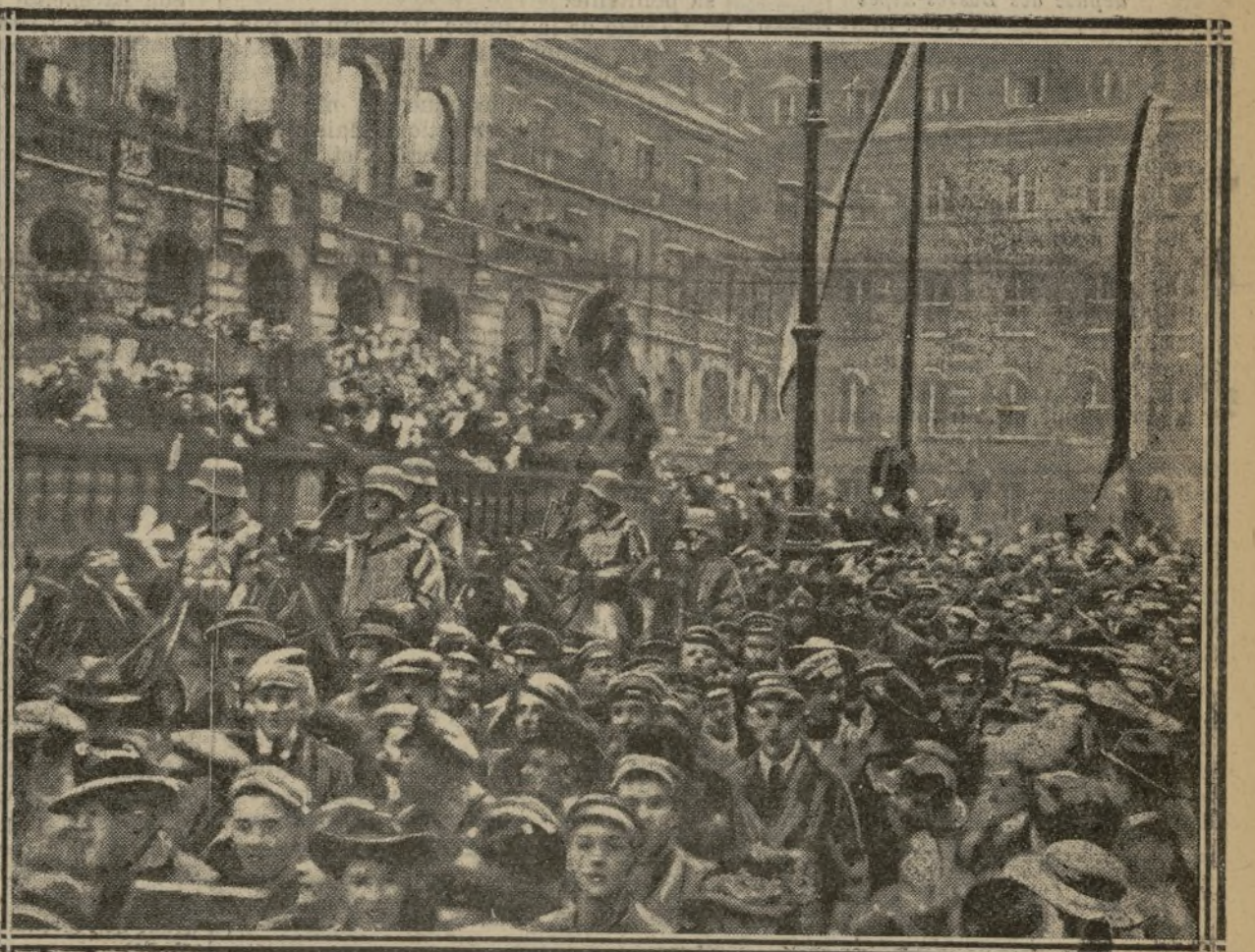
LES TROUPES SONT ACCLAMÉES A CASSEL