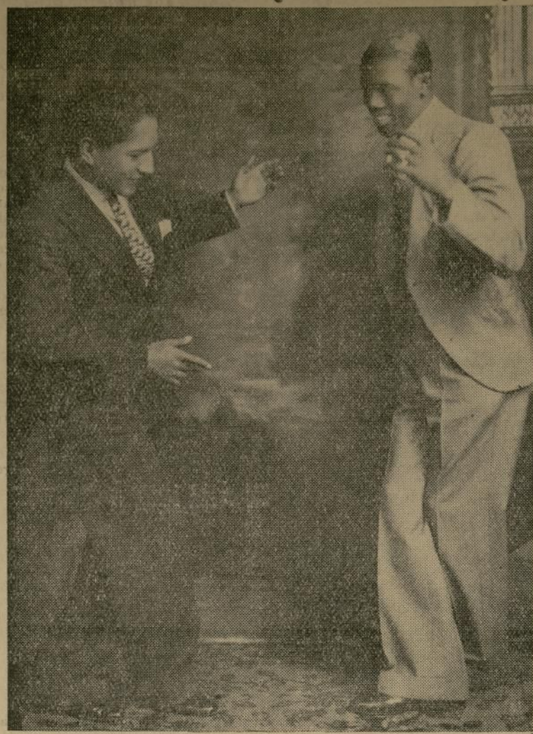
Ciro Rimac, el celebrado bailarín sudamericano, enseñando algunos pasos de tango al famoso campeón cubano Kid Chocolate. Al fin y al cabo el baile no es sino un ejercicio, ¿no es cierto?