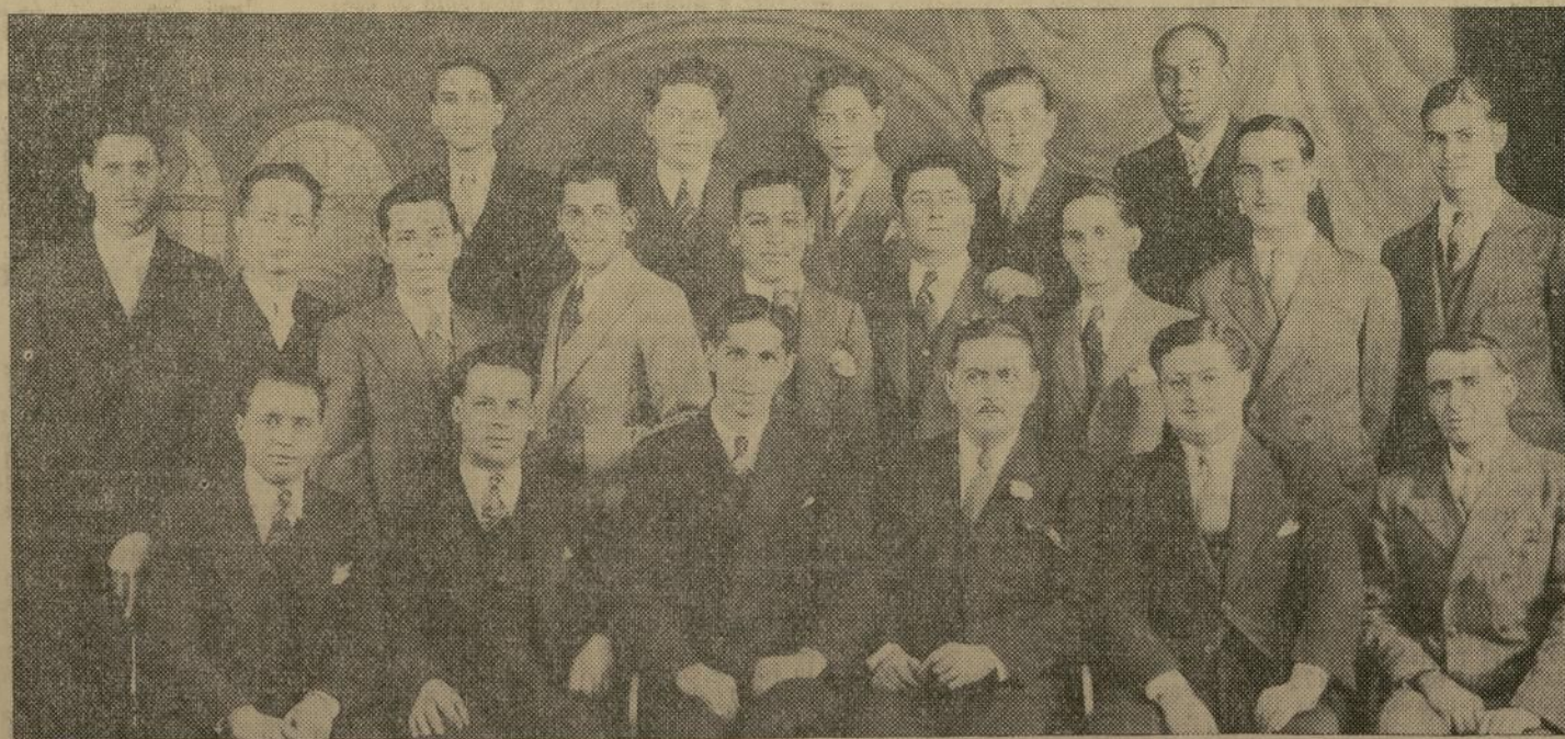
CUERPO DE EMPLEADOS DE LA CASA "CASTELLANOS-MOLINA."

¡Vea nuestros anuncios! ¡Compre ahora! ¡Visite nuestras Tiendas!