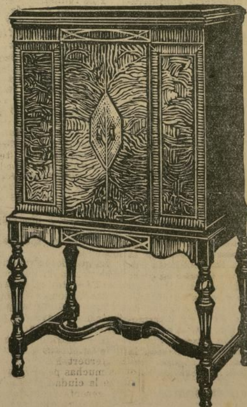
Modelo 31. Combinación Radio-Fonógrafo

Compre todos los adelantos de la ciencia hasta el día que complementan un aparato perfecto. Es además muy potente y permite recibir música, cantos, etc., de estaciones distantes y con extraordinaria claridad.