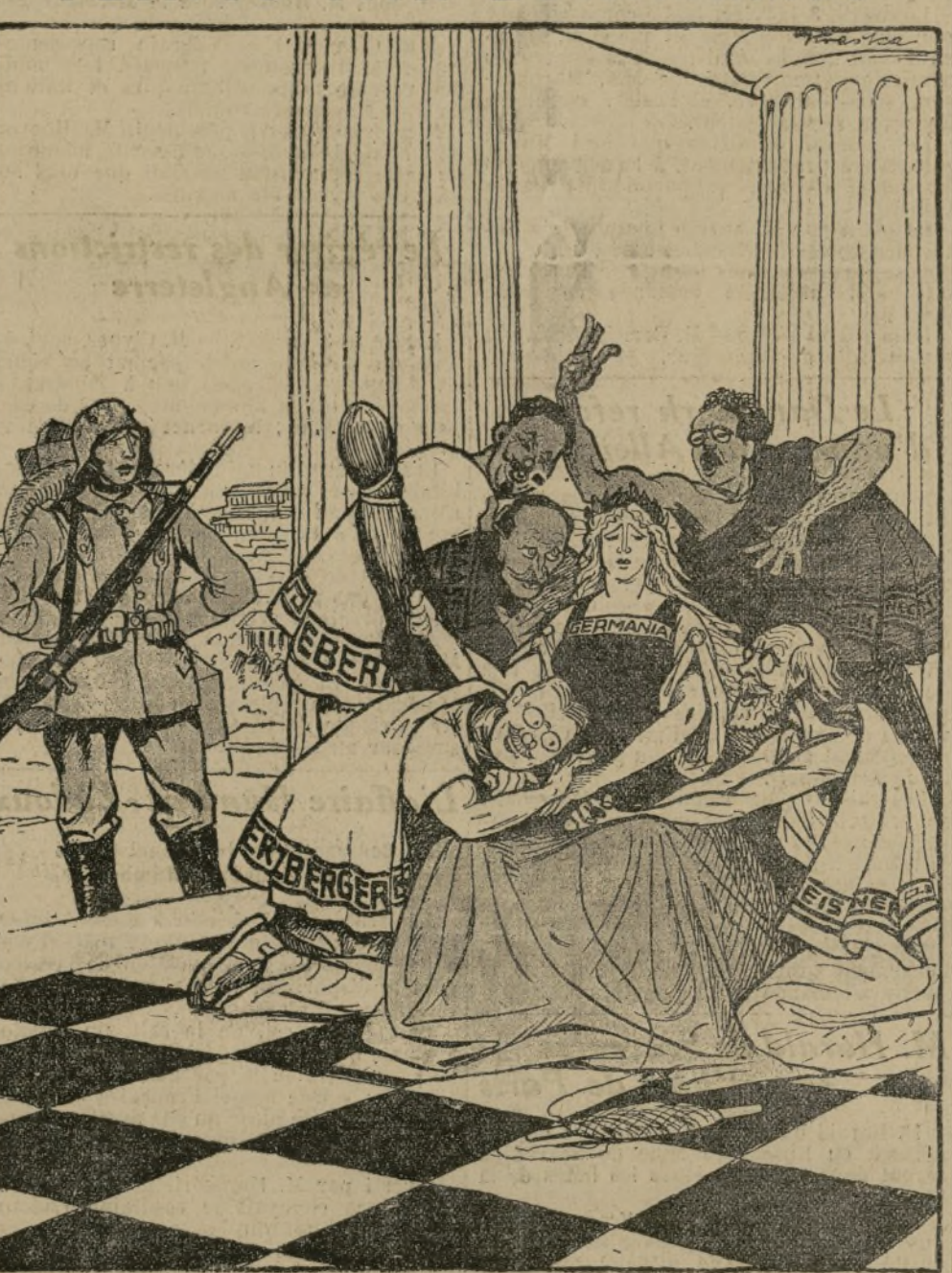
LE RETOUR D'ULYSSE

Ce dessin, du « Kladderadatsch », de Berlin, nous montre, réunis — de gauche à droite — autour de Pénélope-Germania : Erzberger, Ebert, Haase, Liebknecht et Kurt Eisner.