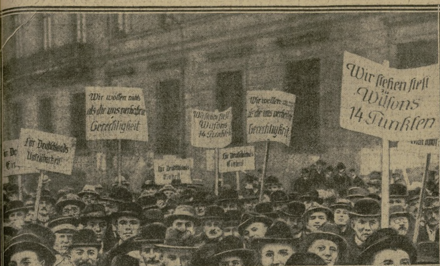
PANCARTES DE PROTESTATION PROMENÉES A BERLIN