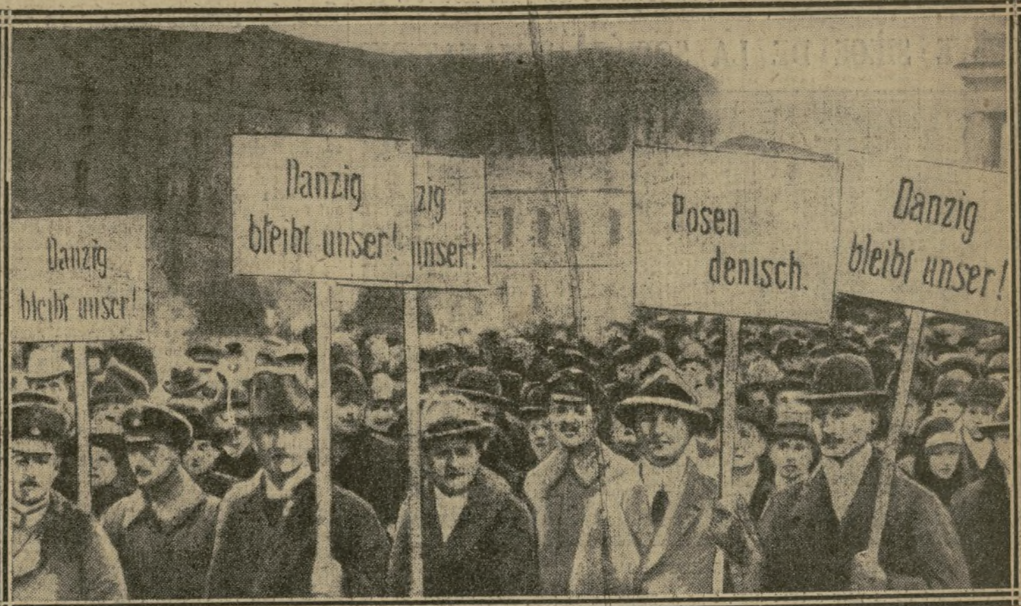
AUTRES PANCARTES RÉCLAMANT POSEN ET DANTZIG