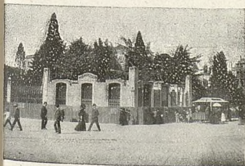
DERRIBO DEL PABELLÓN DEL MINISTERIO DE LA GUERRA