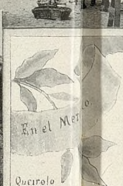
En el Mercado.