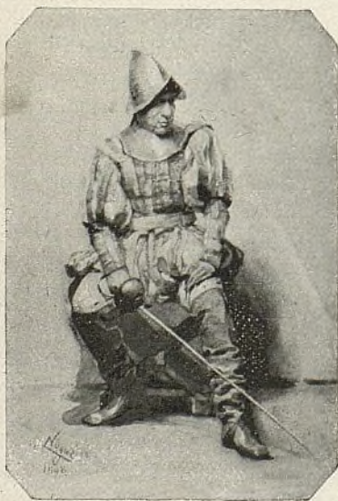
DESCANSO DESPUÉS DEL ASALTO Cuadro del Sr. Nogué,