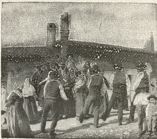
BAILE EN EL PUERTO