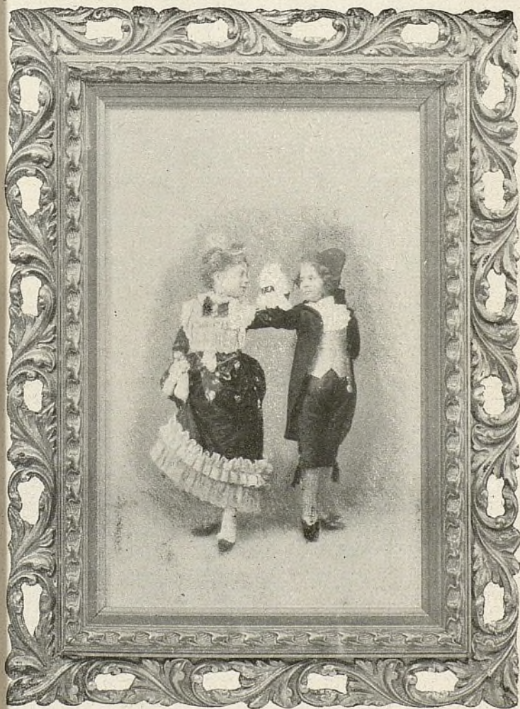
BAILE DE TRAJES—NIÑAS CARMEN Y LUISA PARDO Inst. de Huerta (Madrid).

La señorita Carmen Cobeña es una actriz distinguidísima, que honra la escena española. Recientes están los laureles que ha conquistado en las tablas de la Comedia, unas veces, demostrando lo profundo de sus dotes artísticos en La Muralla , otras, luciendo sus eminentes cualidades como en el engendro fantástico de Zorri-lla . Es tan conocida y admirada, que estas circunstancias nos vedan extendernos más al ocuparnos de una artista, candidata indiscutible para elevarse á estrella de primera magnitud en la escena patria.