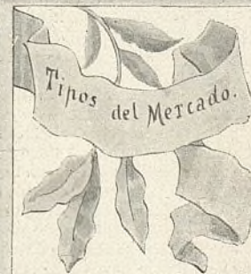
Tipos del Mercado.

R. G. H.—Granada—De lo que nos envía usted, publicamos lo siguiente: