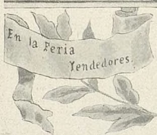
En la Feria