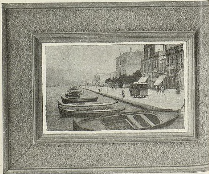
EL PUERTO DE SMYRNA (TURQUÍA)