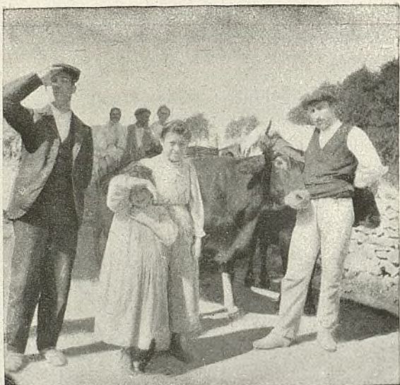
ESCENAS DEL CAMPO, BIARRITZ (FRANCIA)