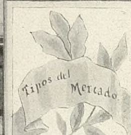
Tipos del Mercado