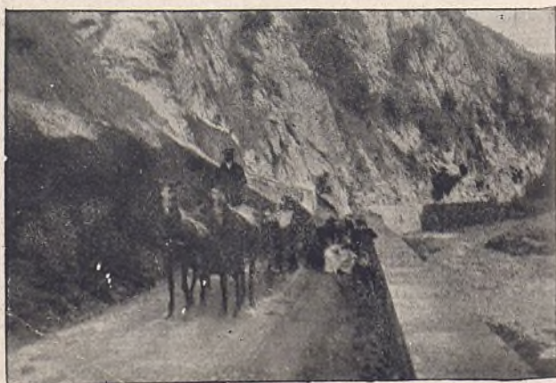
66.—Peñas de Cosanga (Asturias).

Anuncios españoles á una peseta línea, extranjeros á 1,50 francos.