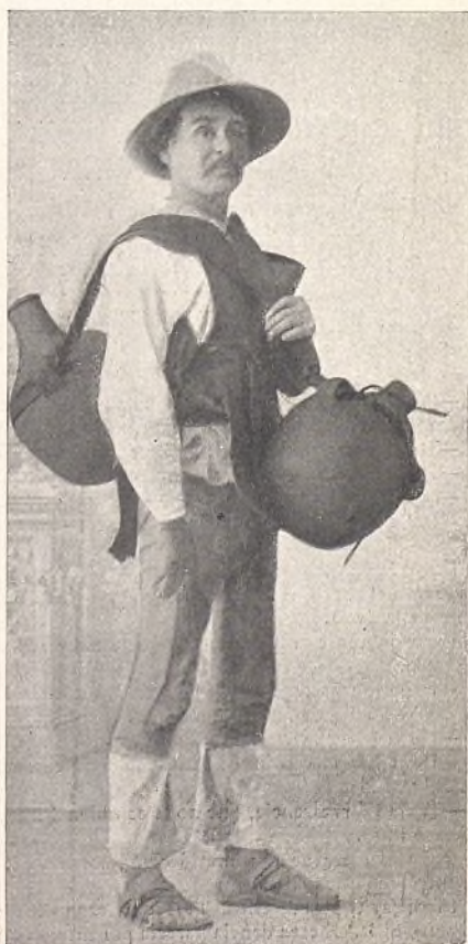
67.—Vendedor de agua (México).