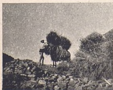
73.—Sierra de Cameros.