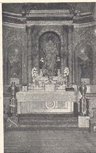
72.—Altar de nuestra Señora de la Blanca (Vitoria).