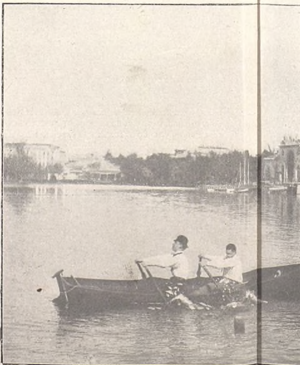
Ayuntamiento de Madrid. 71.—Estanque del Retiro (Madrid). Los estatutos del Retiro, más que por las Partidas y las Leyes

El rey, al ver á Rosario y oír lo que le decía, palideció. Un señorón, vestido con un uniforme extraordinariamente recargado de cordones de oro, dió un empujón á