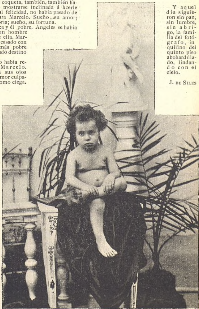
110.—RETRATO ARTÍSTICO DE NIÑO Inst. de los Sres. Méndez y Cao. (Preciados, 29, Madrid. Ayuntamiento de Madrid)