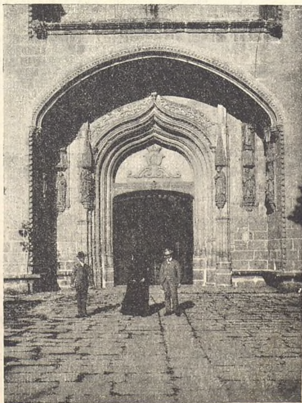
107.—SANTO TOMÁS (ÁVILA)

Inst. de D. J. Balenchana Ayuntamiento de Madrid