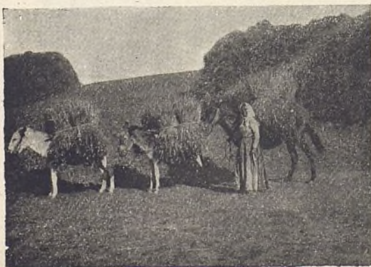
106.—ESCENAS DEL CAMPO