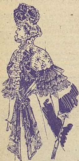
ABRIGO ELEGANTE DE ESTIO