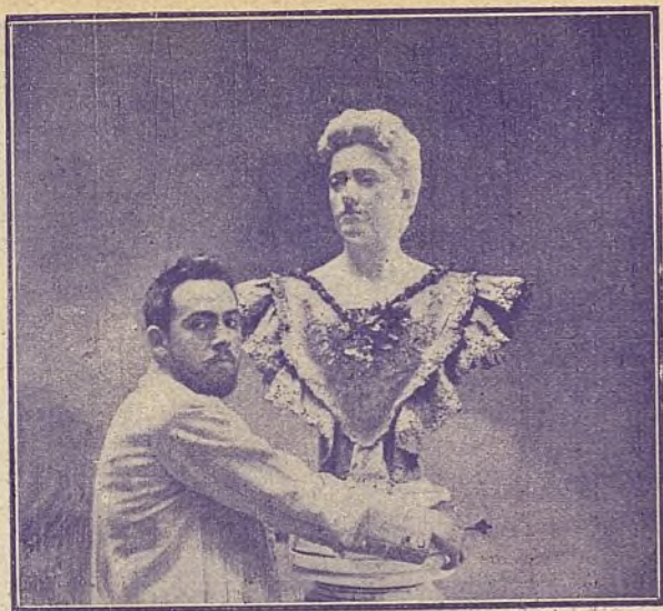
EL NOTABLE ESCULTOR SR. MARINAS, COLOCANDO EL BUSTO PRESENTADO POR ÉL EN LA ÚLTIMA EXPOSICIÓN DE BELLAS ARTES