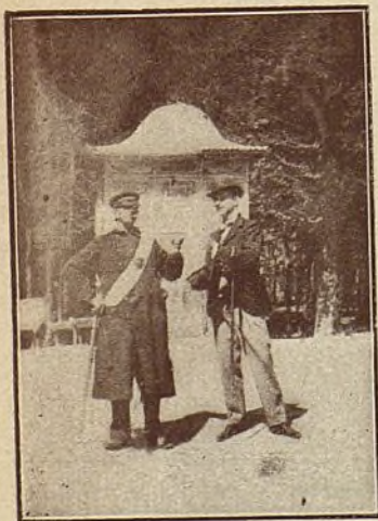
DISPENSE USTED, NO COJO FLORES