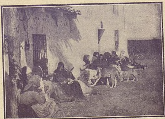
COMIDA DE VENDIMIADORES

«Inolvidable Rosa: Como sé que no eres envidiosa, te puedo hacer saber que me he casado, y que soy muy dichosa, muy dichosa... ¿Te acuerdas de aquel novio que tenía cuando era colegiala, del cual, Sor Magdalena me decía, que queriéndome me iba á hacer muy mala? ¡Pues el mismo, hija mía! Después de mucho tiempo de no vernos, pues... nada, que volvimos á querernos. ¡Qué carta me escribió! «Mi vida entera, decía, es para tí; y cuando me muera, el alma que te adora, dejaré en ese cielo prisionera... y te pido, postrada la rodilla, que pronuncie tu boca encantadora otro sí como aquel que de chiquilla tu boca pronunció por vez primera...» Y luego, una postdata muy sencilla: «Sabrás que he terminado la carrera.» ¡No me acuerdo! Decía tanta cosa... ¡Ah! Sí que me encontraba más hermosa . ¡Qué carta! una monada... pequeñita ... ¡y cuidado que estaba bien escrita! Yo, claro está le contesté diciendo: «Mi querido Fernando: Como hace tanto que te estoy queriendo, y no lograba verte, ya me estaba cansando, no sé si de esperarte ó de que quererte.