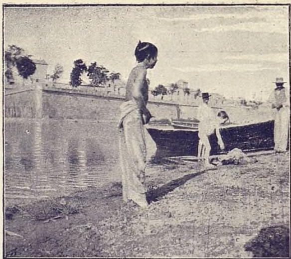
CÓRDOBA: Baño de chicos