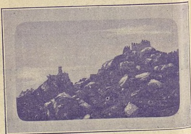
PORTUGAL. CINTRA. CASTILLO DE LOS MOROS Ayuntamiento de Madrid

Entre rros de ap guetona efluvios notas rep ciones, v najes qu