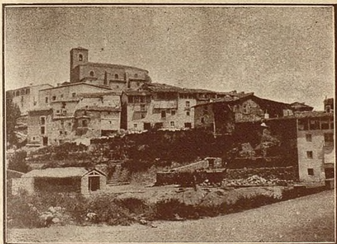
SAN ROMÁN DE CAMEROS