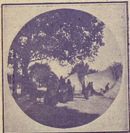
BILBAO: CAMPAMENTO DE GITANOS