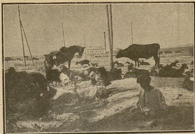
CÓRDOBA—Feria de ganados.