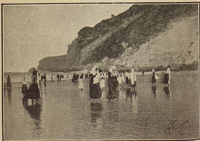
PORTUGAL—Playa de Nazareth.

Permita el cielo que la veneración y el respeto á los sapientísimos seos de Jesús , como símbolo del supremo saber, sea la moda del porvenir, y que bien interpretada