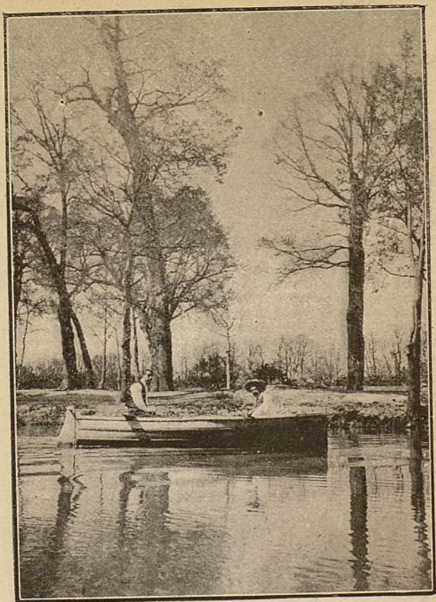
ARANJUEZ—En el río Tajo.