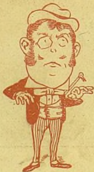
! y toca el piano....