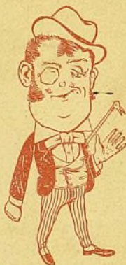
porque es simpática!