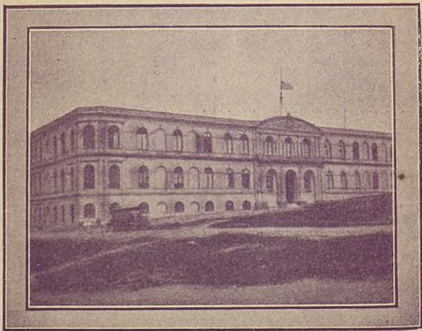
MONTEVIDEO—Escuela de Artes y Oficios.

JAQUECAS Con la Valerolina García Monreal, se calman instantáneamente toda clase de dolores de cabeza, neuralgias, jaquecas, muelas y dolores nerviosos.—De venta: Farmacia Lletget.—Carrera de San Jerónimo.—Madrid.