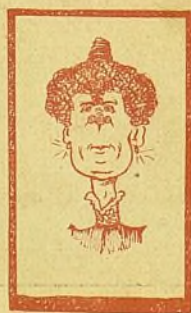
que es la cara.