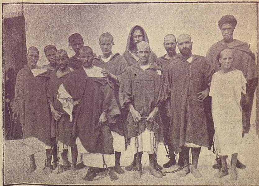
MARRUECOS Moros de Bocoya.