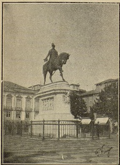
PORTUGAL—OPÓRTO—Monumento á D. Pedro IV. Inst. de F. Viegas.