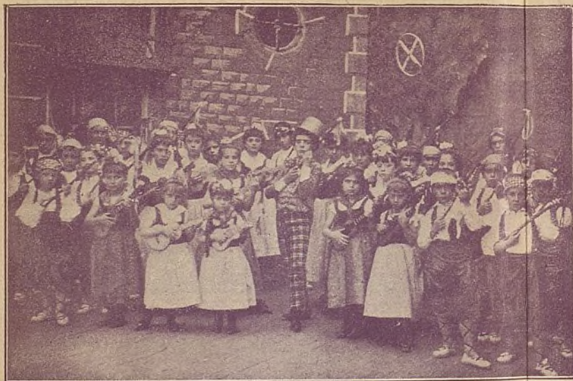
MONTEVIDEO—Cuadro lírico.—Infantes del Centro gallego.—Serenata de las tentaciones.