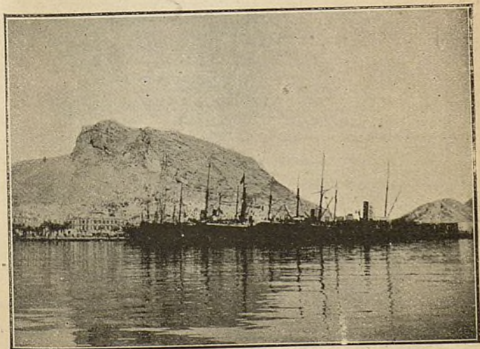
ALICANTE. Muelle de Levante.