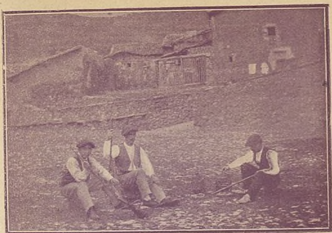
TERUEL—TRAMACASTILLA—Antes de la caza. Inst. de L. Valero.