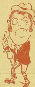
Solo tiene una dificultad