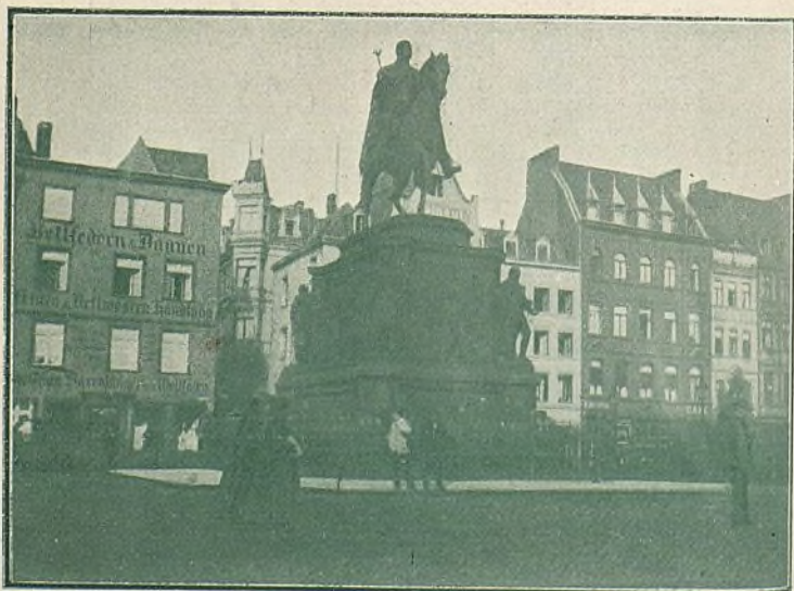
Alemania.—Estátua ecuestre en Colonia.