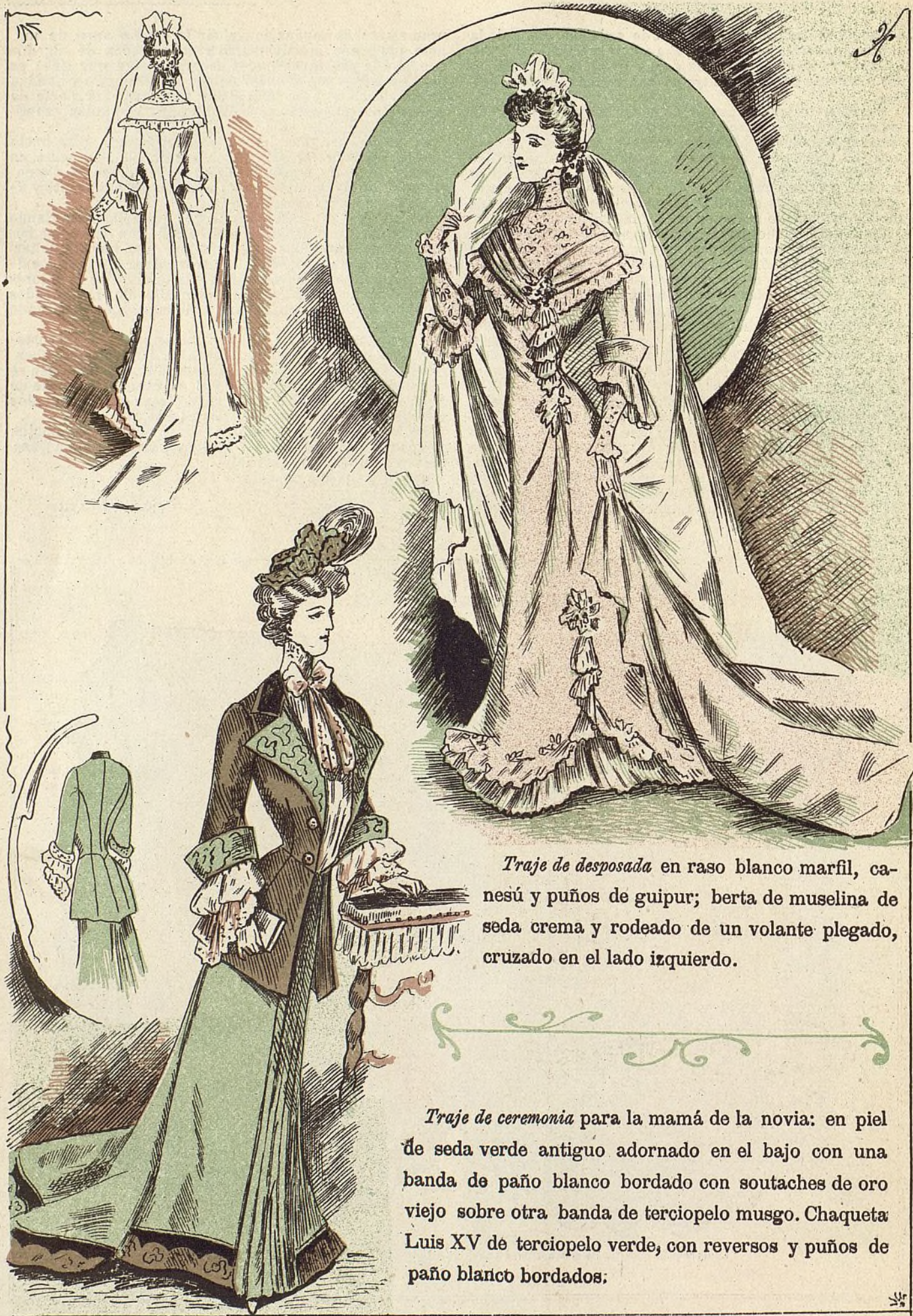
Traje de desposada en raso blanco marfil, canesú y puños de guipur; berta de muselina de seda crema y rodeado de un volante plegado, cruzado en el lado izquierdo.