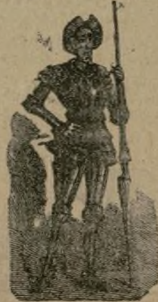
olla de algo más vaca que carnero, apicron las mas noches, duelos

Tenia en su casa una ama que pasaba de los cuarenta, y una sobrina que no llegaba á los veinte, y un mozo de campo y plaza, que así ensillaba el rocin como tomaba la podadera