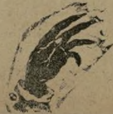
Dicen de Jerez que circula la noticia de haberse descubierto un nuevo crimen, producido de La mano negra . El juzgado, acompañado de una pareja de la guardia rural, salió el 30 para el cortijo de Ro-

Su mujer está empleada en el canal de Isabel II.