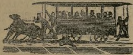
gravemente herido y con pocas esperanzas de vida.

Ayer tarde a las cinco y en la calle de Toledo, un sujeto que intentó subir en un coche del tranvía por la plataforma anterior del coche, cayó al suelo, siendo arrollado por el carruaje, resultando