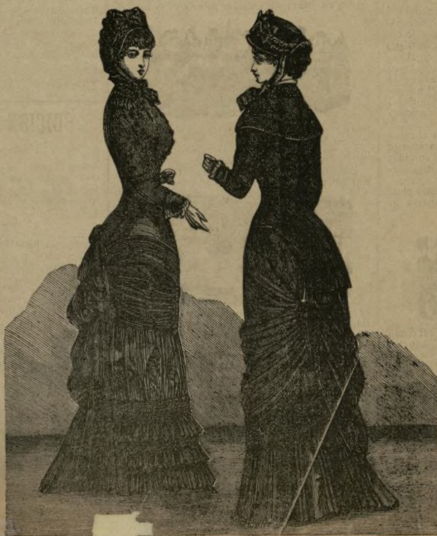
TRAJES PARA PRIMAVERA 70 PESETAS