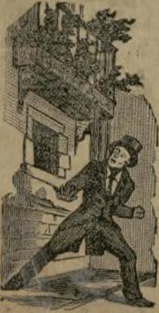
La emoción es fría!

No es muy agradable la sorpresa que representa este grabado; pero mucho menos en la estación de invierno.