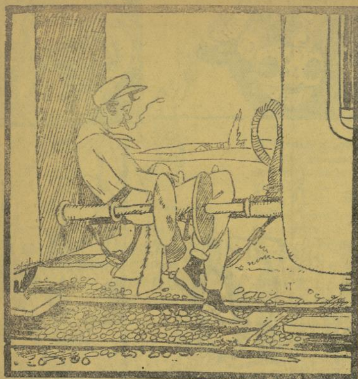
—¿Hacera hiá qui se queixa d' anar en tersera!