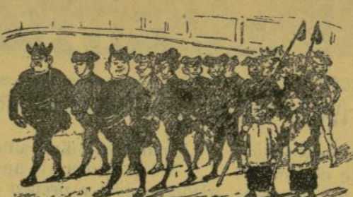
Desfile de la cuadrilla.