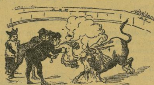
Fuego al marrajo.