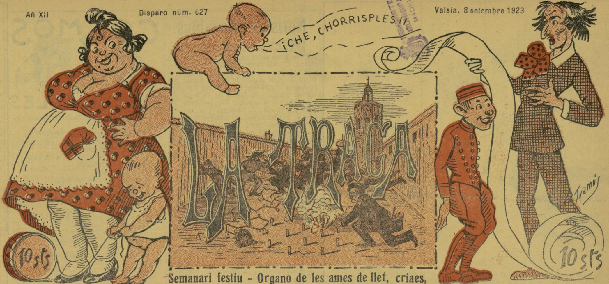
Semanari festiu - Organo de les ames de llet, criaes, cuineres, niños y melitares sin graduasi6n