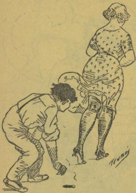
El pillet.—Asó de replegar colilles es molt difísil. Yo en ma vida me les he vist de més groses.