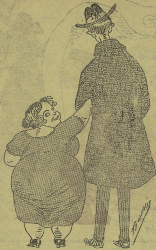
—Nemesio, Nemesio: eixe home me mira!...