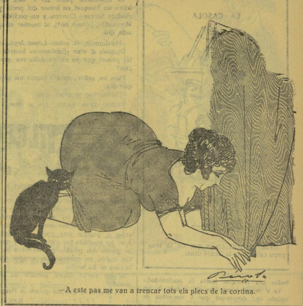
—A este pas me van a trencar tots els plec de la cortina.

Mos parese buena idea, y por ello se soseribimos en dies sétimos al quinquenio para tan loable fin.