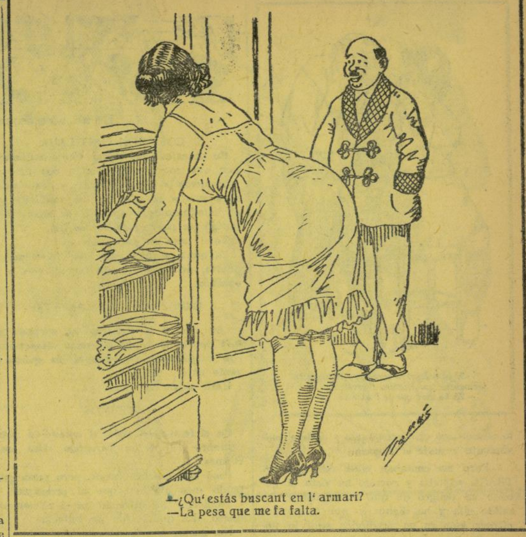
¿Qu' estás buscant en l' armari? -La pesa que me fa falta.

ADVERTENSIA Habent caducat el plaso del concurs, preguem als lectors se abstinguen de remitir més contestacions, pues no més en les que hiá residides tenim pera ralo, si no se mos occurri fer un extraordinari en l' obchec-te de publicables totes de una vegá.