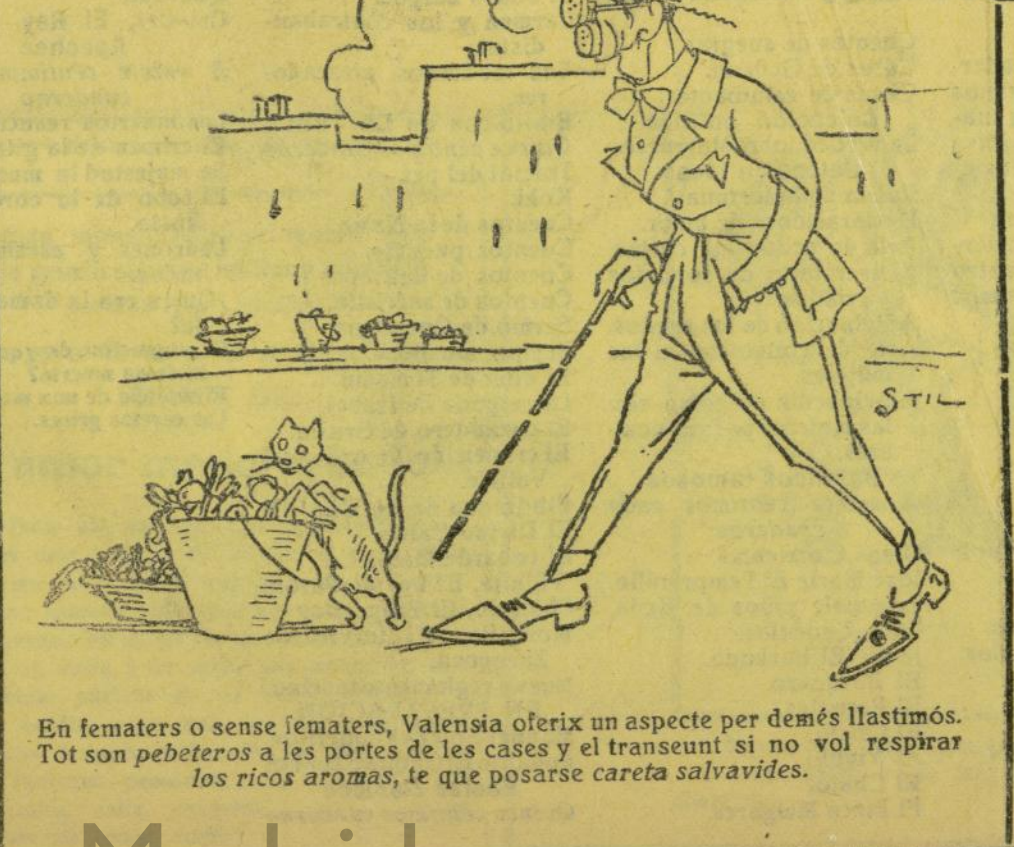
En fematers o sense fematers, Valencia oferix un aspecte per demés llastimós. Tot son pebeteros a les portes de les cases y el transeunt si no vol respirar los ricos aromas, te que posarse careta salvavides.

Vixca «La Traca», les falles, la dansaina y tabalet; vixquen molts anys les albaes, Valencia y el Micalet. Francisco LACOMBA