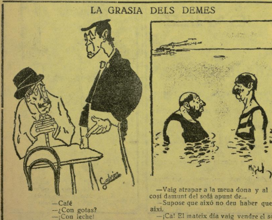
—Café —¿Con gotas? —¿Con leche!