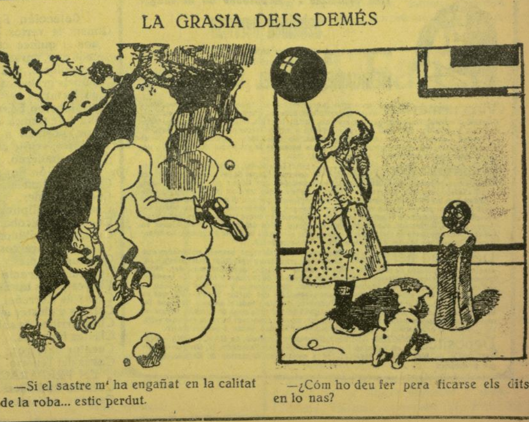
—Si el sastre m' ha engañat en la calitat de la roba... estic perdut. —¿Cóm ho deu fer pera ficarse els dits en lo nas?