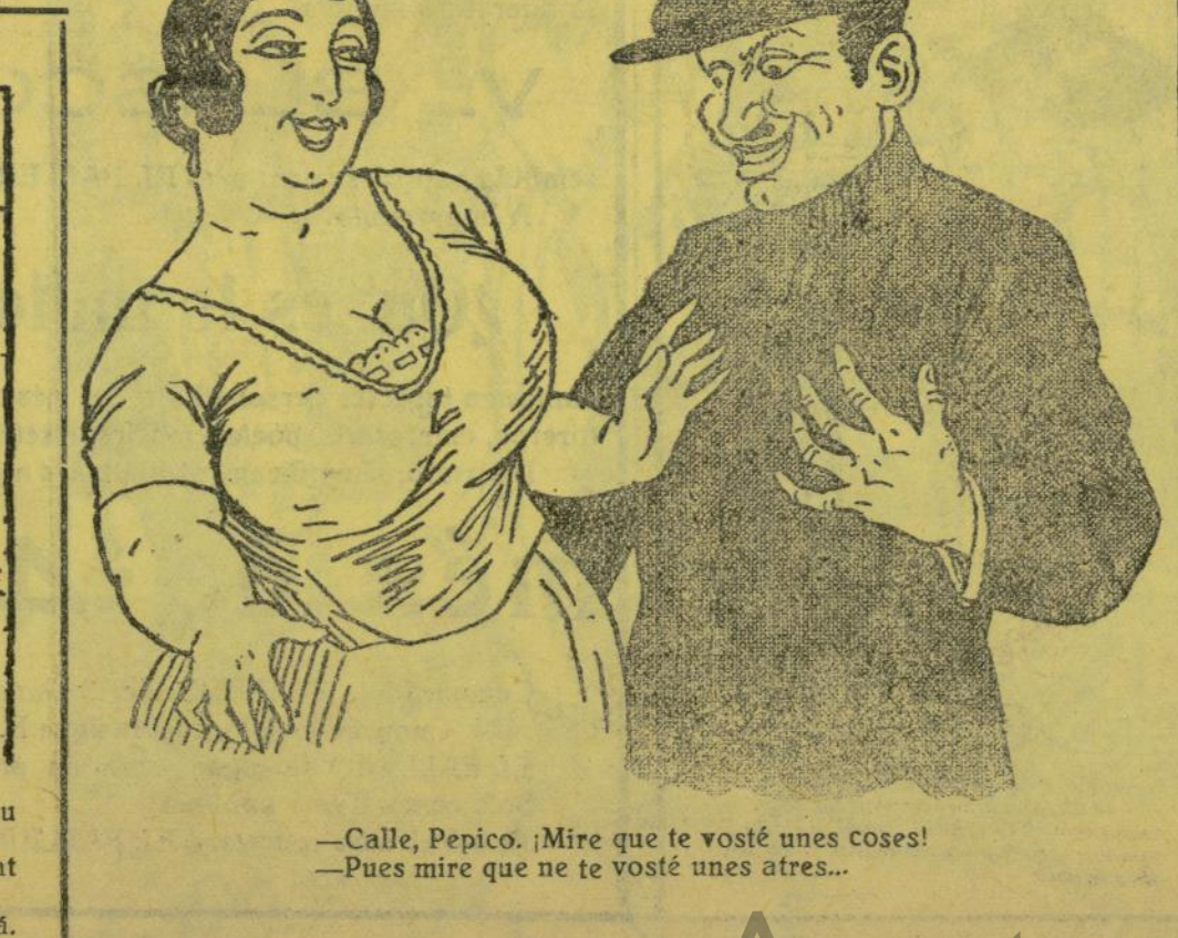
—Calle, Pepico. ¡Mire que te vosté unes cosas! —Pues mire que ne te vosté unes atres...

Vixca «La Traca», les falles, la dansaina y tabalet; vixquen molts anys les albaes, Valencia y el Micalet. Francisco LACOMBA