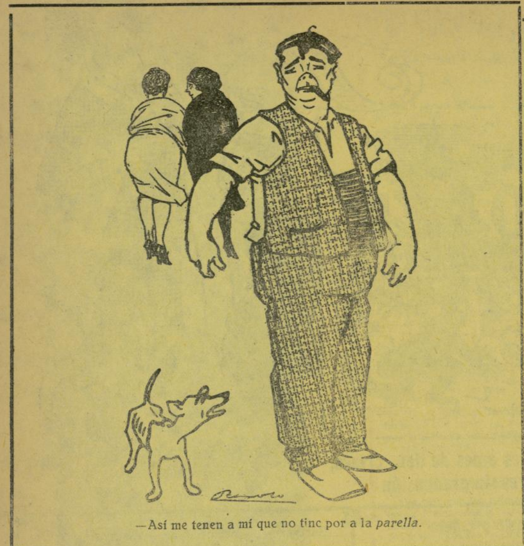
—Así me tenen a mí que no tinc por a la parella.