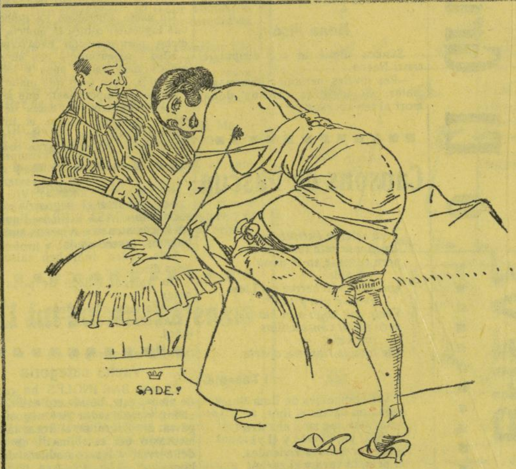
Ella.—Esta nit habera anat millor al sine. ¡Se admiren alñ tan hermosos panorames! Eh.—¡Calla, tonta! Así també se n venen de bonicos.

139.—La posaría en porreta; la engancharía a un carret de ma y yo y sa filla dalt del carro tirant de les riendas y yo sent. (1) (Sinceritat sobre tot.)