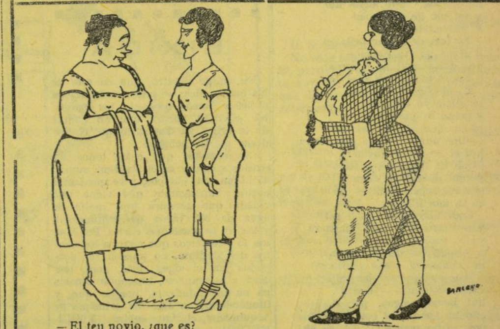
—El teu novio, ¿que es? —Cacahuero. —¡Ah, vamos! Ara comprenc per que separen les vespraes en el sine torrant el cacau.

En su primer viaje recorrerá las calles del Cabanal y se parará a la puerta de los sines.