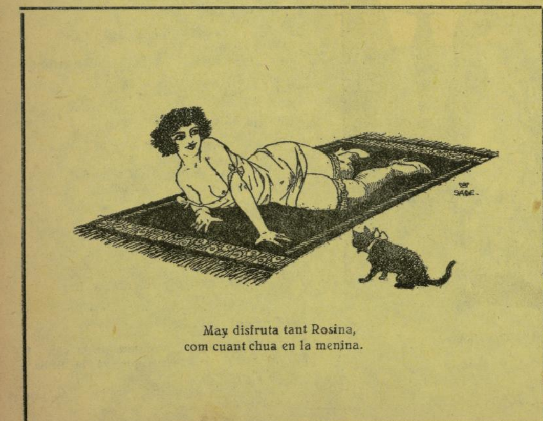
May disfruta tant Rosina, com cuant chua en la menina.

parella de carabineros de cuota y la querían decomisar por contrabando. Menos mal qu' ella se anternesió con su relato y que dapon desarmados con sus paraulas. —Es mucha Nasia la vuestra. —No lo sabes tú bien. Bueno, pues si después la habieras visto jalar, vete tú del tío Bartolo. Ella paquemaos, llouganisa, huevos, lletuga, rofrada, formache, olivas, magre, taronchias y al final sua tenía animos para una pera. Pues, ¿y beber? En cada trago un hito y poetas desir que se hizo más trags que números hase el señor Tomás. —En fin, qu' habéis goase la Pascua. —L' hemos goase, l' hemos goase. —¿Qué me dices del crimen del Correyo d' Andalusia? No m' hables d' ese asunto, que vasitá llarda mos dona la Prensa diariara. Para los predichos «serios» ya no hay más problemas; que averiguar cuantos ayes y chemecos llansaron las vilimas antes de dñarla, y cuantas tonterías dices los asesinos para atenuar su repugnante crimen. —¿Tavle parlan del asunto? —Calla, hombre después de leyer la Prensa l' acuestas y las más terribles pesacillas s' apoderan de uno. Se soeña con «figre, puñales, pistolas y muertos calaveros». —M' estás poniendo de punta las pelos del rabo. —Poes a otra cosa. A ver si averiguas en que se parese una gallina a un naufragio?