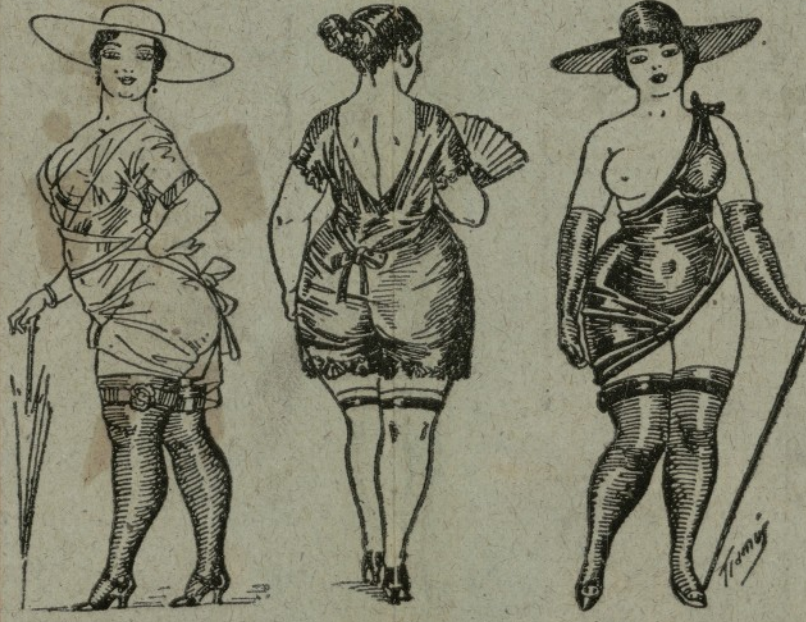
Traje de paseo para chica en estado de merecer. El dibujo es de una chica de la moda, que se llama a la moda, que se llama a la moda, que se llama a la moda. Traje de playa para señora casada. Hase una figura correcta y elegante, sobre todo si se acucua a plagar puchinas. Técnica de paseo para viudas un poco de alivio y con ganas de Himenoso. Además del bastón deberá puerse en la mano una caixita de vaselina no perfumada. Los perfumes siempre son buenos en las modistas.

Revista Aligante Lema: "Todo por la mujer y para la mujer" FIGURINES PARA TRAJES DE VER-ANO, ULTIMA CREASIÓN