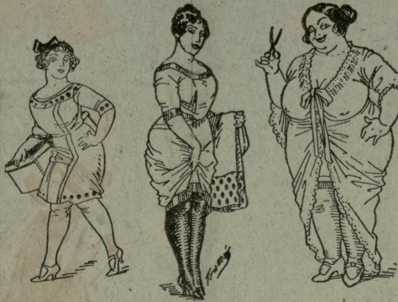
La que torna els trachos. Una faldera (es que fa faldes, no confusió, diria sa un gosó).