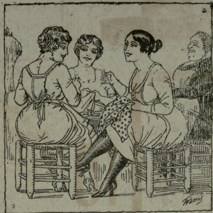
La ofisiala.—No m'agraen les agulles llargues perque trenquen el fil. La mestra.—Tontal! Si quant més llargues son millor!