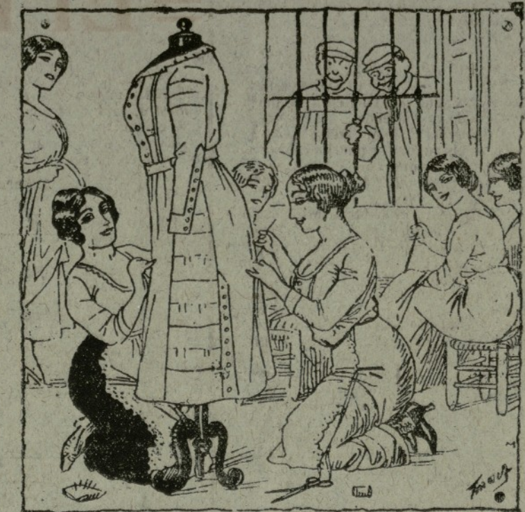
Ú deis de fóra.—Alsense de térra, que a mosatros mos agranen dretes. Totes a cór.—¡Y a mosatros també!

¡Ay, modista, de figura guapa y lista que trabajas la batista, la cretona modernista y el percal. ¡Ay, quitana! por tu carita serrana y tus morritos de grana, m' agafa una malagana y estoy hecho un animal. No está mal. Tú dibujas los perfiles, los encantos femeniles que losiendo los perfiles muy sotiles causan la dislocación. Tú retocas las caderas con tus manos sicalteras y altaneras a casadas y solteras y armas la revolución. ¡Rotoplom! Con tu agüja y tu didal estás ganando un jornal colosé mal. poro con tu corte hermoso, sicaltero y saleroso, puedes venir con reposo y guañarte un dinerál. Si esto te parese guasa ven mañana por mi casa. Serafin Sebelino Chortripas.