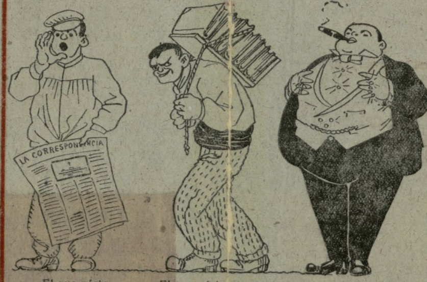
El que porta la Correspondencia El que porta els llibres El amo