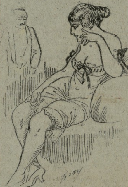
Ells.—¿Cuánta tela creus tú que necesites pera un trache? Ella.—Tú necesites una pesa, no cap ducte.

En comersos de valia es moda el haber hui en día una cachonda caixera de guapura sicatera qu' et cobre la mercansia. Sobre regio pedestal, tancá en urna de cristal com una maredueta, pa cobrar trau la maneta rient sos labios de coral, ignorant els punts que calsa, alguna peseta falsa volen ficarli a la chica; pero ningú li la fica perquè ella té molta salsa. Les gallettes com dos pomes s'enroixen de les bromes dels clients atenciosos, y sons ulls asabachats volen com chentils colomes. Els dependents de la casa tenen el còr qu' el sabrasa y senten loca pasió; pero ella en gran tesó a tots dona carabasa. Dependents chovens y vells ronden com mustios ausells el colomer de l'alhaixa, ¡ij diuen qu' está en la caixa!... ¡Qui está en la caixa son ells!