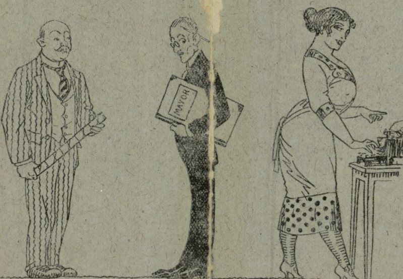
El jefe del mostrador. Te una micha vara que es la envucha de les parroquianes. La mecanógrafa. Que també folia prou be.