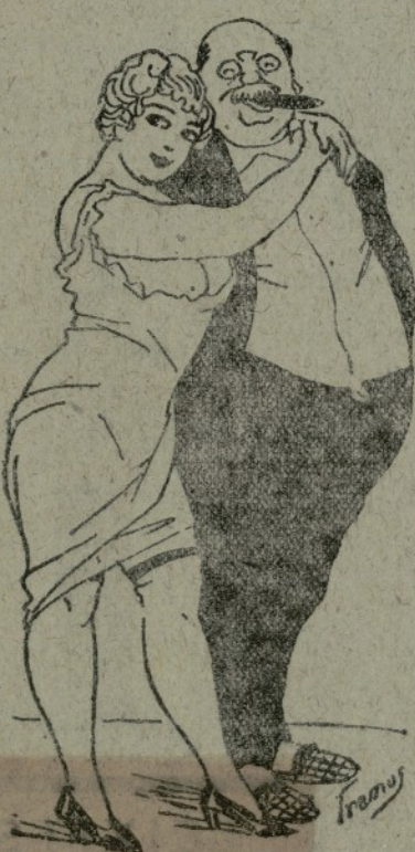
—He fet l'inventari y resulta que en sent mil metres de tela que he venut he guafat cinquanta mil duros. —Això no es res. Yo en un pam me trac una renteta molt desent.