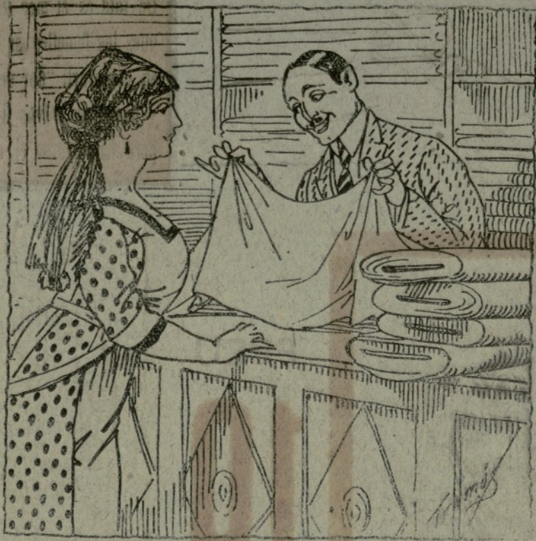
El dependent.—Si li agrà el teixit, li 'n tallaré mica vara. La Compradora.—¡Ca! Ye en un pam ne tinc prou.