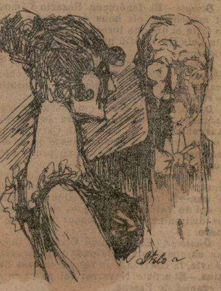
EM.—M' agraa els frares trespenses perque fan un chocolate riquisim. Ella.—Dime a mí, que soc la reina del morenillo.