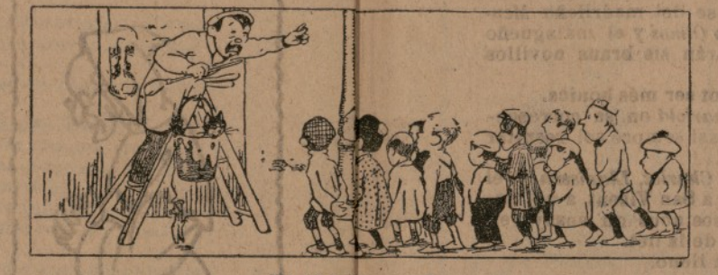
En té intaor y flero els regaña cartelero.