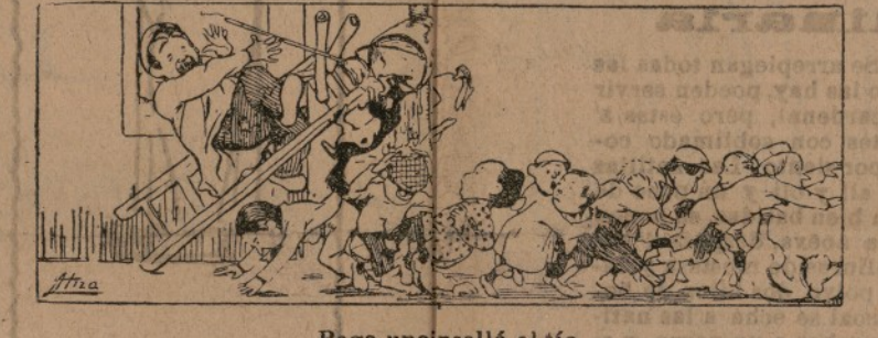
Pega unanissell el tio y s' arma uremendo llo.