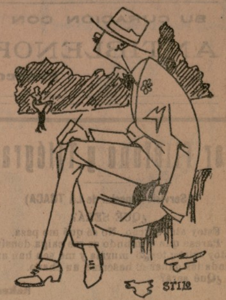
—Churaria que he vist entrar a ma muller en eixe convent. Com son de La Trapa tinc por que me l' atrapen.

Protesto igualmente que no se haiga excomulgao al autor d' aquella sarsuela que s' antetula Pepe Hillo y en la que hay un coro que canta: Ese fraile motillon que se quiere hacer torero, que se vaya a repicar las campanas del convento; qu' es una manera muy ruda de tra- tar a los frailes, encara qu' este seya un motillon. En fin, señor traquero, voy a ter- minar porque esto se va hasiendo largo. Dejo por alto los muchos can- tares que podría citar y en los que se mos sarandera de lo lindo, confian- do de que osté, compenetrado de las queixas que dejo traslors en este aschito, mos traerá bien y no afe- chirá neña al fuego; pero si m' an- quívoco y tirando las patas por alto mos soelta una de la suyas poniéndo- mos en redículo, entonses... ¡ah, en- tonses!... Fraile mostén, ¿Tú te lo quieres? ¿Tú te lo son? Mi despesio a osté sería tan pro- fundo que estoy seguro que li lleva- ría las ganas de mechar. Aprovecho gostoso esta ocasión pa beneirio per in sècula seculorum. FRAY SETRILL.