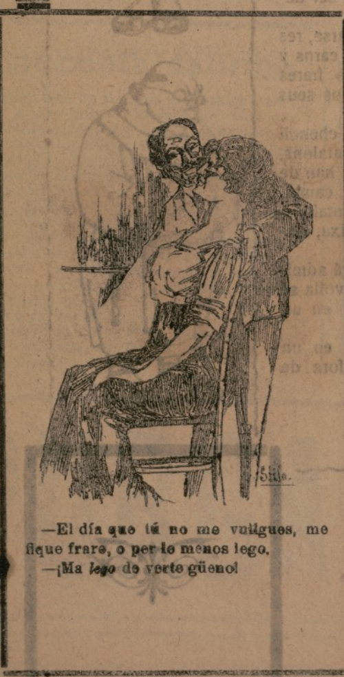
—El día que tú no me vulgues, me fique fraro, o per lo menos lo. —Mia lego de vorto güeno!