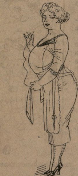
—No vullc que ningú s' acostc quant este cósint porque tots volen trencarme el fil.