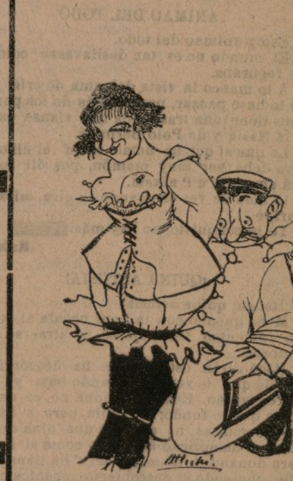
—Mira, chica, yo no pue achustarte más el coset. —Pareix mentira que sigues achustao.

Y con un poquito más... no se si m' antendéras. OASTANA. Cuber fon mercantiler y se feu molt embustero. Se feu después reformiste y ara es el gran trampoliste. No con quien naces, mas con quien paces.