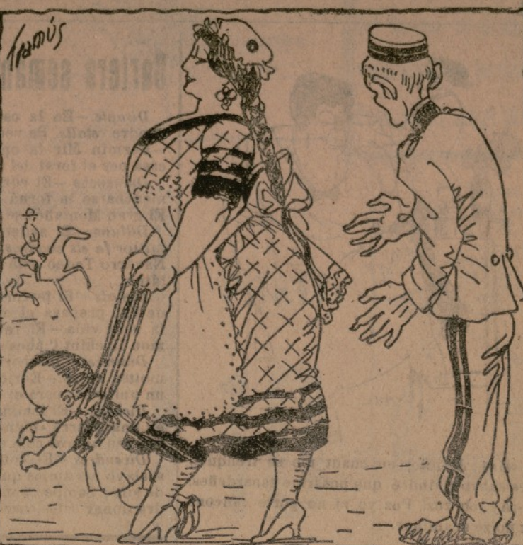
El quinto.—El meche m' ha dit que prenga molta llet. El ama.—Pues amorres a la font. El quinto.—Es que me recomana que siga de burra, per aixó me dirichixo a vosté.

El pleit del Achuntament y la Diputació, amenaça una catástrofe de la que no van a quedar ni els rabos. Mosatros ni volem entrar ni eixir en la cuestió. Sabemos qu' esas cuestiones acabarán al final, puchant tas contribuciones y apretamos el dogal. La Gasetta ha publicat una Real Orde obligant a les empreses periodísticas a que puchen el prou dels diaris. Es una medida molt asertá. Ya fa tems qu' els diaris están pordent diners, y alguns d' ells, para viure, se venen obligats a recurrir a procediments inconfesables. El paper de un eixemplar de cuasevol periódic, dels que se publiquen en Valensia, val més de sis séntims. Además hiá que posar el gasto de redacció, administració, servisi telegráfic e impronta. Después de confeccionat, val més de 8 séntims. Y la empresa se veía obligá a vendre el periódic a tres séntims, pera qu' el venedor guañara dos de comisió. ¿Era posible viure aixina? La Traca, com no reeixib subvencions de ninguna compañía poderosa, ni te negoció en Achuntaments, ni Diputacions, ni mangia de les empreses, ni cobra de les cases de choe, ni admittix estafes de ninguna índole, puchá el preu a deu séntims fa sis mesos, y aixina es com podem sostindre decorosamente.