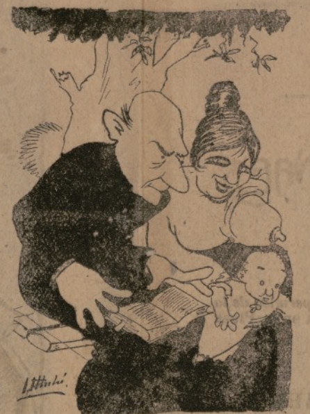
—¿De manera qu' está vosté de ama de ería? —Sí, señor. Esté de ama en casa un viudo que me dona deu duros al mes, me calsa, me vist y me despulsa.