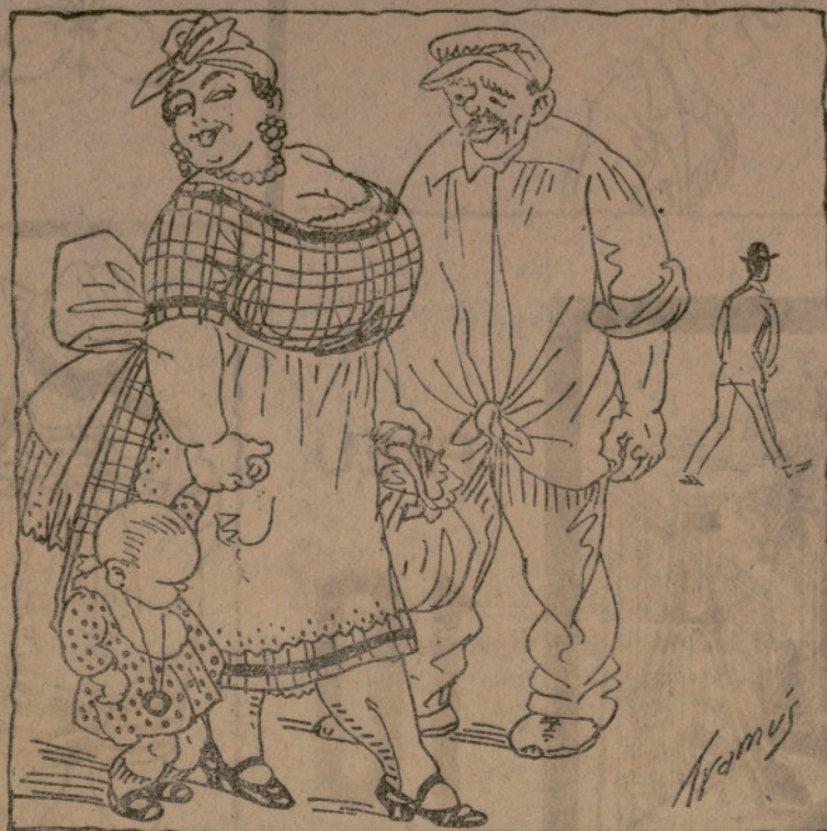
—Vacha en cuidao qu' en lo cares qu' están les subsistències, perillon eixos dos restaurants.