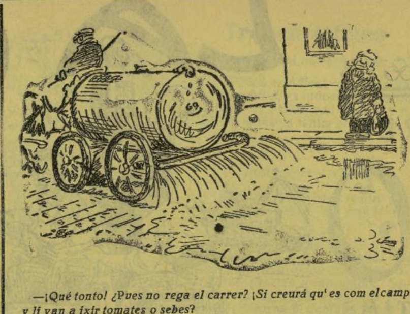
—¿Qué tonto! ¿Pues no rega el carrer? ¡Si creurá qu'es com el camp, y li van a ixitr tomates o sebes?