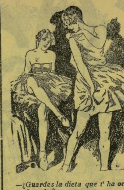
—¿Guardes la dieta que t'ha ordenat el metje? —Y tant com la guarde. ¡Com a que a causa de les chales que tinc diaries encara no he fet us d'ella!