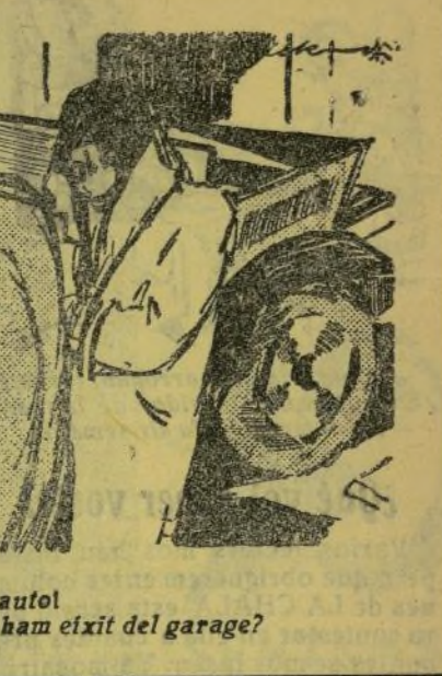
—¿Mos han robat el magno del autol? —¿Estás segur qu' el tentes cuan ham eixit del garage?