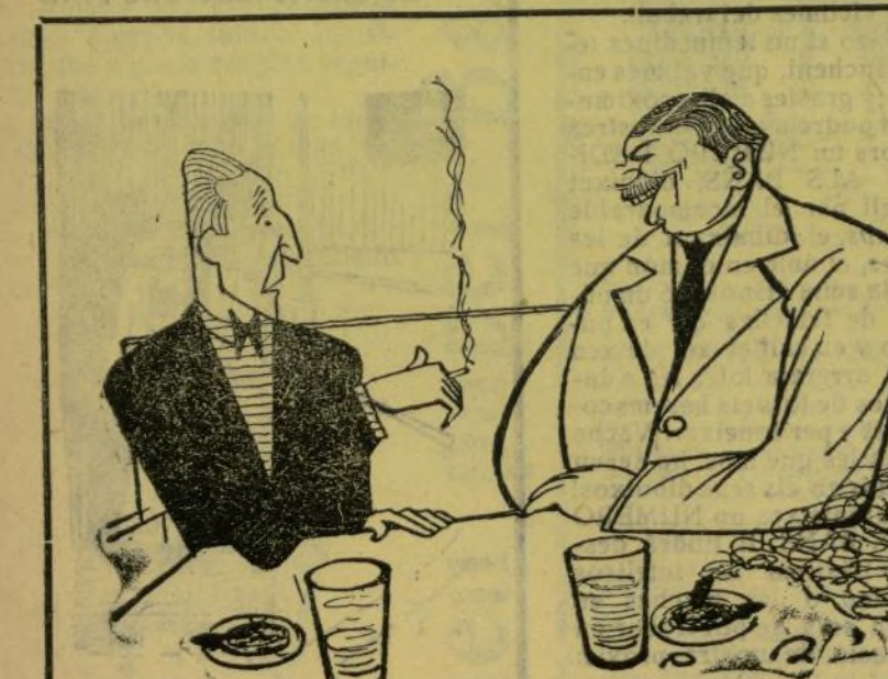
—La beguda fa els macheros «estragos» del món. —Es veritat; yo soc molt desgrasat quan no me fas un «trago» de xixos.

—Tirrrrrrr. Tirrrrrrrrrr.... —¿Estás ahí, dimonio? —Pa lo que vulgas manar. —Pos mira, has que no fasa tanta calor. —No me pidas imposibles. ¿Cómo voy a fer que no fasa calor siendo yo quien la doy a cabasadas? —Es veritat; demanarte eso a ti es como demanar peras a un melonar. En fin, deixemos la calor y vamos a parlar de cosas importantes. —Sí, sí. —Primera: la prensa valenciana se ha apuntao un éxito pisto y nudo. —¡Holá! ¿Con qué? —Con una campaña que había mamprenido contra la Compañía de tranvías. —Eso es interesante. ¿Coenta, coenta! —Pos la opinión general y hasta mariscal de campo era que los tranvías no pasaran por la calle de Pi y Margall, pedaso entre Lauria y Colón. —Sí, ya m'enteré d'aquello. —Se volía qu'el esmentado pedaso de la esmentada calle se convirtiera en calle-salón. —Sí, d'eso s'hablaba. —Pos bien; ya s'ha resuelto la cuestión. —¿S'han suprimido las líneas de la calle dicha? —¡Una full! Lo que s'ha hecho es aumentar el tráfico, pasando por allí dos números más; el especial del Sementario y el que había el recorrido Glorieta-Grado, vulgar perrera; con l'aggravante de qu'este de la perrera puerta tres coches cada convoy. —¡...! —Pero mos cabe la esperanza