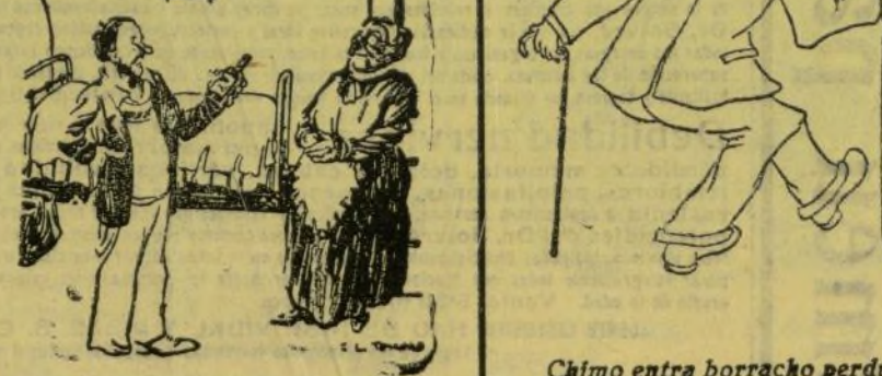
Chimo entra borracho perdat en l'alboba y li diu sa muller: —¿Ya t'has empinat el colse atra volta? —No, dona; es que balle el charleston que veches que no estic borracho.

El huésped. — ¿Qui s' ha begut la meua botella d' aguardent? La patrona. — Yo he segut. ¡No vullc begudes espirituoses en ma casa!