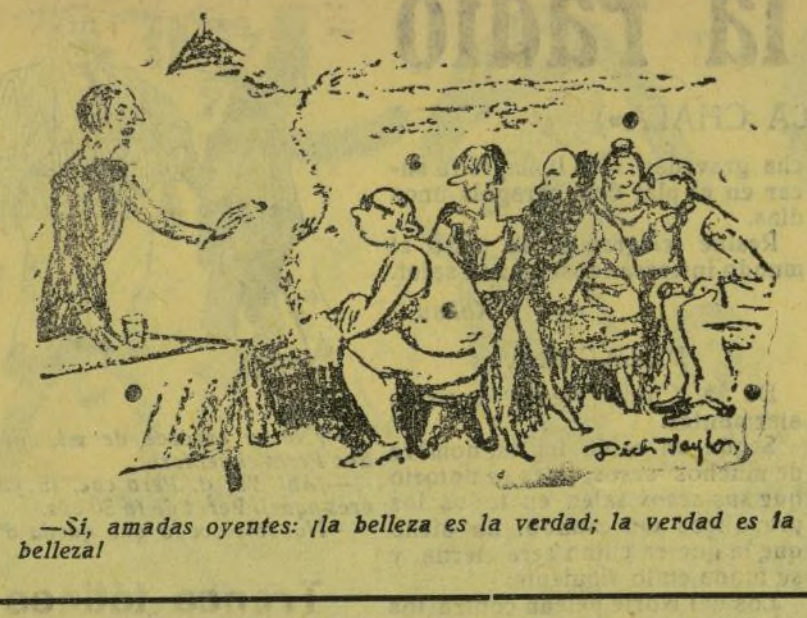
—Si, amadas oyentes: ¡la belleza es la verdad; la verdad es la belleza!

—¿Quin Adam? —¿Retos al segundol (Retos al segundol) Aixó criaba un retratista una fira a la portada un barracó.