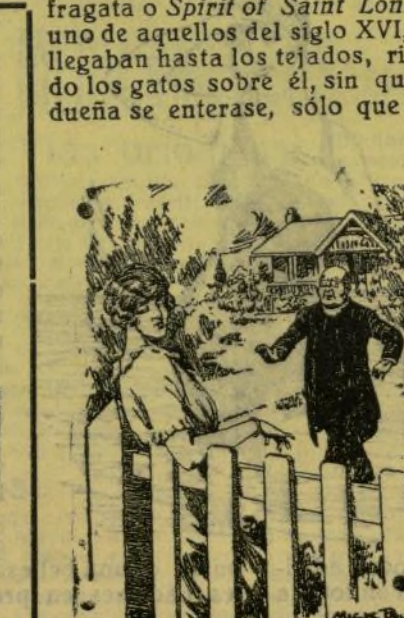
—¿Es serit que t'has besat en una gaita aqull chove? ¿Y tá que has fet? —Recordar la máxima de Chesucrist y presentarlí l'atra gaita.