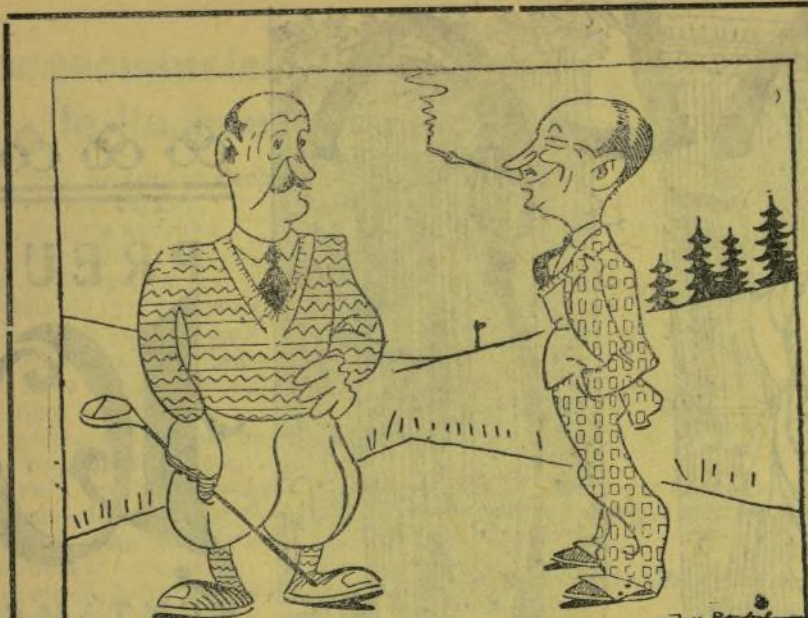
—Y es que ara te dediques a chuar al golf? —Sí, com no puc chuar al golf, chue al golf. [La cuestió es aproxi- marse]