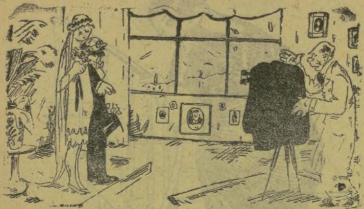
—Posen més alegria en la cara. Recórdensen de quant eren novios.