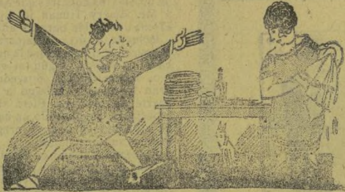
—¡Grasies a Deu que no soc un home en dos cares! —Es veritat. En una cara com la teua encara tens masa.

Por cierto que los besones han cridado mucho l' atención, pos la mayoría, coando los ven en los brazos de su mamá, se creen que el blanco es un anunsio de la leche