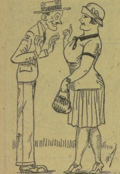
—Bueno, mire, me és tan anti-pático que consentixo casarme en vosté... ¡sols per ferlo rabiá!

NOTA. Todos los pacientes de las vías urinarias, impurezas de la sangre o debilidad nerviosa, dirigiéndose y enviando 0'50 ptas. en sellos para el franqueo a JUAN G. SOKATARG, farmacólogo, Montaña, 79 y Fomento 53, BARCELONA, recibirán gratis un libro explicativo sobre el origen, desarrollo, tratamiento y curación de estas enfermedades.