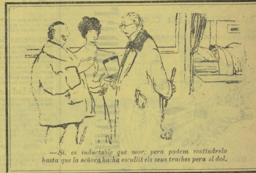
—Si es indubtable que mor; pero podem sostindrelo hasta que la señora hacha escullit els seus traches pera el dol.