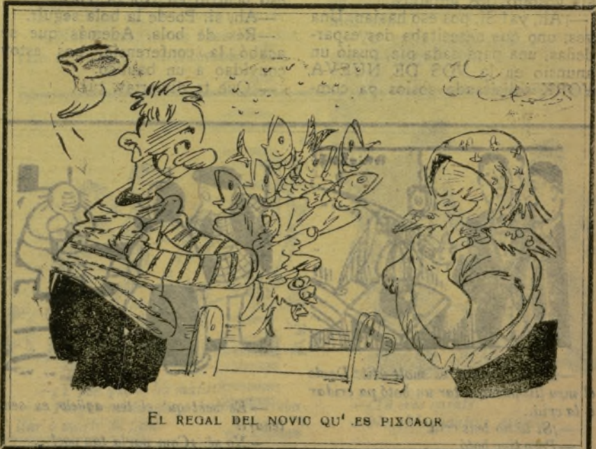
EL REGAL DEL NOVIO QU' ES PIXCAOR