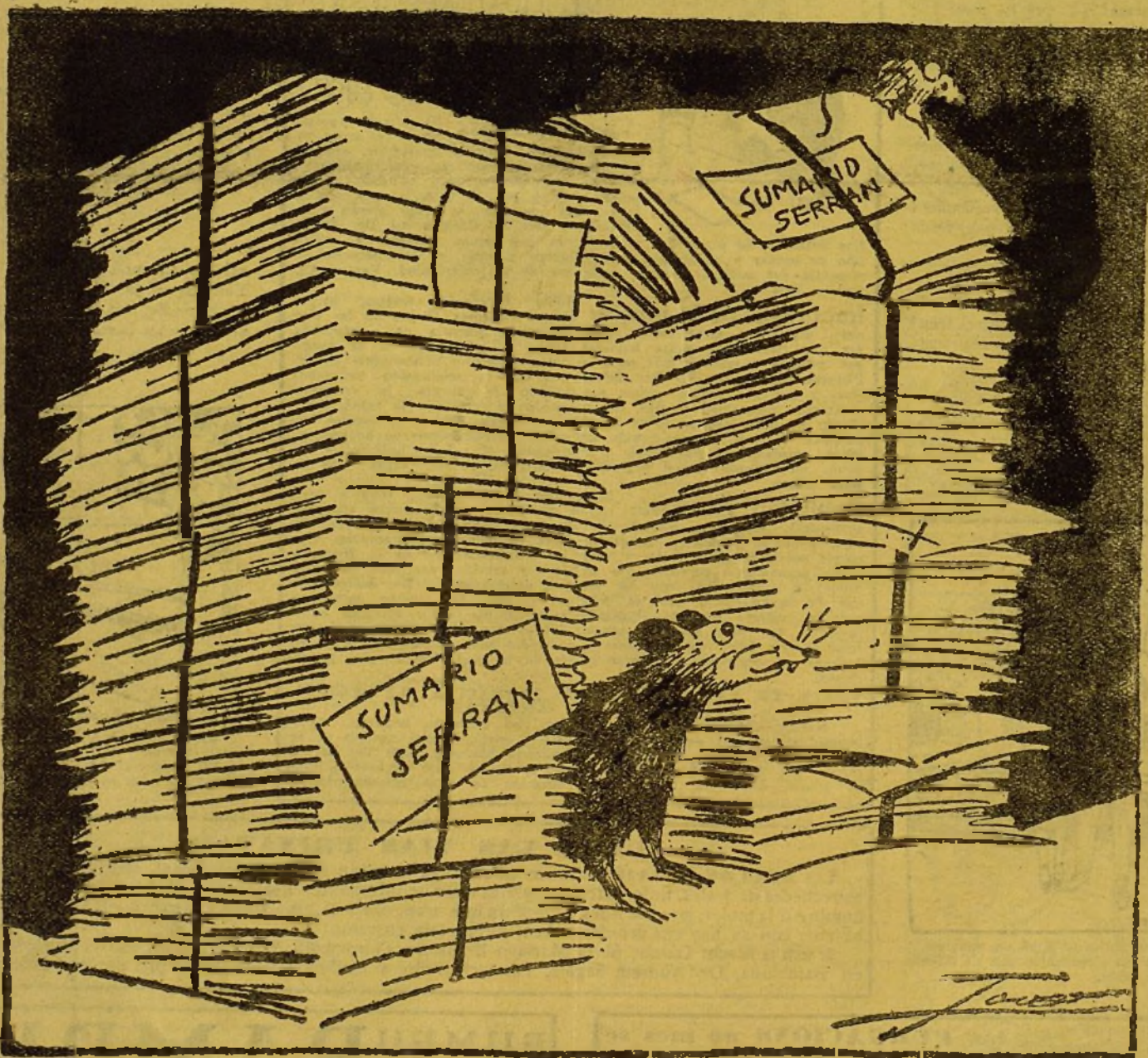
—Nosotros también estem en el secret del sumari. (De La Voz.)