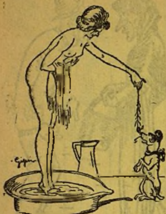
Grupo alegórico, que vol representar "les cosquerelles".