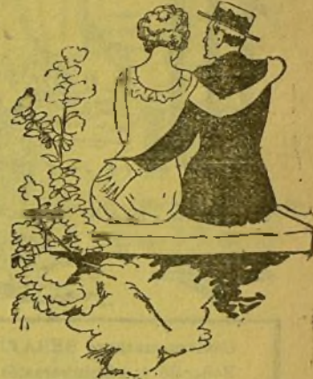
Un viacher galant, que es proposa donar la volta al món, sinse menear-se del puesto.

—Lo que yo admire més no es que descubrixquen les estrelles sino que averigüen els seus noms. Dimanche Illustré.