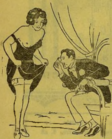
Nou mode de pendre medida d'un modista modernista.

—Asó es insoporable: en quan ixé al carrer se me queden els peus chelats y en quan entre en ma casa comensa ma muller a galfarme les orelles.